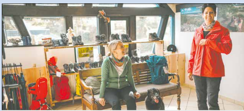
Testcenter für Wanderer: Moderne Ausrüstung kostenfrei ausleihen.

Die Teilnehmerin/der Teilnehmer kann seine erklärte Einwilligung jederzeit widerrufen. Der Widerruf ist schriftlich an die im Impressum angegebenen Kontaktdaten des Veranstalters zu richten. Nach Widerruf der Einwilligung werden die erhobenen und gespeicherten personenbezogenen Daten des Teilnehmers umgehend gelöscht. Fragen oder Beanstandungen im Zusammenhang mit dem Gewinnspiel sind an den Betreiber zu richten. Der Rechtsweg ist im Hinblick auf die Ziehung der Gewinnerin/des Gewinners ausgeschlossen.