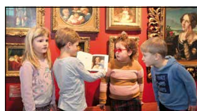
Die Kinder freuen sich über das neue Buch.

waschen“ mit Arbeiten aus dem Museum Begas-Haus in Heinsberg abgebildet werden.