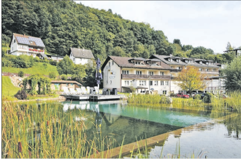
Drei-Sterne Hotel Christel im Herzen des Spessarts