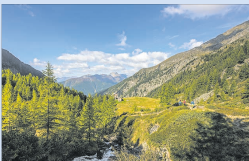
Unverfälschtes Naturerlebnis im Nationalpark

Gewinnen Sie zwei Übernachtungen für zwei Personen im Doppelzimmer inkl. Halbpension im Wert