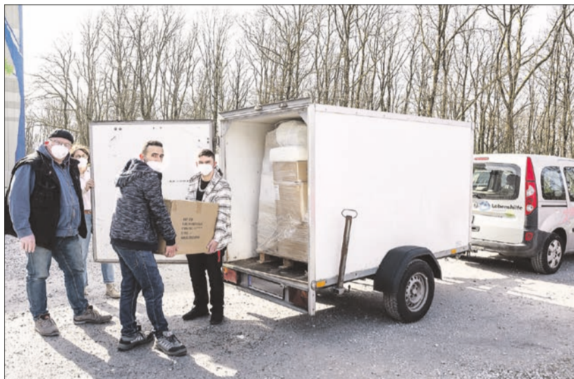
Die Hilfsgüter werden am Wochenende durch die Organisation „Mensch zu Mensch“ in die Ukraine transportiert.