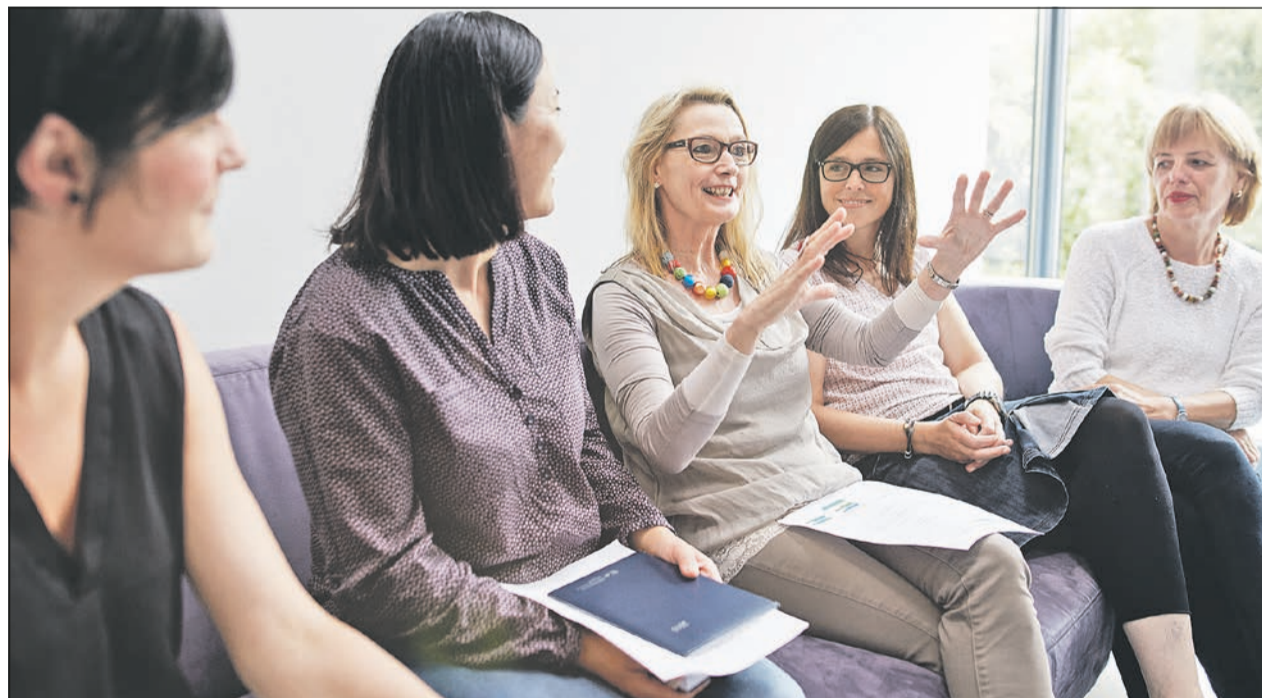
Ein Elternkreis für Eltern von Kindern mit besonderem Unterstützungsbedarf

„Wir laden alle Eltern, deren Kinder einen besonderen Unterstützungsbedarf haben, zu diesem offenen Elternkreis ein. Lernen Sie andere Eltern kennen, die ähnliche Erfahrungen wie Sie gemacht haben. Der Elternkreis bietet: gegenseitiges