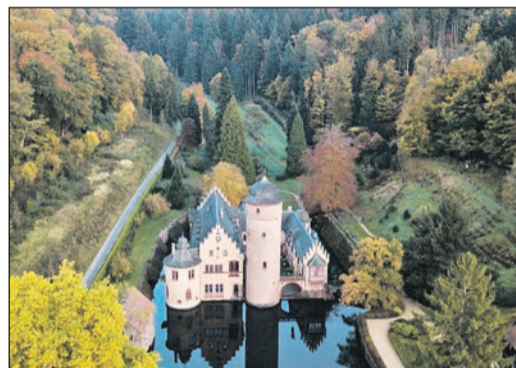
Wasserschloss Mespelbrunn

eine Gruppe. Ich denke, dass das Hotel auch für Rollstuhlfahrer geeignet ist. Auf jeden Fall erst einmal vielen Dank für die schöne Zeit im Räuberland.“ vw