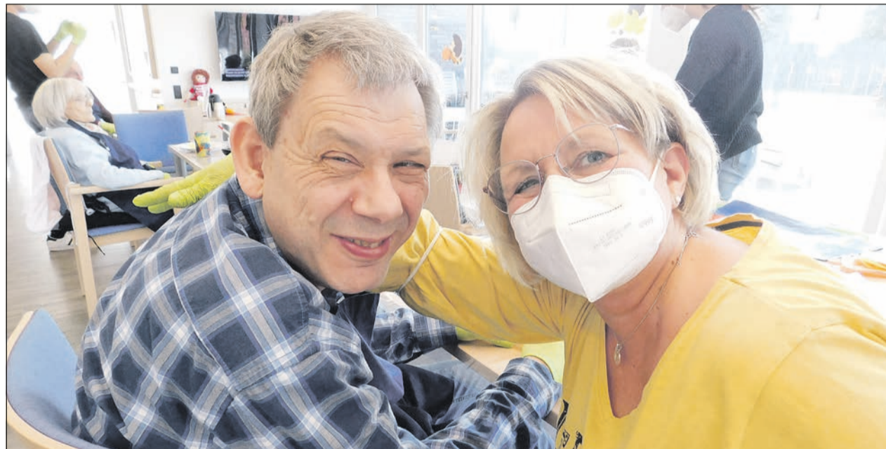
Die Gäste und Mitarbeitenden der Tagespflege freuen sich immer auf neue Gäste.

Tagespflegeeinrichtungen bieten Angehörigen eine Alternative und Entlastung bei der Betreuung ihrer Liebsten. Das Angebot richtet sich an alle älteren Menschen, die tagsüber Hilfe und Betreuung