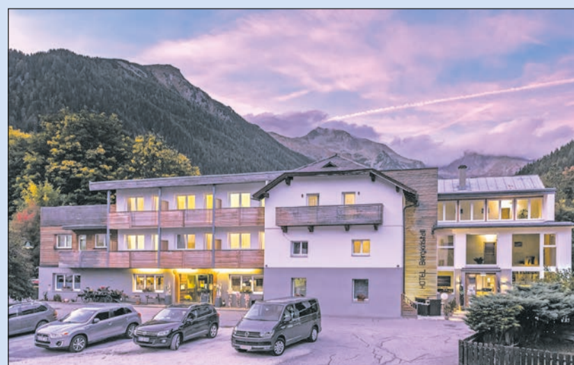
Das Hotel Bergkristall