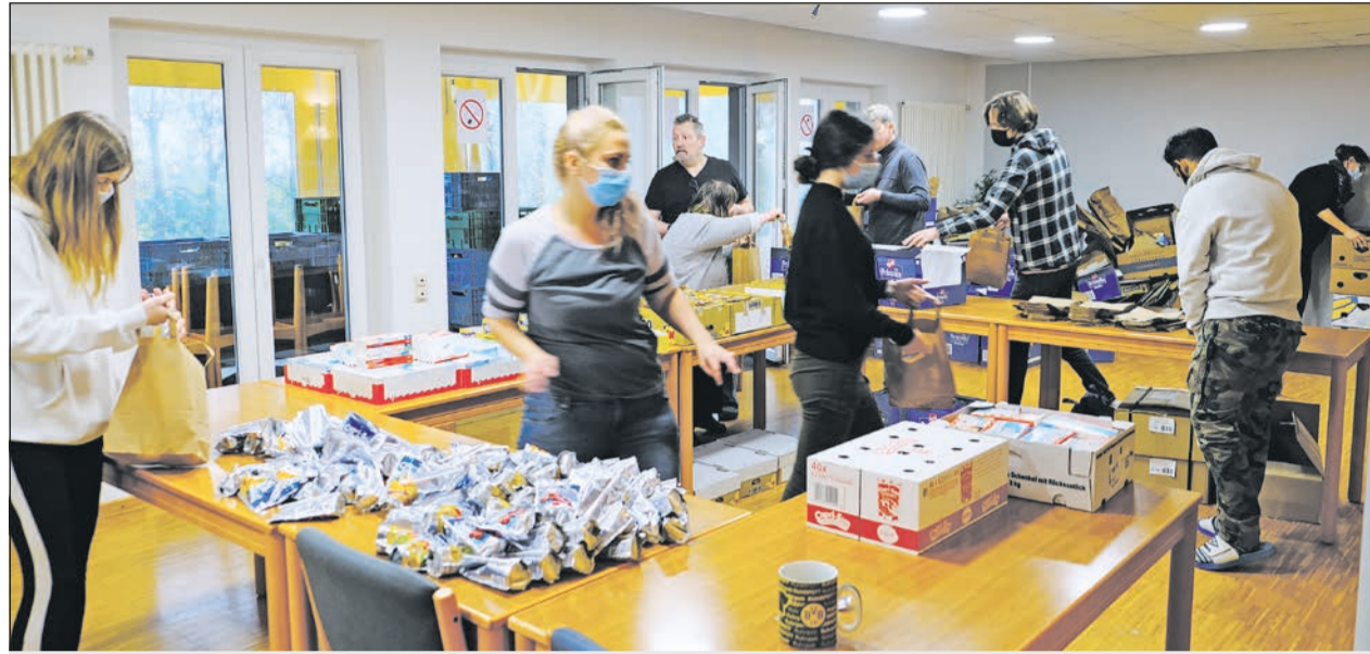
Gemeinsam mit anpacken: 1300 Martinstütten für Kinder aus Bad Münstereifel

Doch auch an diesem tragischen Ereignis hat sich wieder einmal gezeigt, dass die Lebenshilfen füreinander einstecken. Denn unmittelbar nach der Flut im Sommer bis in die zurückliegende Weihnachtszeit hinein unterstützen Lebenshilfe-Organisationen die betroffene Wohnstätte in Sinzig. „Die Hochwasserkatastrophe hat uns alle zutiefst erschüttert und