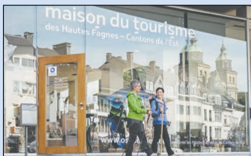
Gut ausgerüstet geht's auf Tour.

gewonnen. Die Lebenshilfe journal-Redaktion gratuliert dem Gewinner sehr herzlich. Der Gutschein wird per Post zugestellt. Zu diesem Zweck werden die Adressdaten einmalig dem Hotel/der Region zum Versand übermittelt.