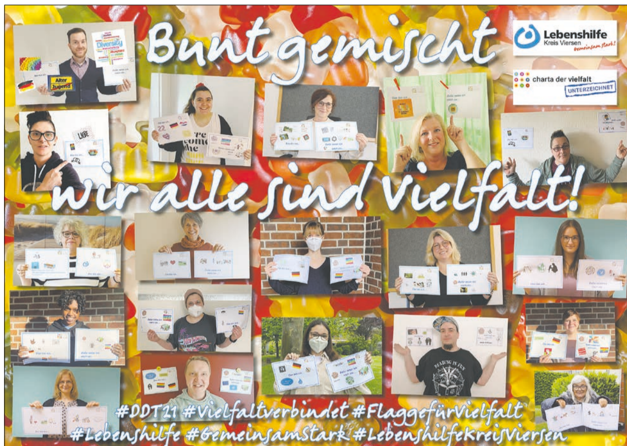
Vielfalt sichtbar machen – die Mitarbeitenden sowie Klientinnen und Klienten zeigten am Diversity Tag, wer sie sind und wofür sie sich einsetzen.

Zum 9. Deutschen Diversity Tag hat sich die Lebenshilfe Kreis Viersen e.V. öffentlich mit einer Facebook-Aktion zur Vielfalt im Arbeitsalltag bekannt. Unter dem Motto „Bunt gemischt – wir alle sind Vielfalt!“ haben Mitarbeitende sowie Klientinnen und Klienten