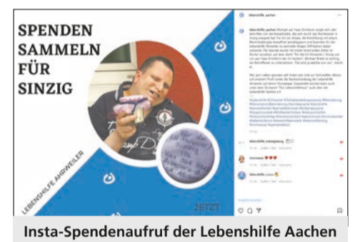
Insta-Spendenaufwurf der Lebenshilfe Aachen