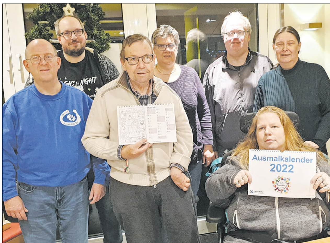
Der Lebenshilfe-Rat ruft dazu auf: „Bitte beteiligen Sie sich an der Aktion und unterstützen Sie die Süchtelner Einzelhändler bei ihrem Engagement.“

Der Lebenshilfe-Rat hilft gerne: „Als wir von der Hochwasserkatastrophe in Ahrweiler und dem Unglück in der Wohnstätte Sinzig hörten, wollten auch wir gerne helfen. Aber wie? Es kam uns eine besondere Idee. Wir haben einen Ausmalkalender gestaltet, den wir mit Unterstützung des Werberinges Viersen in den Geschäften und unseren Einrichtungen verkaufen. Dabei helfen uns die Ladenbesitzer. Viele Kalender sind schon verkauft. Da kommt bestimmt gut etwas zusammen. Wir wünschen Euch, dass es Euch bald wieder gut geht.“ Die