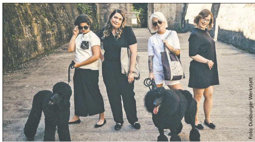
Charismatisch und lebensfroh – die Models von „esthétique“

Das T-Shirt ist der Renner und im Online-Shop erhältlich. Genau so wie die neue Kollektion, die am 6. Dezember auf den Markt gekom-