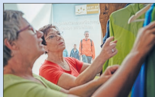
Wanderausrüstung anprobieren und leihen

gelungene Wanderung ausmacht – vom Rucksack über hochwertige Wanderschuhe bis hin zu Ferngläsern, Trekkingstöcken und sogar einem Outdoor-Minirock können Gäste hier Ausrüstung kostenlos ausleihen. Infos unter www.best-of-wandern.de