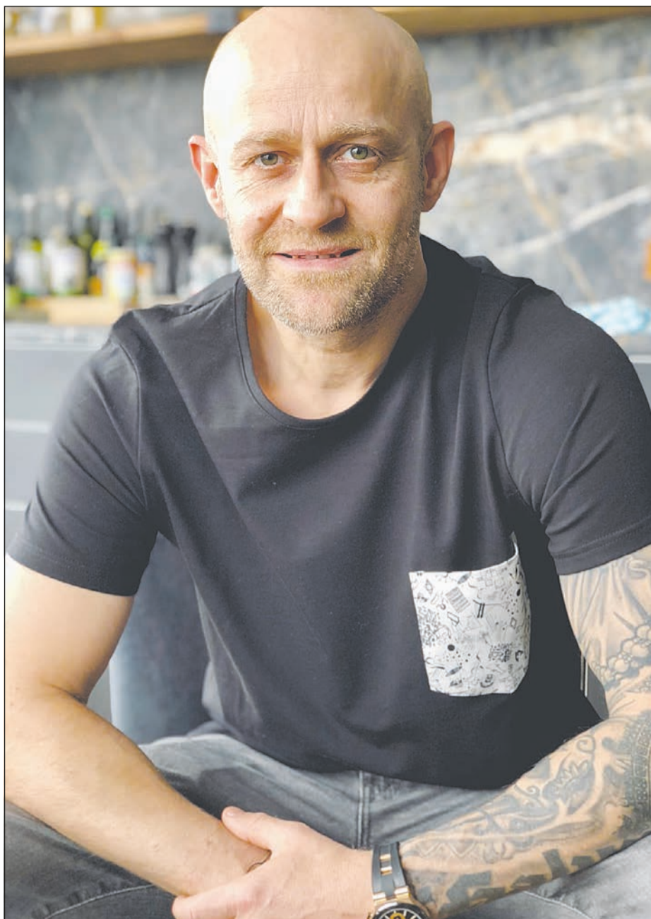
Von der inklusiven Modemarke „esthétique“ ist auch der bekannte Schauspieler Jürgen Vogel begeistert.