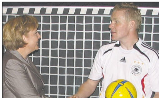
Mit Bundeskanzlerin a. D. Dr. Angela Merkel