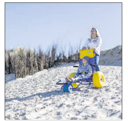
Tolles Stranderlebnis Langeoog

Wieder im Programm ist Nordsee vom 1. bis 8. Mai und vom 18. bis 25. September. Etabliert hat sich das neue Haus „De Hooiberg“ in den Niederlanden, „das wir in