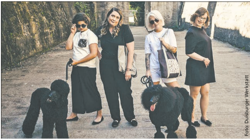
Charismatisch und lebensfroh – die Models von „esthétique“

Das T-Shirt ist der Renner und im Online-Shop erhältlich. Genau so wie die neue Kollektion, die am 6. Dezember auf den Markt gekom-