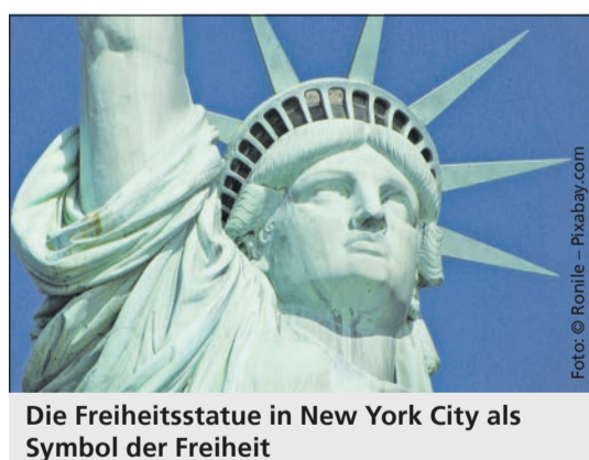
Die Freiheitsstatue in New York City als Symbol der Freiheit