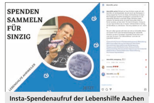
Insta-Spendenaufruf der Lebenshilfe Aachen