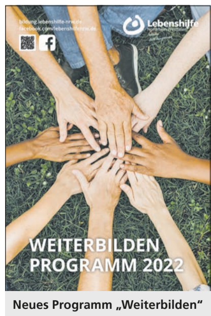
Neues Programm „Weiterbilden“