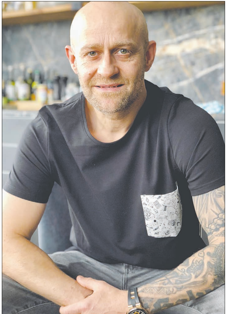
Von der inklusiven Modemarke „esthétique“ ist auch der bekannte Schauspieler Jürgen Vogel begeistert.