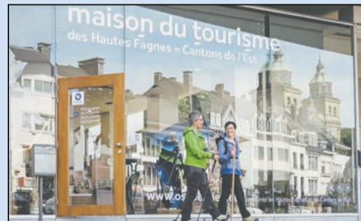
Gut ausgerüstet geht's auf Tour.

gewonnen. Die Lebenshilfe Journal-Redaktion gratuliert dem Gewinner sehr herzlich. Der Gutschein wird per Post zugestellt. Zu diesem Zweck werden die Adressdaten einmalig dem Hotel/der Region zum Versand übermittelt.