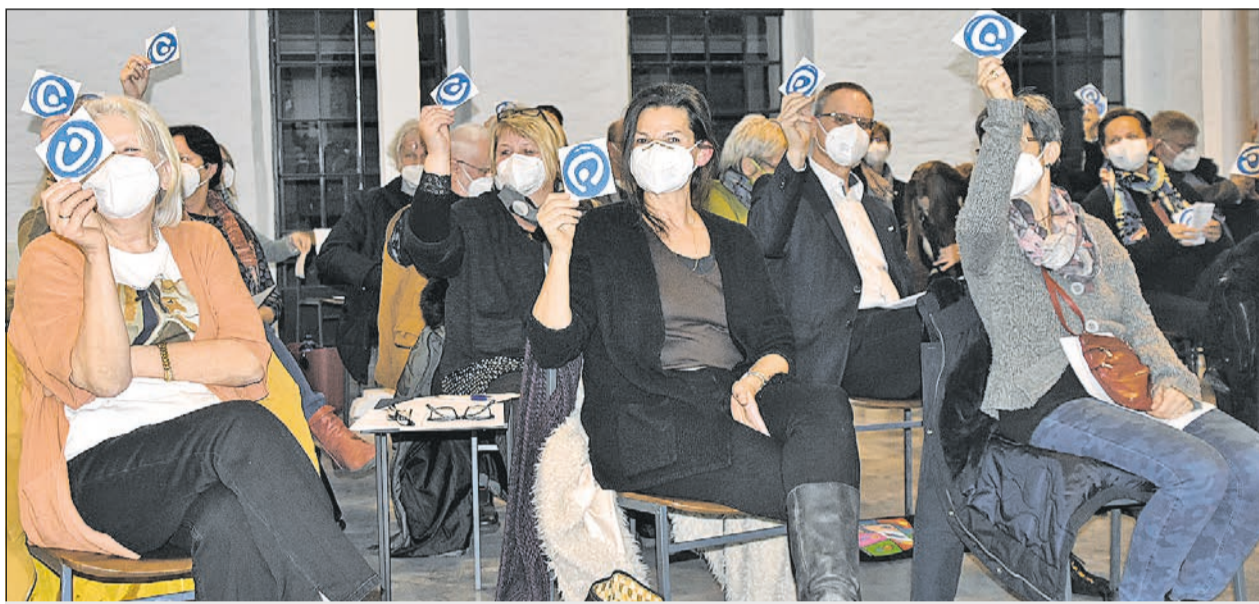
Mitglieder bei der Abstimmung entsprechend der Tagesordnung