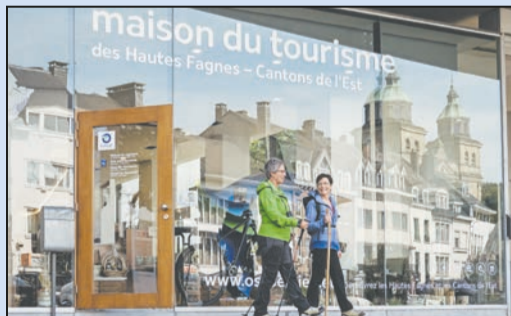
Gut ausgerüstet geht's auf Tour.

gewonnen. Die Lebenshilfe journal-Redaktion gratuliert dem Gewinner sehr herzlich. Der Gutschein wird per Post zugestellt. Zu diesem Zweck werden die Adressdaten einmalig dem Hotel/der Region zum Versand übermittelt.