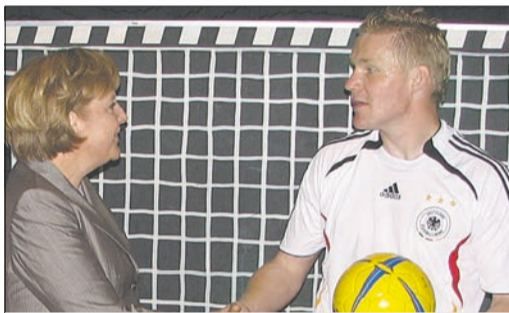
Mit Bundeskanzlerin a. D. Dr. Angela Merkel