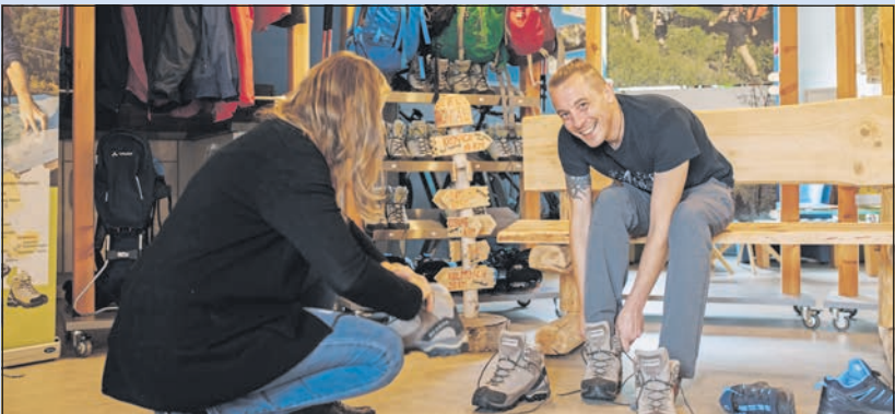
Best of Wandern-Testcenter im Frankenwald

Gewinnen Sie zwei Übernachtungen in der Luxuslodge „Sepp“ oder „Traudl“ in der Best of Wandern-Region Frankenwald inklusive WLAN, Sat-TV, Nebenkosten und Endreinigung im Wert von 180 Euro.