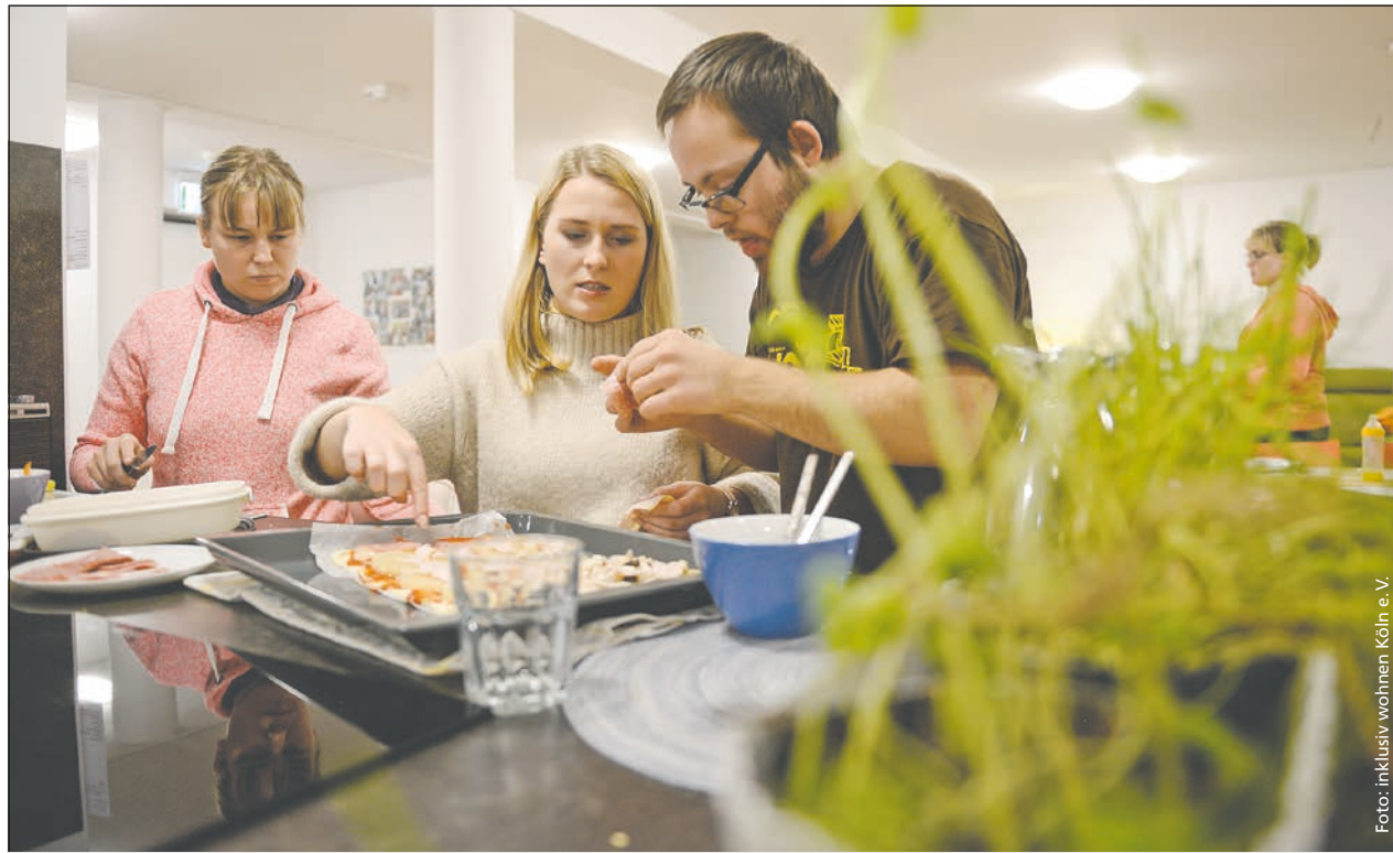
Gemeinsam gut zusammenleben: Studierende und Menschen mit Behinderung im neuen Wohnprojekt

Professionell, kreativ und innovativ – neues inklusives Wohnprojekt mit Vorbildcharakter