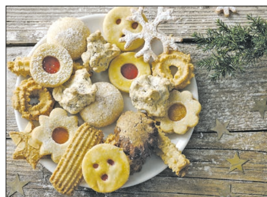
Selbstgebackenes in der Adventszeit

Weihnachtsfest verbringen soll!“ Im Wohnhaus bemühen sich Betreuerinnen und Betreuer sowie Hauswirtschafterinnen darum, es besonders feierlich und auch genussreich zu gestalten. Auch hier wieder nach einigen Tränen die gleichmütige Annahme der Tatsache, dass wegen eines gerade ausgebrochenen Krankheitsfalles niemand zu seiner Familie gehen kann ... Der Betroffene erlebt zum Glück einen milderen Verlauf, er hat Kopf- und Gliederschmerzen, und neben Fieber auch einen auffälligen Husten. Er wird gemeinsam mit den drei Mitbewohnern seines Flurs unter Quarantäne gestellt, Betreuerinnen und Betreuer, die dort ih-