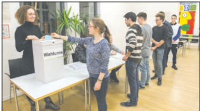
Viel Andrang bei der Juniorwahl