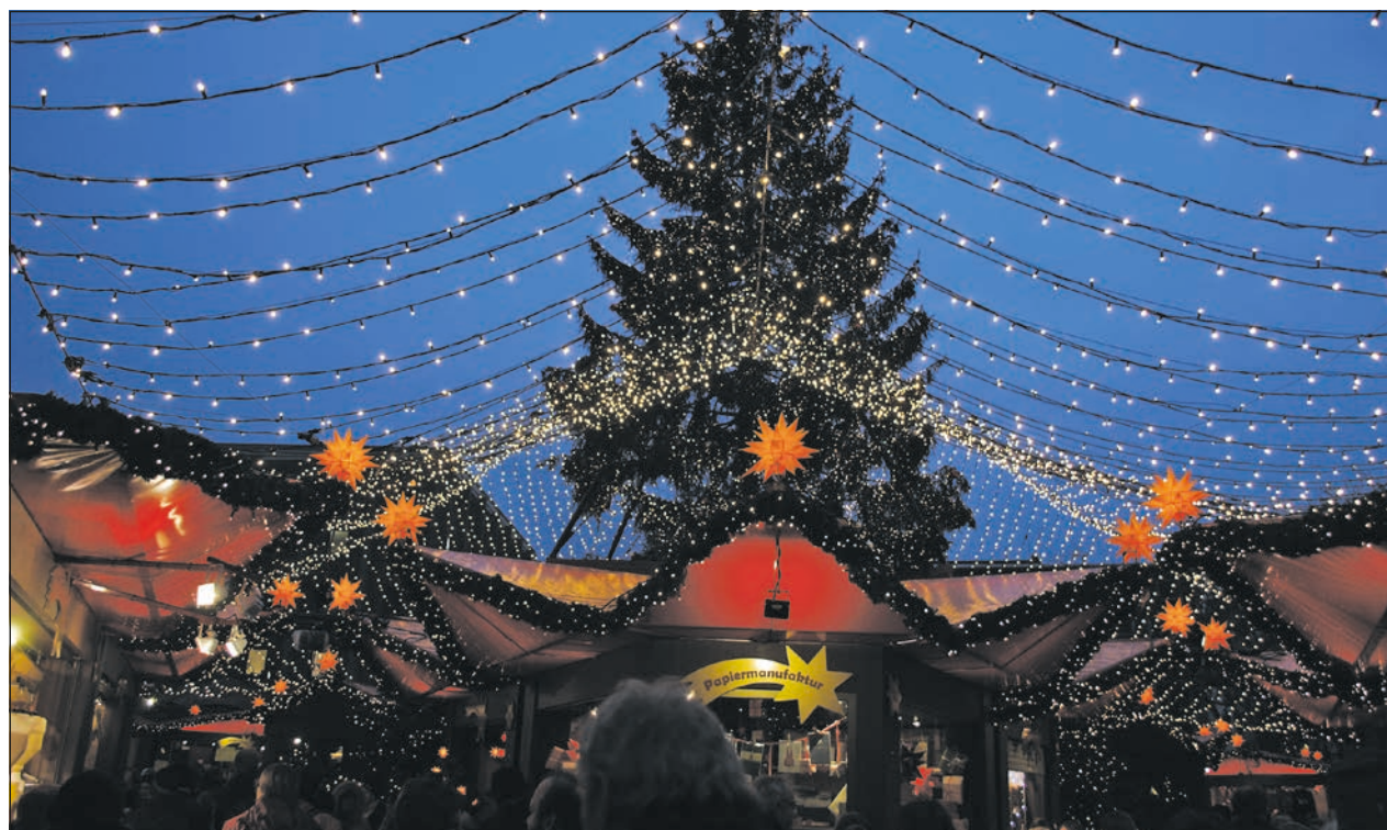
Festliche Adventsstimmung auf dem Weihnachtsmarkt

Zwischendurch wird es immer mal wieder spannend, denn es melden sich Familienmitglieder unserer Bewohnerinnen und Bewohner sehr zerknirscht und besorgt, sie seien kurz nach einem Besuch bei uns