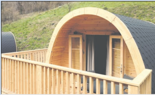
Die neuen Luxus-Lodges ...

Idyllisch in einem der grünen Täler des Frankenwaldes gelegen, warten „Sepp“ und „Traudl“ auf