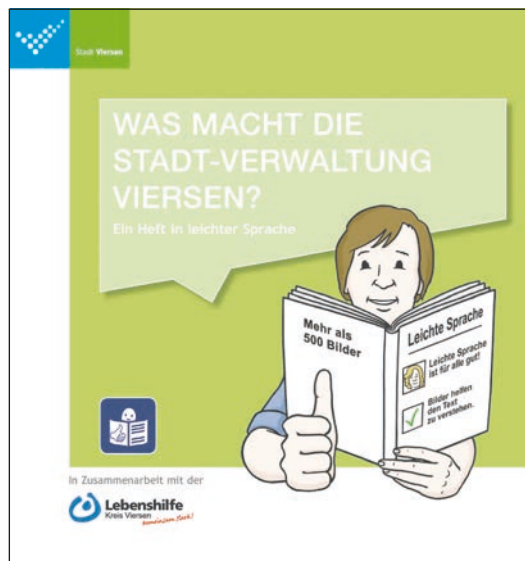
Die neue Broschüre „Was macht die Stadt-Verwaltung Viersen?“

Menschen mit Lernschwierigkeiten, Menschen mit kognitiven Beeinträchtigungen, Menschen, die nicht gut lesen können oder für die Deutsch eine Fremdsprache ist, sollen mit dieser Broschüre Unterstützung bekommen. Zum anderen wurde gemeinsam