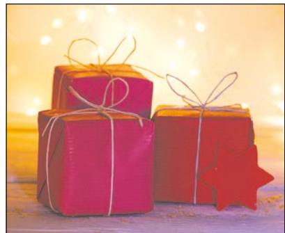
Fest der Geschenke

Es kommen Mitarbeitende der Werkstätte zu uns in das Haus und bringen Arbeit und Beschäftigungsangebote für ihre Schützlinge mit. Dies wird sehr freudig aufgenommen, stolz werden mal die Zimmer gezeigt, oder die neueste CD. Der Tag vergeht durch die Arbeit, die auch bei uns im „Homeoffice“ gemacht werden kann, wieder viel zufriedenstellender. Wir Betreue-