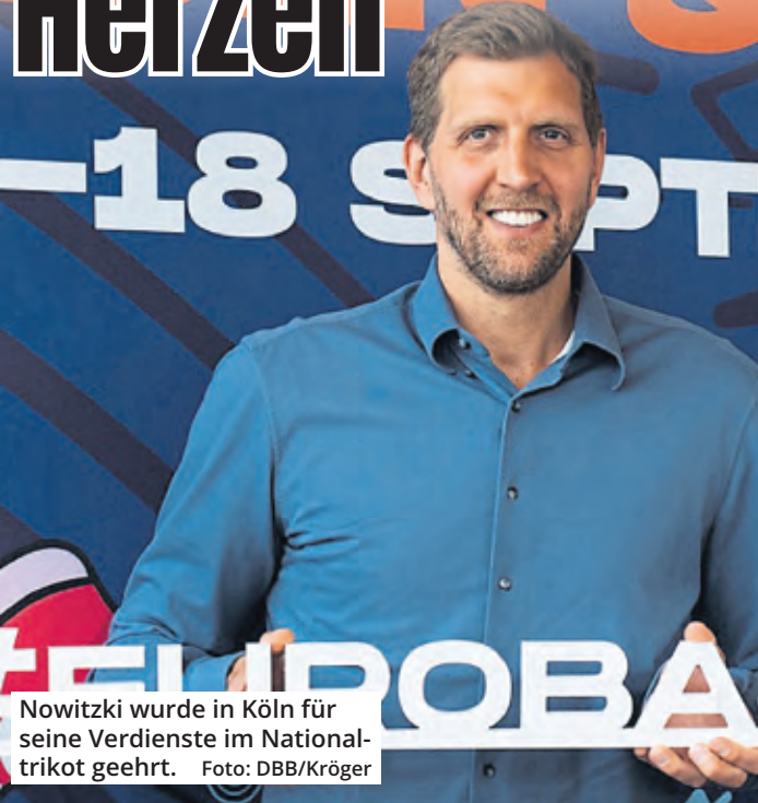
Nowitzki wurde in Köln für seine Verdienste im Nationaltrikot geehrt.