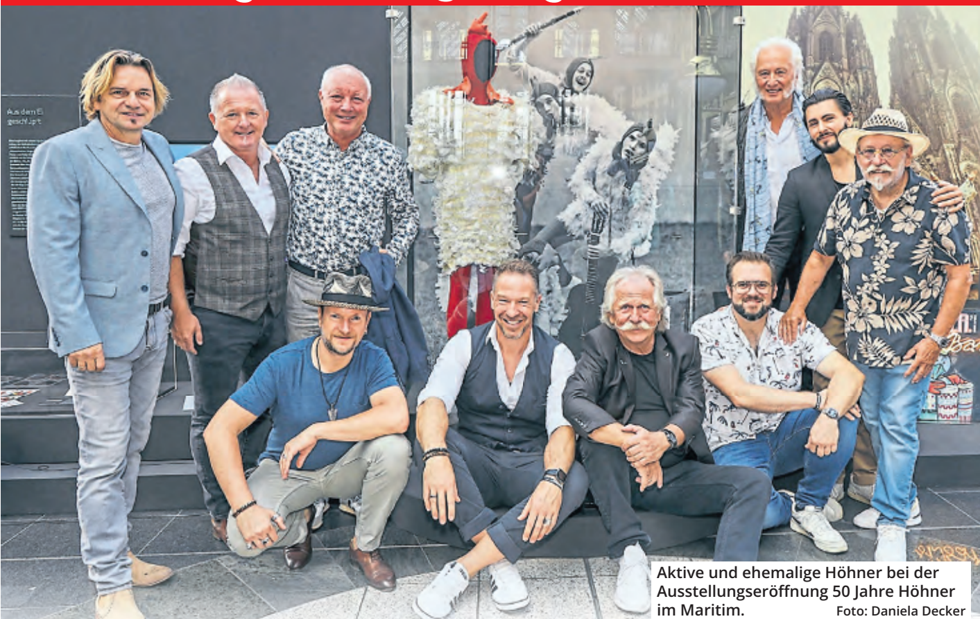
Aktive und ehemalige Höchner bei der Ausstellungseröffnung 50 Jahre Höchner im Maritim.