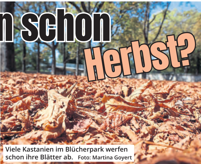
Viele Kastanien im Blücherpark werfen schon ihre Blätter ab.

„Aber sie sind weniger vital, das beobachten wir verstärkt“, erklärt Stricker. Und was diese verminderte Vitalität bedeute, zeige sich erst im kommenden Frühjahr: Die Bäume wachsen weniger, das Geäst treibt weniger aus. Weniger Vitalität bedeute auch weniger Widerstandskraft. „Die Bäume werden anfälliger für Schäd-