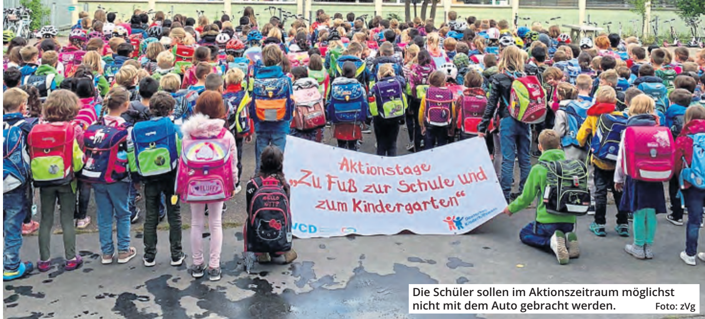
Die Schüler sollen im Aktionszeitraum möglichst nicht mit dem Auto gebracht werden.

Verkehrschao vor der Schule? Viele Eltern kennen dieses Szenario nur zu gut. Deswegen wird ab dem 5. September in Zündorf nun eine Aktion der besonderen Art durchgeführt.