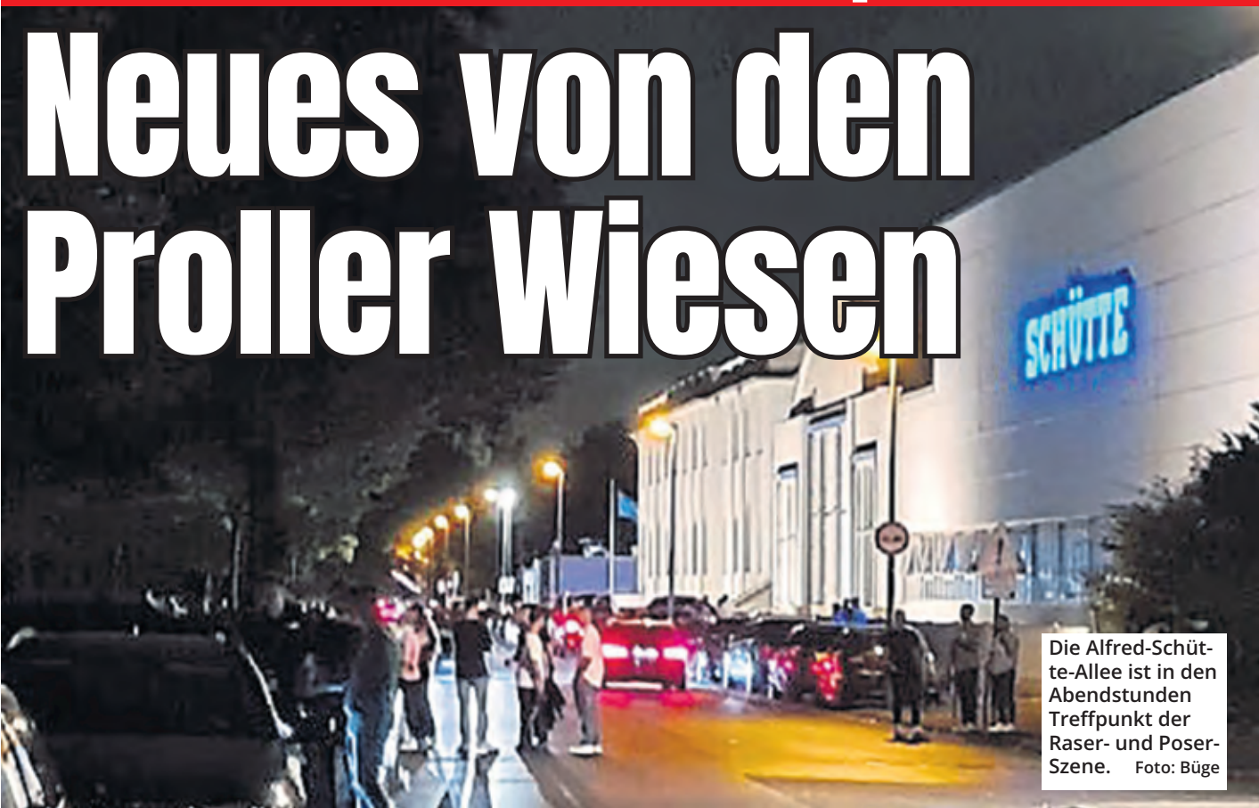
Die Alfred-Schütte-Allee ist in den Abendstunden Treffpunkt der Raser- und Poser-Szene.

Nur anderthalb Wochen nach ihrem Start zeigt die Online-Petition gegen die Raser- und Poser-Szene an den Poller Wiesen ihre Wirkung. Die Kontrollen werden strikter, feste Blitzer wohl zeitnah platziert. Doch das reicht den Anwohnern nicht, auch weil für eine durchgängige Tempo-30-Zone die rechtliche Grundlage fehlt.