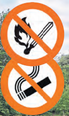
Nur ein Funke könnte einen verheerenden Brand in der Heide auslösen.