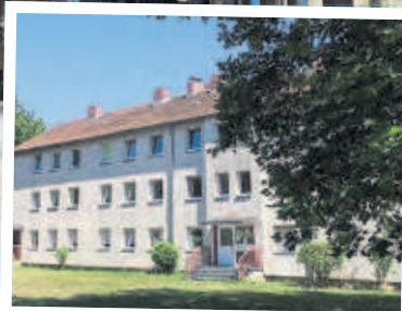
Die Häuser an der Geisbergstraße stehen derzeit weitgehend leer.

In Köln leben immer mehr Menschen auf der Straße.