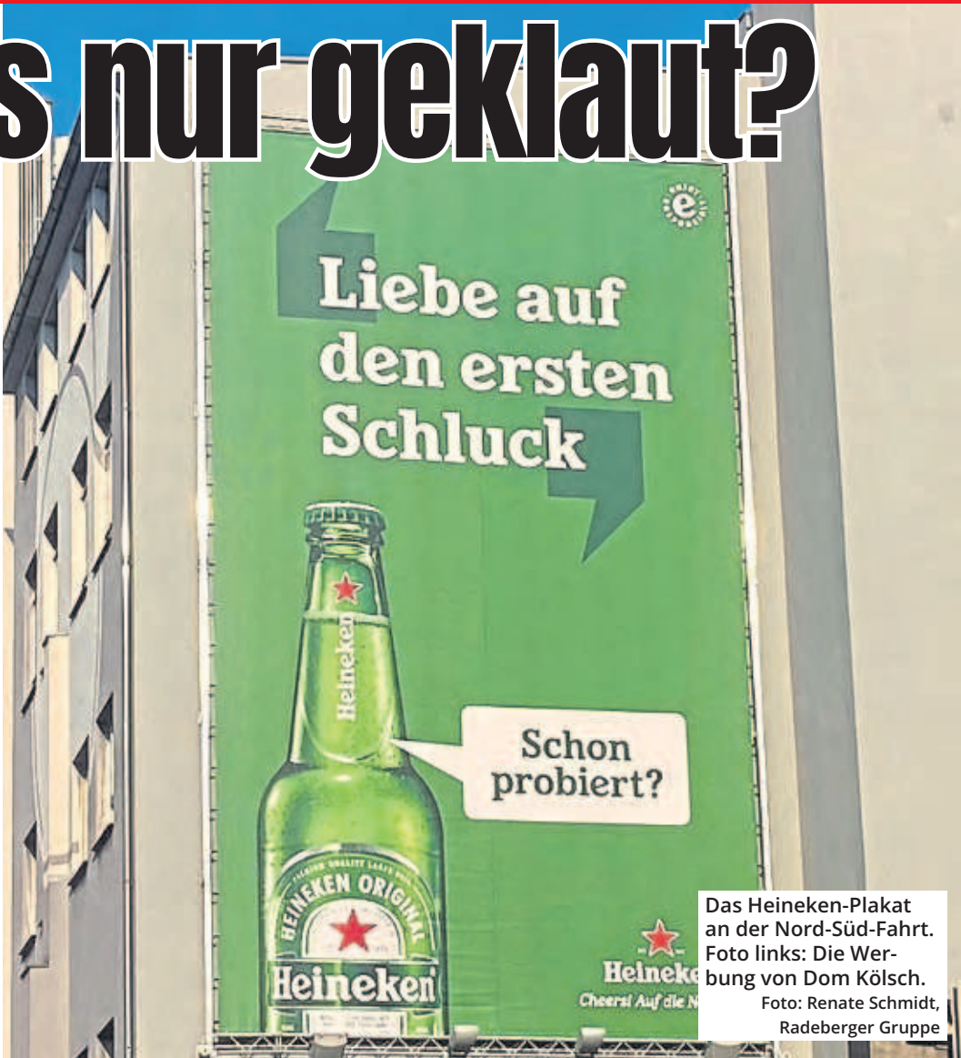
Das Heineken-Plakat an der Nord-Süd-Fahrt. Foto links: Die Werbung von Dom Kölsch.