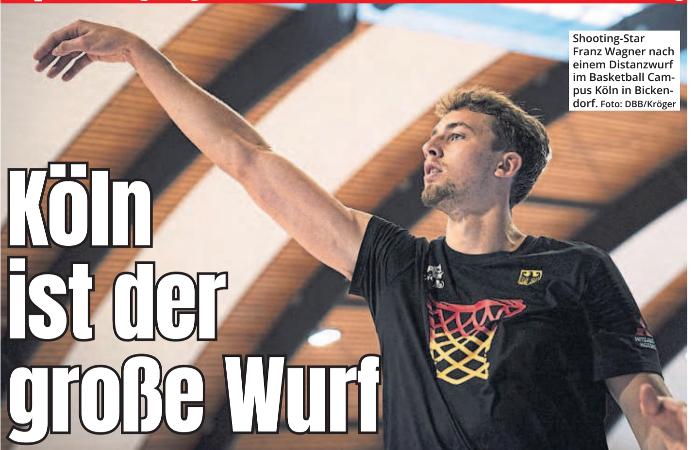
Shooting-Star Franz Wagner nach einem Distanzwurf im Basketball Campus Köln in Bickendorf.