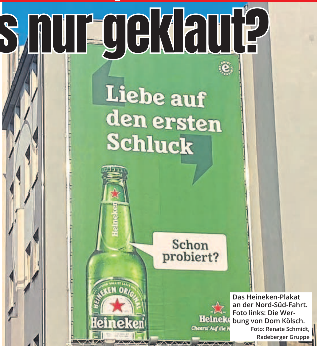
Das Heineken-Plakat an der Nord-Süd-Fahrt. Foto links: Die Werbung von Dom Kölsch.