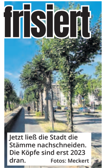
Jetzt ließ die Stadt die Stämme nachschneiden. Die Köpfe sind erst 2023 dran.

Stadt mitteilt, sollen die Kronen „nicht vor Herbst 2023“ zurückgeschnitten werden, da der letzte „Kopfschnitt“ erst im November war und die Vogelschutzzeit berücksichtigt werde. Vorteil: Am Rheinufer bleibt es für Radler und Spaziergänger erst mal für zwei Sommer schön schattig. Angesichts der drohenden XXL-Baumkronen sollten die Gärtner dann aber keine Wucherpreise verlangen.