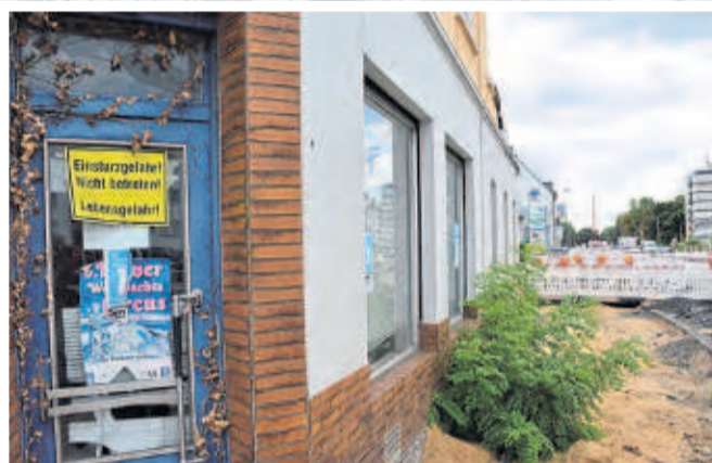
Dieses Haus sollte man nicht betreten, warnt ein Schild an der Tür: „Einsturzgefahr. Nicht betreten. Lebensgefahr“.

Der Baustellenbummel endet auf der Kreuzung Bonner Straße/Schönhauser Straße. Bordsteine für die zukünftige Kreuzung sind bereits gesetzt und verschaffen eine erste Anmu-