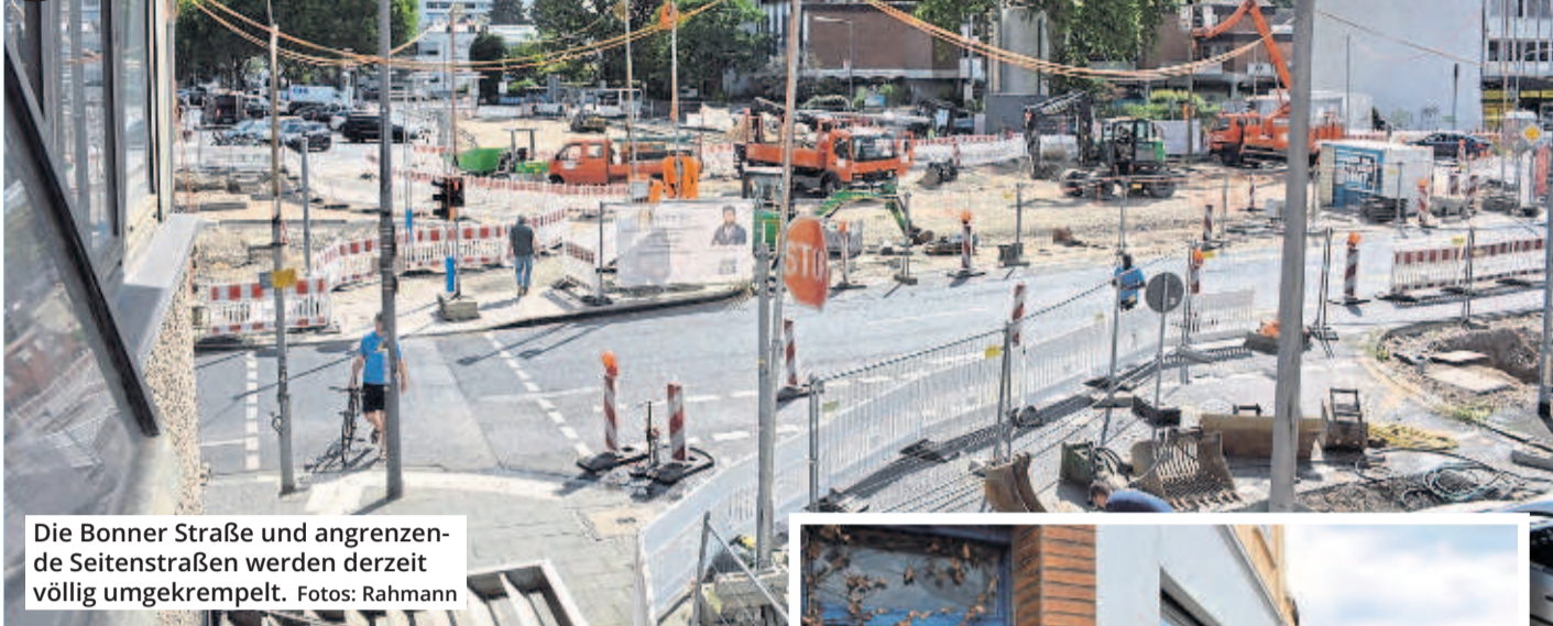
Die Bonner Straße und angrenzende Seitenstraßen werden derzeit völlig umgekrempelt.

Willkommen auf Kölns größter Chaos-Baustelle. Überall sind Gräben ausgehoben, Absperrbaken stehen herum, die Bonner Straße und die ehemaligen Bürgersteige sind Schotterpisten. Und kaum hat man richtig angefangen, ist man schon im Verzug. Die Stadt kündigte bereits an: „Die Vollsperrung der Bonner Straße stadteinwärts ab der Schönhauser Straße wird bis zum 26. August verlängert.“