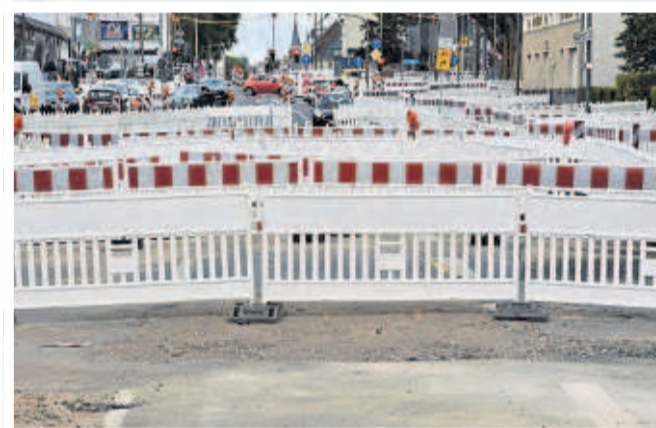
Überall stehen die Absperrbaken. Man erkennt das Veedel kaum noch wieder.

teilung von der Größe des Projekts. Die Hälfte des Rewe-Parkplatzes wurde vom Asphalt befreit.