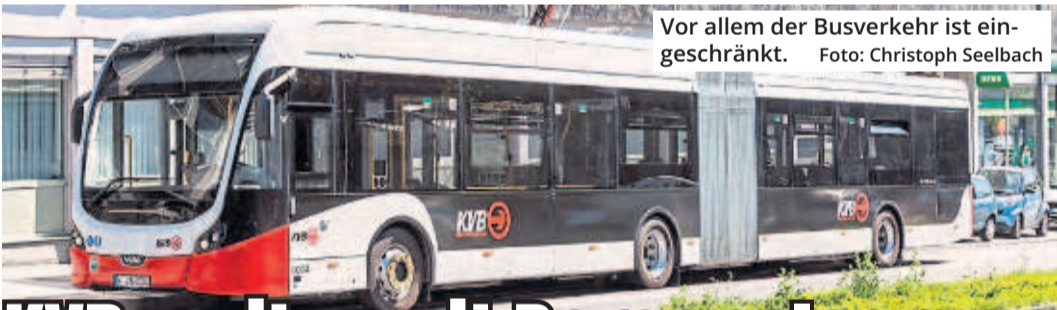
Vor allem der Busverkehr ist eingeschränkt.

Das ein oder andere Kölsch gibt es für die Spieler der deutschen Basketball-Nationalmannschaft dann aber wohl erst nach einer erfolgreich überstandenen Vorrunde. Für den aus Kanada stammenden Bundestrainer Gordon Herbert (63) wäre das übrigens eine Premiere, da er von dem in Köln gebrauten Bier bisher noch nie etwas gehört hatte. Herbert: „Nun freue ich mich aber nun, es schon bald probieren zu können.“