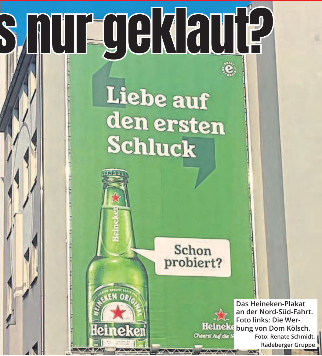
Das Heineken-Plakat an der Nord-Süd-Fahrt. Foto links: Die Werbung von Dom Kölsch.

Das hat Georg Schäfer natürlich sofort bemerkt. Er ist Geschäftsführer des „Hauses Kölscher Brautradition“, das zur Radeberger Gruppe gehört, die Dom Kölsch im Portfolio hat. „Natürlich haben wir uns sehr gewundert, dass eine große internationale Biermarke sich an unserer regionalen Marke Dom Kölsch kreativ bedient hat“, sagt er. Aber er bleibt gelas-