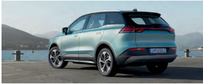
Knapp 4,70 Meter misst der geräumige SUV