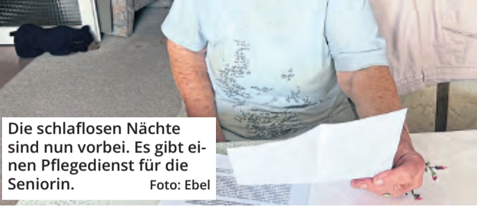
Die schlaflosen Nächte sind nun vorbei. Es gibt einen Pflegedienst für die Seniorin.