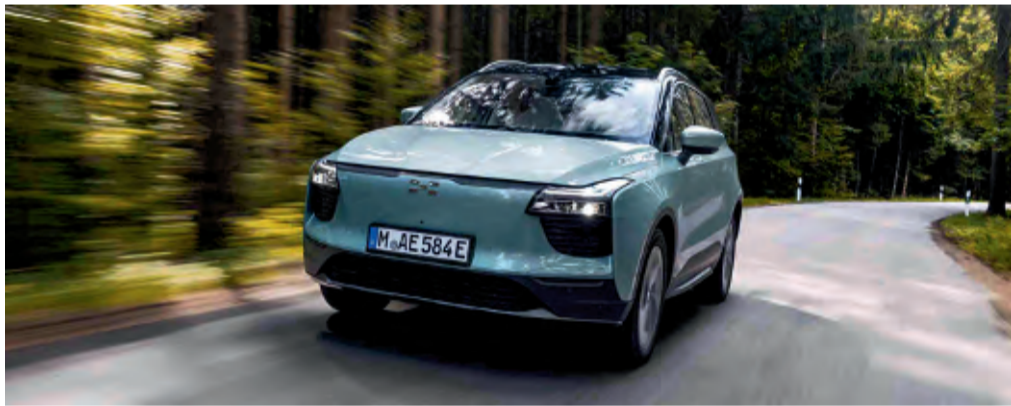
Der Aways U5 kann mit einer Batterie-Ladung rund 400 Kilometer zurücklegen