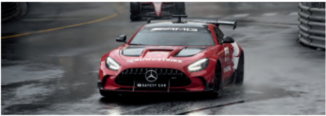
Das Safety Car muss spezielle Anforderungen erfüllen

terschaft. Erstmals kommt als Official F1 Safety Car der Mercedes AMG GT Black Series zum Einsatz und der Mercedes AMG GT 63 S 4MATIC+ feiert sein Debüt als Official F1 Medical Car – noch