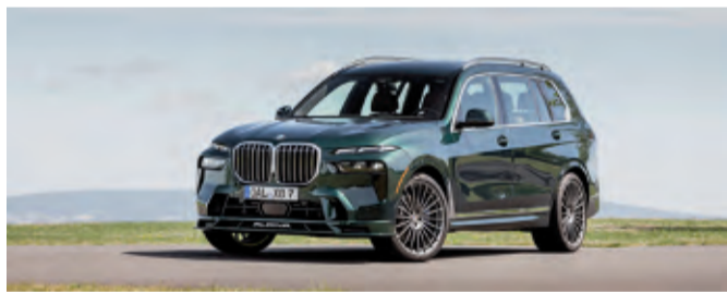
Der XB7 ist nicht nur groß, sondern auch kraftvoll

Köln – Der BMW ALPINA XB7, das erste Oberklasse SAV der Automobilmanufaktur ALPINA, wurde 2020 auf den Markt gebracht und hat jetzt eine umfangreiche Modellaufwertung bekommen. Der XB7 ist mit der neuesten V8-Motorgeneration mit BMW Mild-Hybrid-Technologie ausgerüstet. Die ALPINA Ingenieure haben den leistungsstarken Achtzylinder-Basismotor mit hauseigener Entwicklungsarbeit an die ALPINA Motorenphilosophie angepasst. Charakteristisch ist ein früh abrufbares und hohes Drehmoment: 800 Nm stehen bereits ab 2.000 U/min zur Verfügung – die hohen Kraftreserven des Antriebs sind für den Fahrer(-in) jederzeit spür- und abrufbar, was das ALPINA Fahrgefühl im Kern auszeichnet. Aus 4,4 Litern Hubraum schöpft der V8 Motor mit Bi-Turbo Aufladung