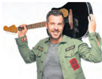
Torben Klein Seit 2019 solo unterwegs. Mit seinen Hits wie „Für die Ewigkeit“, „Dat es Heimat“, „Wenn ich träum in der Nacht“ ist er einer der gefragtesten Sänger im Rheinland.

Im Anschluss werden Frau Altröck für die Fragen der zukünftigen Schüler*innen und Frau Blömer-Frerker für Bürgeranliegen in der Straußwirtschaft mit Wein- und Flammkuchenstand der Fa. Niederstein zu Gast sein. Im Laufe des Tages werden Torben Klein (13:30), Helmut A.