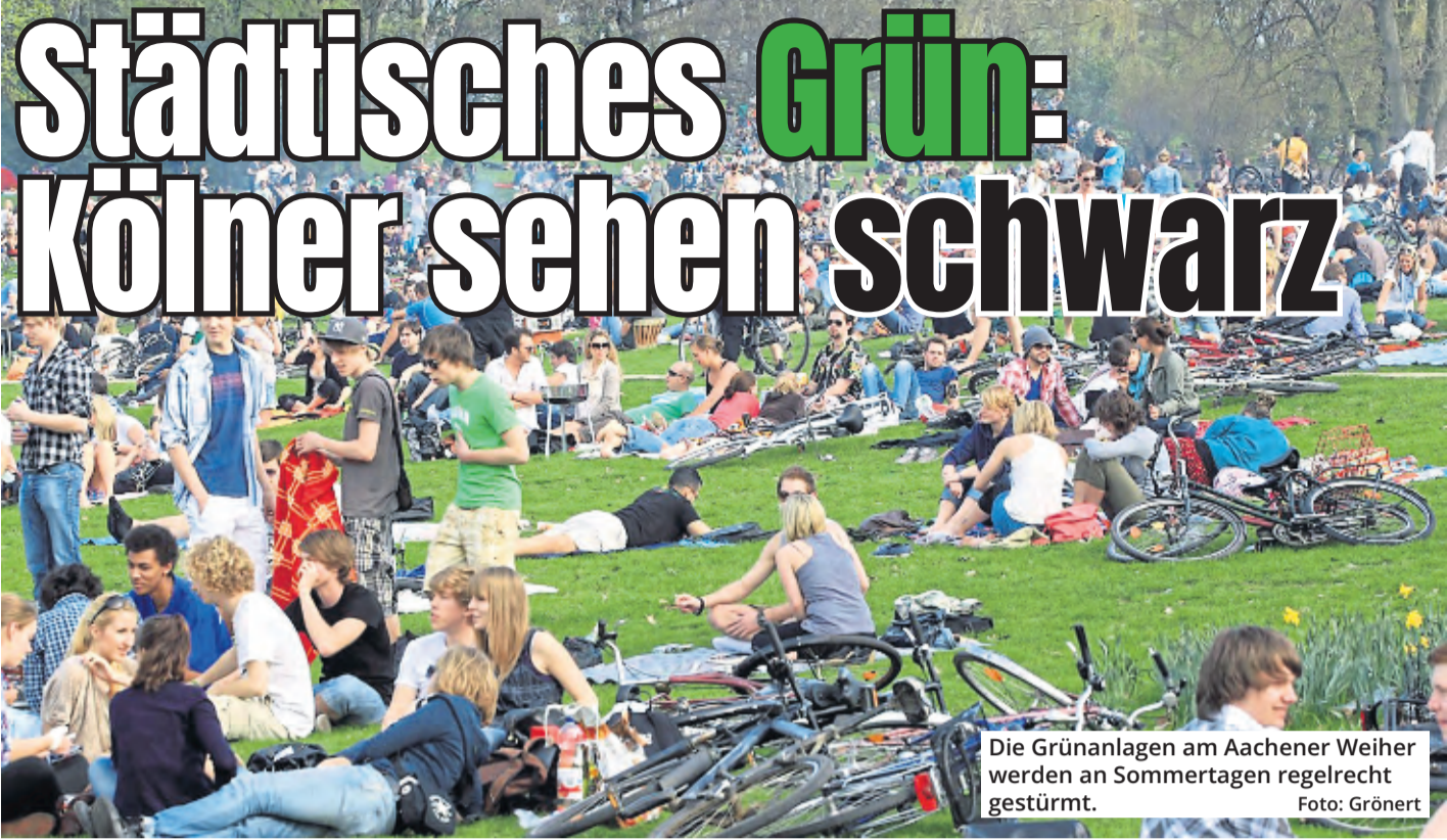
Die Grünanlagen am Aachener Weiher werden an Sommertagen regelrecht gestürmt.

Parks und Grünanlagen in der Stadt sind wichtig – fürs Klima und für das Wohlbefinden der Menschen. Gerade in Köln sorgen die Anzahl, der Pflegezustand und die Gestaltung des städtischen Grüns für weniger Begeisterung als in anderen deutschen Metropolen. Das zeigt eine Forsa-Umfrage der Initiative „Grün in die Stadt“.