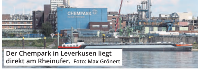
Der Chempark in Leverkusen liegt direkt am Rheinufer.

Ein Teil des bei der Explosion eines Abfalltanks im vergangenen Jahr in Abwassertanks zurückgehaltenen Lösch- und „Ereigniswassers“ sei bereits nach einer Vorbehandlung in einer speziellen Reinigungsanlage über die Kläranlage entsorgt worden. Zurzeit stünden drei Abwässer zur Einleitung über die Kläranlage in den Rhein an: Es handle sich dabei um 30 Kubikmeter eines mit Toluol belasteten Abwassers aus einem Schadensfall, 2400 Kubikmeter eines mit Kohlenstoffverbindungen belasteten Abwassers und 3300 Kubikmeter Abwasser aus einem Niederschlags- und Kühl-