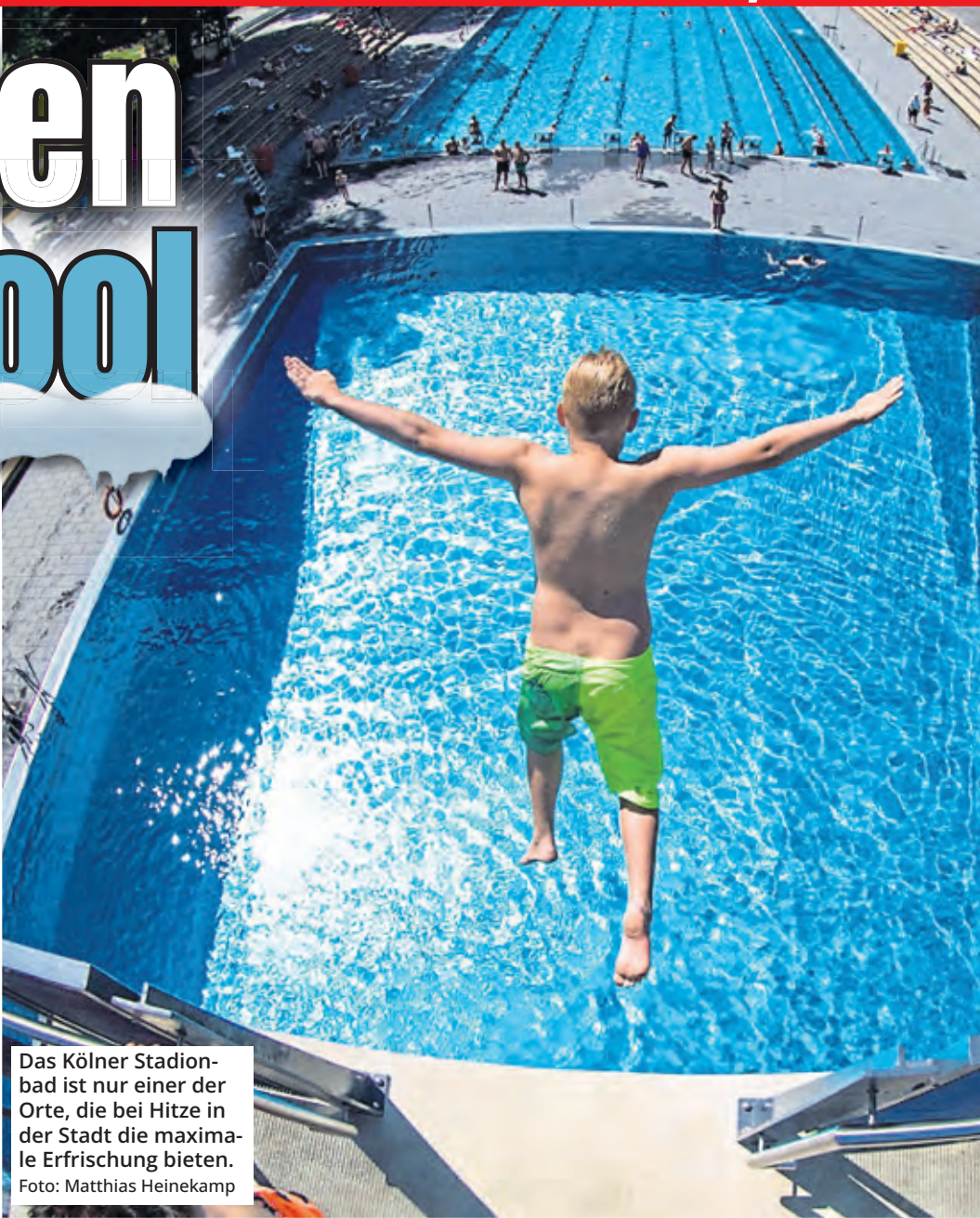
Das Kölner Stadionbad ist nur einer der Orte, die bei Hitze in der Stadt die maximale Erfrischung bieten.

Die Kölner Zentralbibliothek am Josef-Haubrich-Hof bietet auf sechs Etagen spannende Themenwelten mit über 850.000 Medien. Und nicht nur das: Dank klimatisierter Innenräume ist ein kühler Kopf garantiert. Normalerweise herrschen dort 21 bis 22 °C vor, bei hohen Außentemperaturen kann