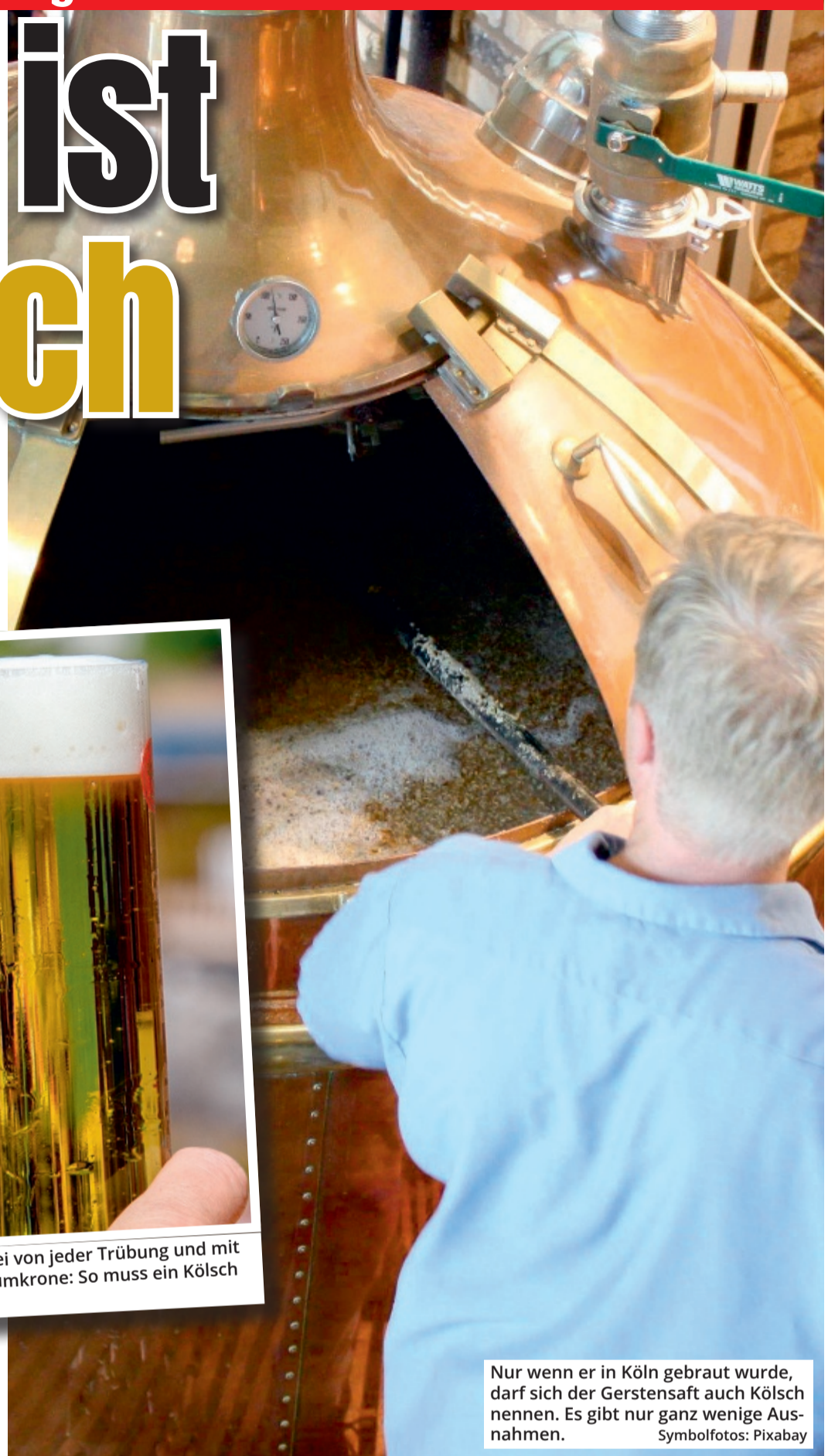
Nur wenn er in Köln gebraut wurde, darf sich der Gerstensaft auch Kölsch nennen. Es gibt nur ganz wenige Ausnahmen.