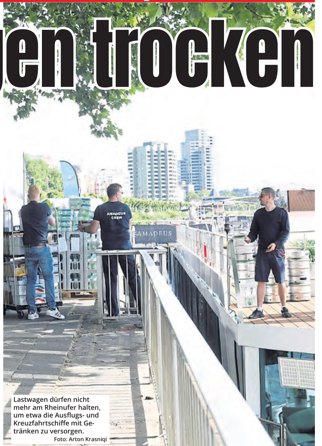
Lastwagen dürfen nicht mehr am Rheinufer halten, um etwa die Ausflugs- und Kreuzfahrtschiffe mit Getränken zu versorgen.

Die IG Gastro kritisiert die Regelung: „In diesen Zeiten ist das grob geschäftsschädigend für die Lieferanten und für die Rheinschifffahrt in Köln.“ Die IG fordert, dass die Lkw in bestimmten Zeitfenstern bis an das Ufer fahren dürfen, ohne bestraft zu werden. „Es darf nicht sein, dass Unternehmen, die für Köln und den Rhein stehen wie kaum jemand anders, so dermaßen ausgebremst werden.“