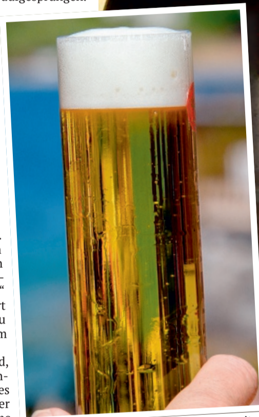
Goldgelb, frei von jeder Trübung und mit feiner Schaumkrone: So muss ein Kölsch aussehen.

Das sah das Landesamt in NRW schlussendlich ähnlich und sprach Ende Mai ein Verbot aus. Das Kölsch-Imitat darf in NRW nicht verkauft werden.