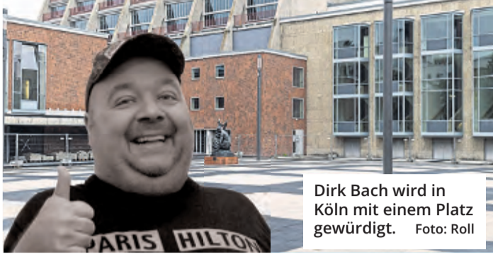
Dirk Bach wird in Köln mit einem Platz gewürdigt.

Köln. Der Platz vor dem Schauspielhaus an der Brüderstraße soll nach dem Kölner Schauspieler Dirk Bach benannt werden. Das hat die Bezirksvertretung Innenstadt in der vergangenen Woche mehrheitlich beschlossen. Dagegen stimmten die Vertreter von SPD und CDU. Sie favorisierten die gleichfalls von der Verwaltung vorgeschlagene Option, im Fall einer Neugestaltung der Kreuzung Zülpicher, Dassel- und Kyffhäuser Straße dem dadurch entstehenden Platz den Namen Dirk Bachs zu geben, der 1961 in Köln geboren wurde und 2012 starb.