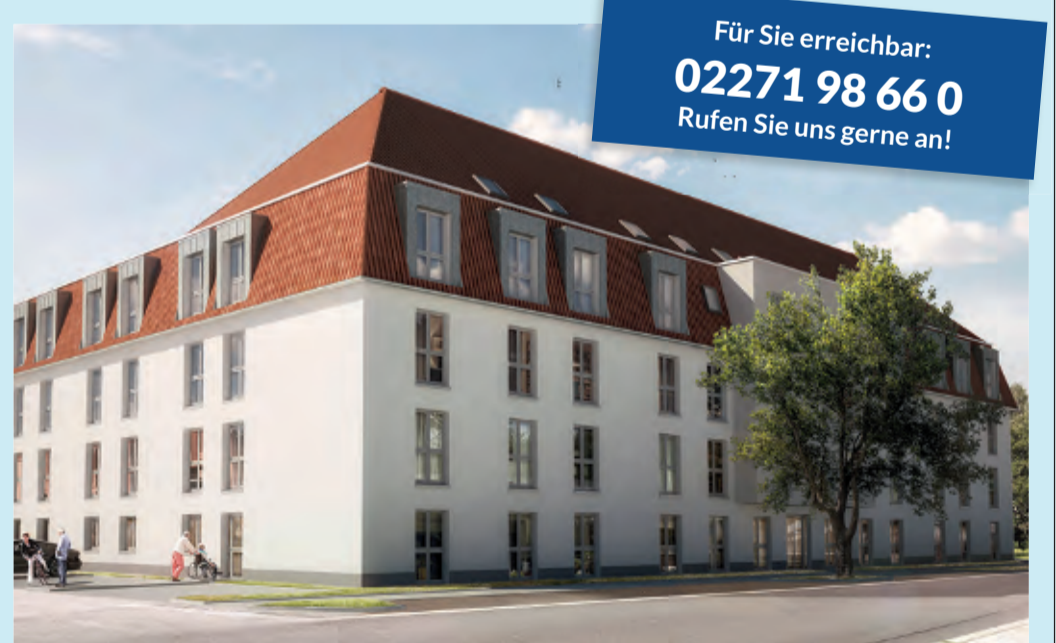
Wertstabilität und attraktive Kapitalanlage für private Anleger.

Kein Vermietungsstress und garantierte Miete Der Käufer profitiert vom 20-jährigen Mietvertrag mit einer garantierten Miete auch bei Leerstand oder Bewohnerwechsel sowie von vielen weiteren Vorteilen dieser Sorglos-Immobilie .