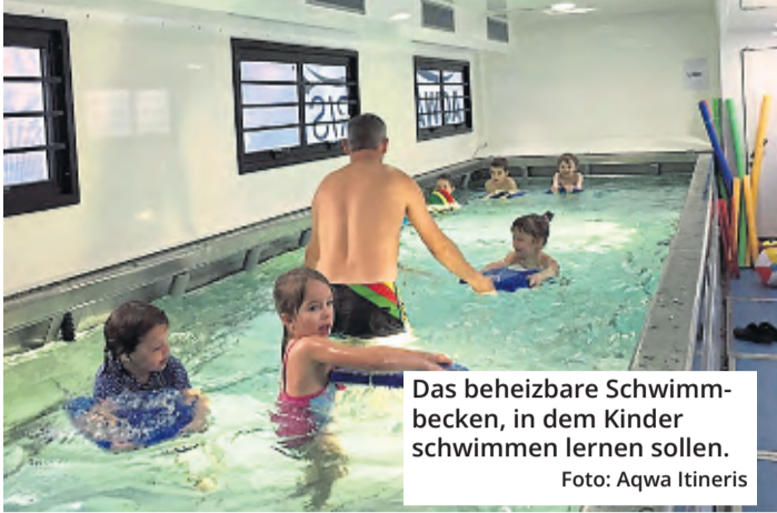
Das beheizbare Schwimmbecken, in dem Kinder schwimmen lernen sollen.