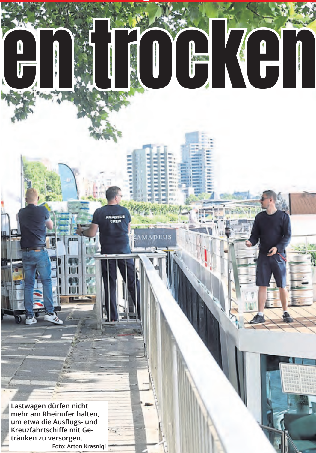
Lastwagen dürfen nicht mehr am Rheinufer halten, um etwa die Ausflugs- und Kreuzfahrtschiffe mit Getränken zu versorgen.

Die IG Gastro kritisiert die Regelung: „In diesen Zeiten ist das grob geschäftsschädigend für die Lieferanten und für die Rheinschifffahrt in Köln.“ Die IG fordert, dass die Lkw in bestimmten Zeitfenstern bis an das Ufer fahren dürfen, ohne bestraft zu werden. „Es darf nicht sein, dass Unternehmen, die für Köln und den Rhein stehen wie kaum jemand anders, so dermaßen ausgebremst werden.“