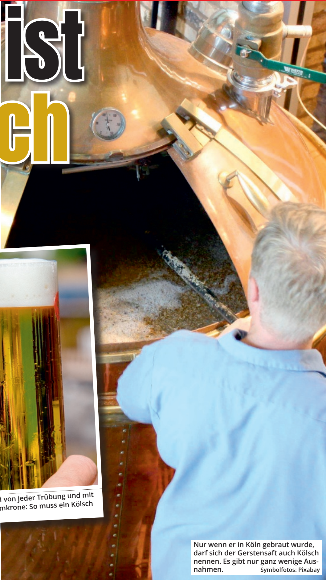
Nur wenn er in Köln gebraut wurde, darf sich der Gerstensaft auch Kölsch nennen. Es gibt nur ganz wenige Ausnahmen.