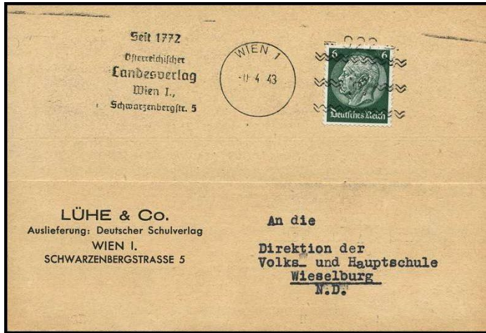
Brief aus der ehemaligen „Ostmark“ von Wien nach Wieselburg in Niederösterreich

Nur drei Maschinen haben den „Krieg“ überlebt (Nr. 344, 551 und 660), wo- von eine (Nr. 344) bis 1956 in Hannover noch benutzt wurde. Die Maschine mit der Nr. 660 erhielt sogar noch einen Zweikreisstegstempel.