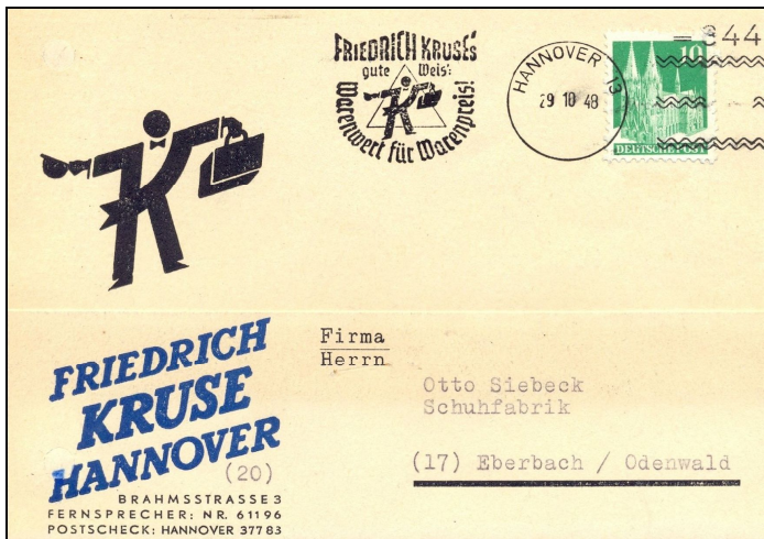
Postkarte mit Freimarkenstempler Nr. 344 der noch nach 1945 verwendet wurde.