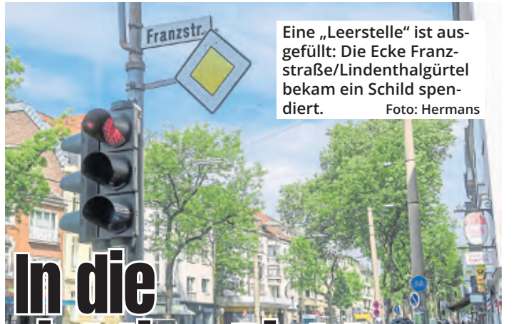
Eine „Leerstelle“ ist ausgefüllt: Die Ecke Franzstraße/Lindenthalgürtel bekam ein Schild spendiert.

niers behielt dabei die Nerven. So blieb es bis zum letzten Spiel spannend, bei dem Jack Ley einen Satzrückstand wettmachen und mit einem 11:8 im Entscheidungsdurchgang den 6:4-Sieg sowie den dritten Platz perfekt machte.