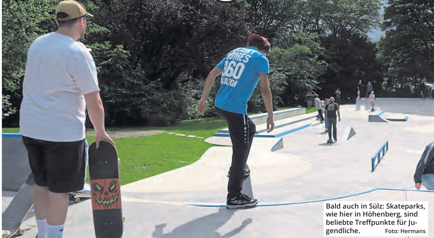
Bald auch in Sülz: Skateparks, wie hier in Höhenberg, sind beliebte Treffpunkte für Jugendliche.

Der Einsatz hat sich gelohnt: Mit gleich mehreren Petitionen hatten sich Anwohner des ehemaligen Kinderheim-Geländes an die Verwaltung gewandt. Ein Appell wurde sogar von mehr als 1800 Bürgern unterschrieben. Nun wird deren Wunsch erfüllt: Sülz bekommt eine Skateanlage am südlichen Ausgang des Beethovenparks.