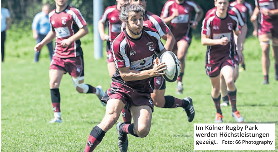
Im Kölner Rugby Park werden Höchstleistungen gezeigt.

Top-Rugby gibt es beim RSV Köln en masse zu sehen. Schließlich treten sowohl die Damen als auch die Herren des Klubs auf Bundesliga-Niveau an. Während die Saison der „Kölsche Mädcher“ bereits zu Ende ist, steht für den 15er-Kader der Herren am 11. Juni das große Saisonhighlight an. Denn im Playoff-Halbfinale geht es gegen den Munich Rugby Football Club oder den RC Rottweil um den Aufstieg in