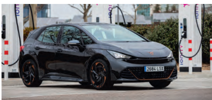
CUPRA Born bietet Ladekomfort

Interesse bekundet, Teil des Ladeökosystems zu werden. Über einen Verschlüsselungsstandard erkennt das E-Auto von selbst, dass es sich an der Ladestation befindet, und beginnt automatisch mit dem Ladevorgang. Die Nutzer benötigen zum Aufladen dabei weder ein Mobiltelefon noch die RFID-Karte – diese Funktion soll ab Mitte des Jahres verfügbar sein. CUPRA will das Aufladen einfach und intuitiv machen. WMD