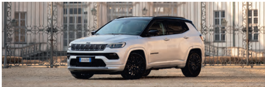
Jeep Compass e-Hybrid mit Vorderradantrieb und Siebengang-Doppelkupplungsgetriebe

Hier können die Fahrgewohnheiten beibehalten werden – Lokal emissionsfrei unterwegs