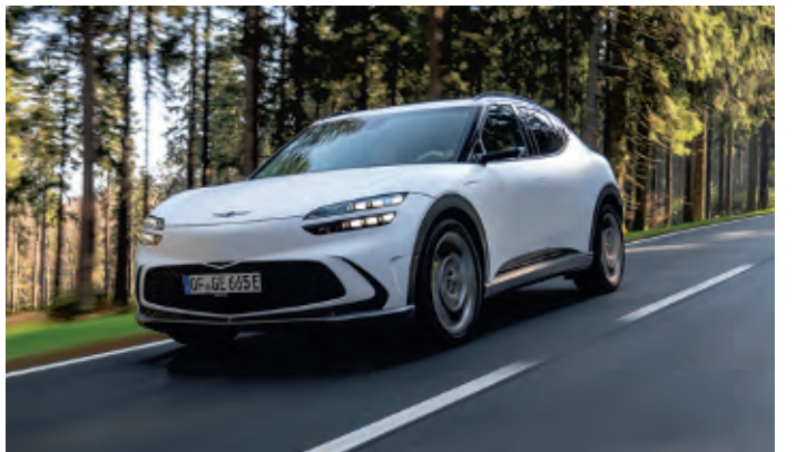
Genesis GV60 mit eigenständiger Optik

Der Jeep Compass e-Hybrid kann in den Ausstattungen „Limited“, „S“ und dem Sondermodell „Upland“ bestellt werden – alle Versionen sind mit Vorderradantrieb, Siebengang-Doppelkupplungsgetriebe und Hybrid-Technologie ausgestattet. Die Preise beginnt bei 39.600 Euro für den Compass e-Hybrid Limited und reicht über die von Nachhaltigkeit inspirierte Sonderedition „Upland“ für 42.100 Euro bis hin zum Topmodell S für 44.100 Euro. WMD