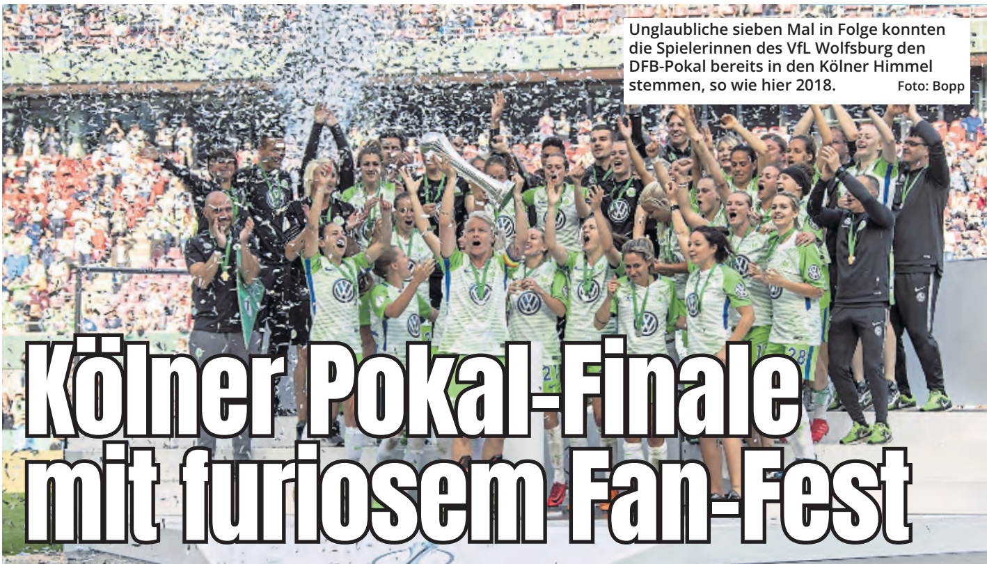
Unglaubliche sieben Mal in Folge konnten die Spielerinnen des VfL Wolfsburg den DFB-Pokal bereits in den Kölner Himmel stemmen, so wie hier 2018.