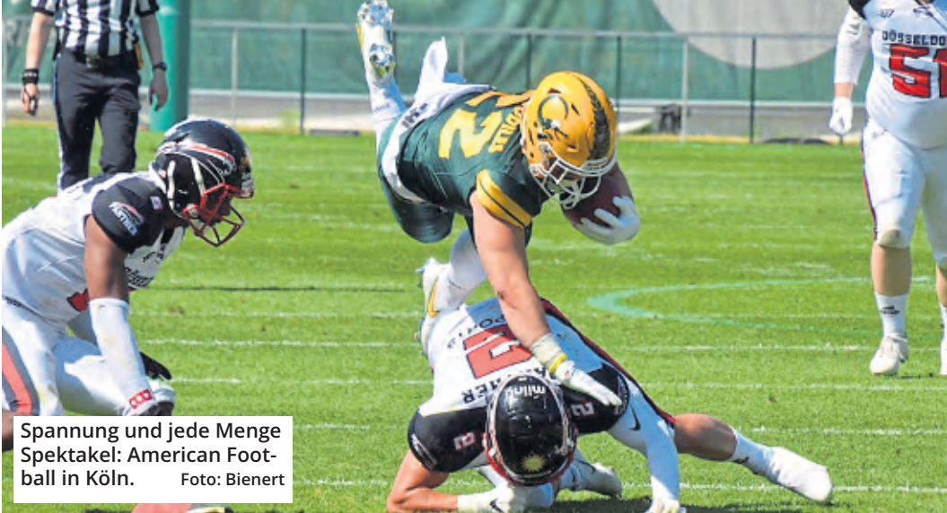
Spannung und jede Menge Spektakel: American Football in Köln.

Köln ist ein American Football-Hotspot. Hier ist mit den Cologne Crocodiles nicht nur deutsche Football-Tradition zu Hause, sondern mit den Cologne Centurions auch eine European League Of Football (ELF) Franchise der ersten