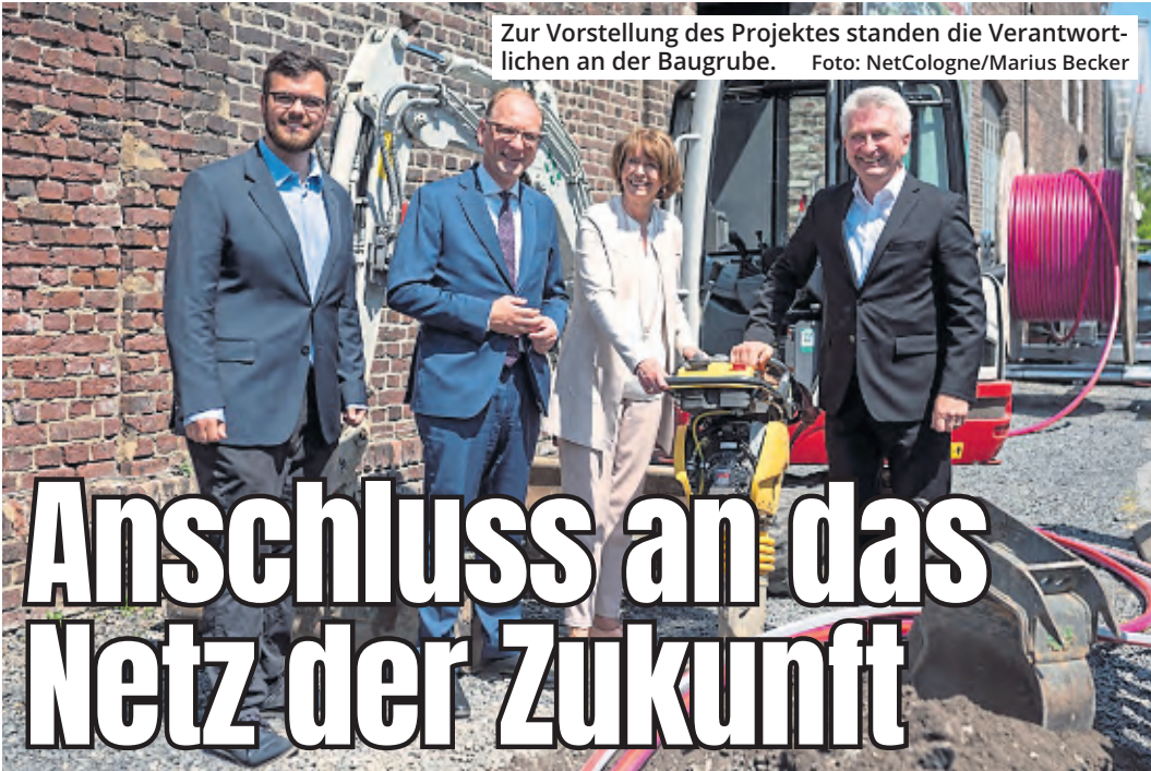
Zur Vorstellung des Projektes standen die Verantwortlichen an der Baugrube.

Aber wie auch immer die Loskugeln fallen: Nach hoffentlich überstandenen Play-offs stünden Müngersdorf einige echte Fußballfeste ins Haus.