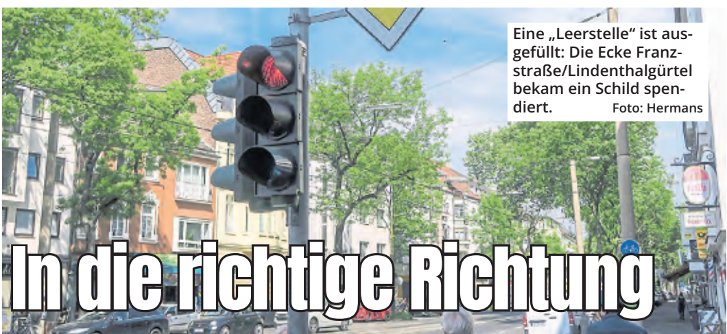
Eine „Leerstelle“ ist ausgefüllt: Die Ecke Franzstraße/Lindenthalgürtel bekam ein Schild spendiert.

Im Mediapark 8 • 50670 Köln Info: 0800 – 77 40 100 (kostenlos)