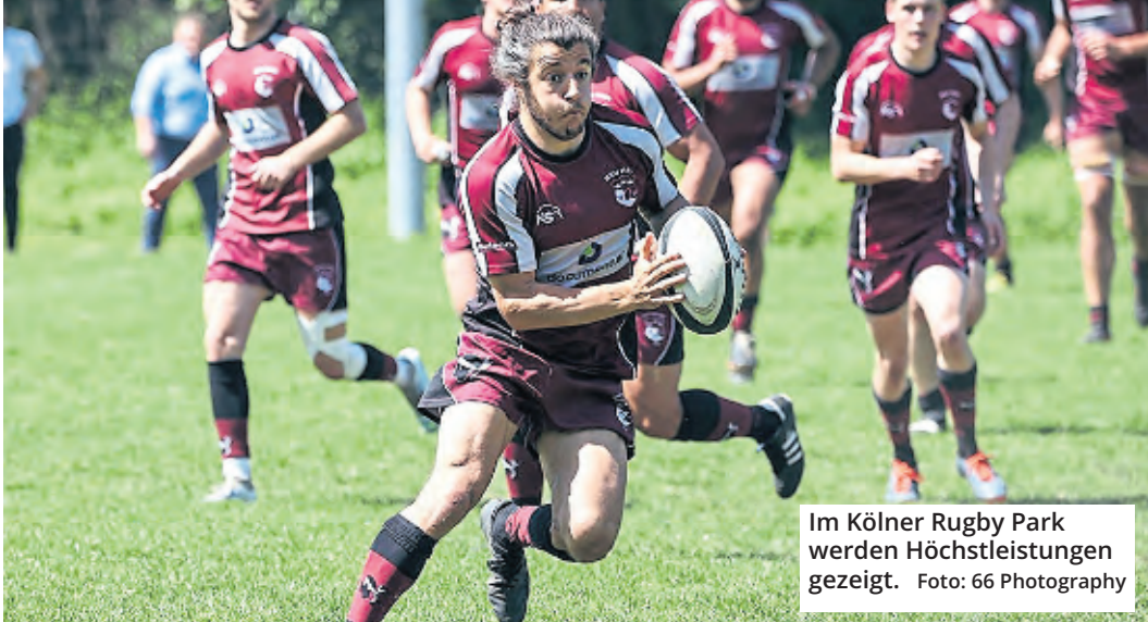
Im Kölner Rugby Park werden Höchstleistungen gezeigt.

Top-Rugby gibt es beim RSV Köln en masse zu sehen. Schließlich treten sowohl die Damen als auch die Herren des Klubs auf Bundesliga-Niveau an. Während die Saison der „Kölsche Mädcher“ bereits zu Ende ist, steht für den 15er-Kader der Herren am 11. Juni das große Saisonhighlight an. Denn im Playoff-Halbfinale geht es gegen den Munich Rugby Football Club oder den RC Rottweil um den Aufstieg in