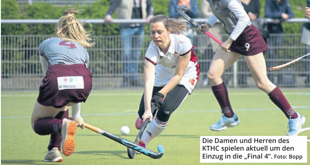
Die Damen und Herren des KTHC spielen aktuell um den Einzug in die „Final 4“.

Im Feldhockey ist der KTHC Stadion Rot-Weiss eine der Top-Adressen der Bundesliga. In der vergangenen Saison schrammten die Damen nur knapp am Endspiel vorbei, während die Herren den sechsten Titel im Feldhockey in die Domstadt holten. Auch in diesem Jahr zählen beide Teams zum Favoritenkreis. Nach über-