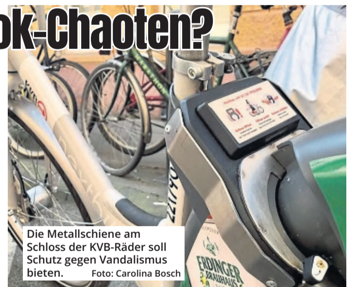
Die Metallschiene am Schloss der KVB-Räder soll Schutz gegen Vandalismus bieten.

Derzeit befinden sich die neuen Räder noch im Testlauf. Das Ziel sei, am Ende die gesamte Flotte damit auszurüsten. Man hoffe, dass die neuen Schlösser wirken und den Kriminellen somit keine Anreize mehr gegeben werden.