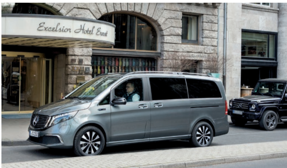
Der Mercedes-Benz EQV ist auch ein idealer Shuttle-Van für Hotels im urbanen Umfeld