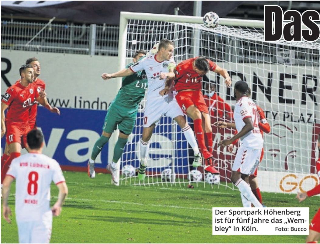
Der Sportpark Höhenberg ist für fünf Jahre das „Wembley“ in Köln.