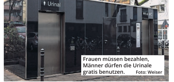
Frauen müssen bezahlen, Männer dürfen die Urinale gratis benutzen.

Das städtische Toiletten-Konzept steht vor einer Revolution: Der Grundsatz der Gleichheit der Geschlechter wird in öffentlichen WC-Häuschen umgesetzt. Andere meinen, das Toiletten-Konzept stehe dadurch vor dem finanziellen Kollaps.