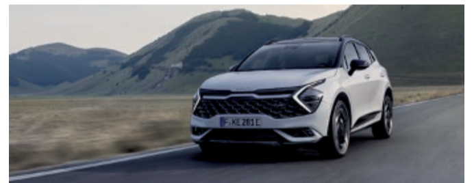
Der Kia Sportage bietet markante Optik

Köln – Kia hat seinen SUV-Bestseller Sportage in der fünften Modellgeneration erstmals in einer speziell für Europa konzipierten Version auf den Markt gebracht. Produziert wird die Europaversion des Sportage im Kia-Werk in Zilina, Slowakei, wo seit dem Betriebsbeginn im Jahr 2006 schon mehr als zwei Millionen Einheiten des SUVs vom Band gelaufen sind. Neben Mildhybrid-Versionen für Benziner und Diesel wird der Kompakt-SUV erstmals in einer Plug-in-Hybridversion angeboten. Der serienmäßig allradgetriebene Plug-in Hybrid verfügt über ein sechsstufiges Automatikgetriebe. Der Sportage Plug-in Hybrid kombiniert die 132-kW-Version des Turbobenziners mit einem 66,9-kW-Permanentmagnet-Elektromotor sowie einem 13,8-kWh-Lithium-Ionen-