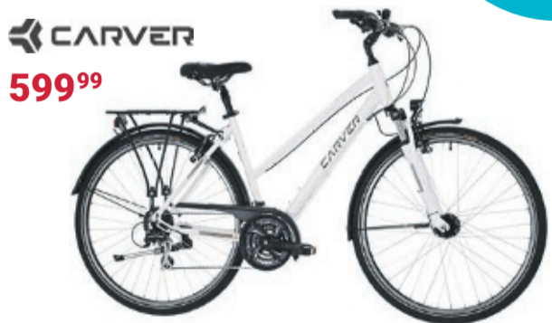
Trekkingbike | TOUR 100 Aluminiumrahmen und Suntour 3010-Federgabel • Mechanische Felgenbremsen • Shimano Acera 24-Gang-Kettenschaltung

JETZT EINS VON 40.000 FAHRRÄDERN UND E-BIKES SICHERN!