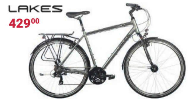
Trekkingbike | ARCO 80 Aluminiumrahmen und Zoom CH-130-Federgabel • Mechanische Felgenbremsen • Shimano Tourney 18-Gang-Kettenschaltung