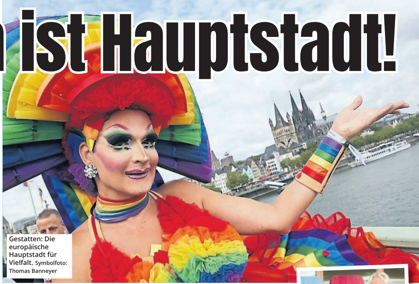
Gestatten: Die europäische Hauptstadt für Vielfalt.

Außerdem identifiziert sich rund jeder elfte Kölner als lesbisch, schwul, bisexuell, trans- beziehungsweise intergeschlechtlich oder queer, das geht aus einer Studie der Stadt aus dem Jahr 2019 hervor. Eine Umfrage in deren Rahmen ergab außerdem, dass 86 Prozent der befragten Unternehmens-