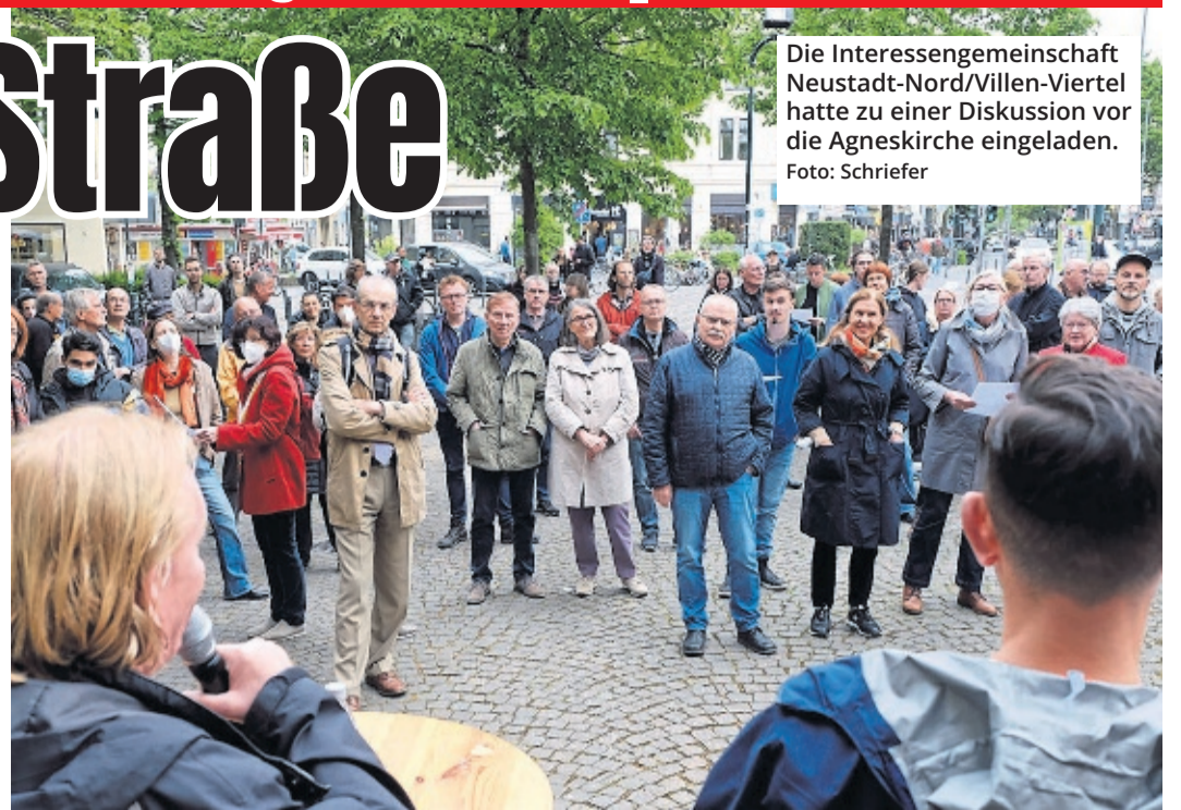
Die Interessengemeinschaft Neustadt-Nord/Villen-Viertel hatte zu einer Diskussion vor die Agneskirche eingeladen.

Ohne Mitspracherecht der Anwohner möchte die Mehrheitlich von den Grünen bestimmte Bezirksvertretung der Innenstadt die Neusser Straße für den motorisierten Durchgangsverkehr zwischen Neusser Wall und Weiburgstraße sperren.