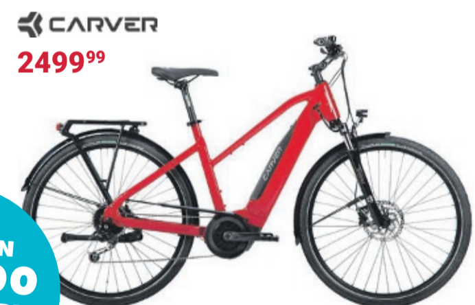
E-Trekkingbike | ROUTE E.420 Bosch Active Line Plus 250-W-Motor mit 50 Nm + 500-Wh-Li-Ion-Akku • Shimano Deore 9-Gang-Kettenschaltung • Bosch Purion-Display