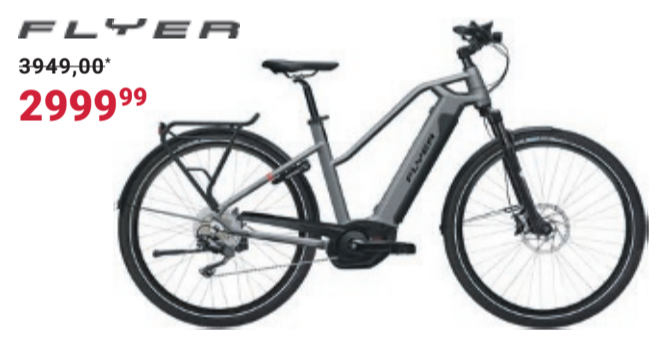
E-Trekkingbike | UPSTREET4 7.10 LE KIOX Bosch Performance Line CX 250-W-Motor mit 75 Nm + 500-Wh-Li-Ion-Akku • Shimano Deore 10-Gang-Kettenschaltung • Bosch Intuvia-Display