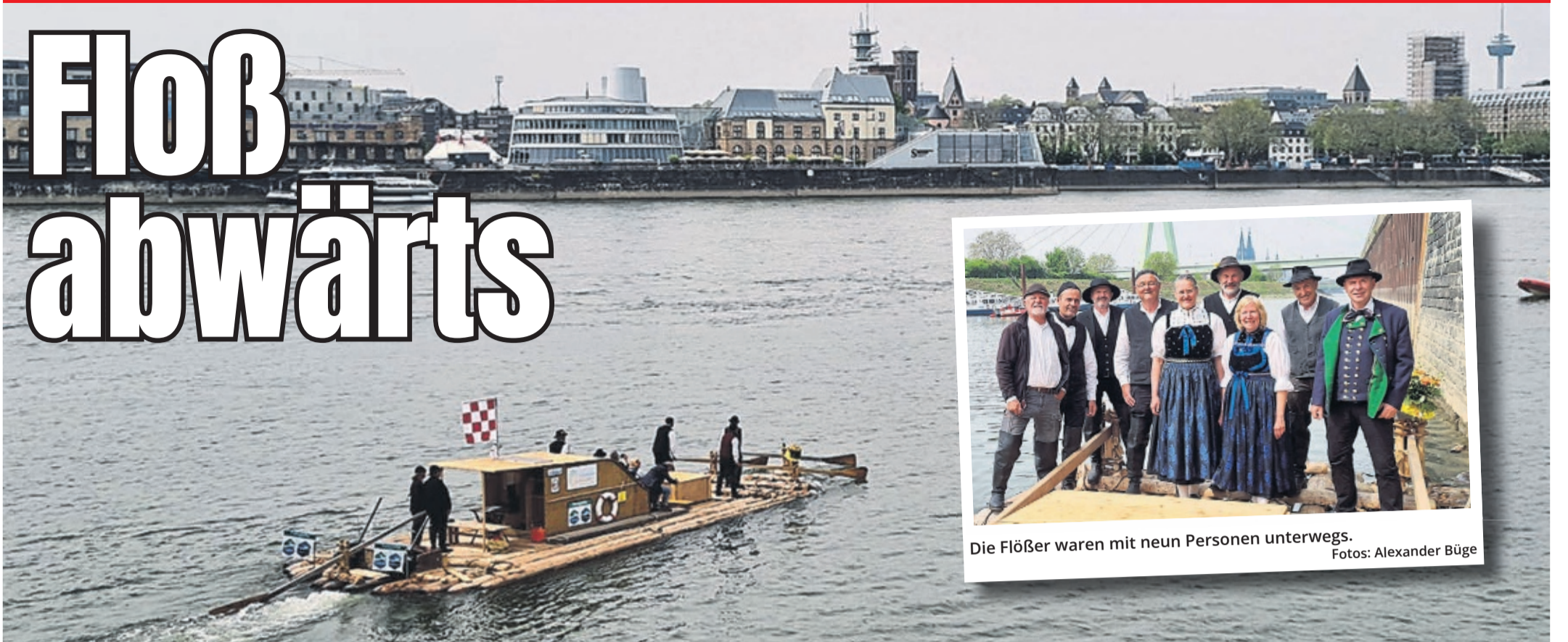
Die Flößer waren mit neun Personen unterwegs.

Auf diese Idee muss man erst mal kommen: Die Schiltacher Flößer fuhren jüngst mit einem kleinen Holzfloß über den Rhein und sorgten dabei für jede Menge Verwunderung.