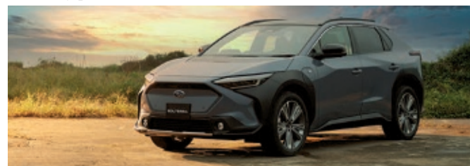
Neuer Subaru Solterra fährt rein elektrisch