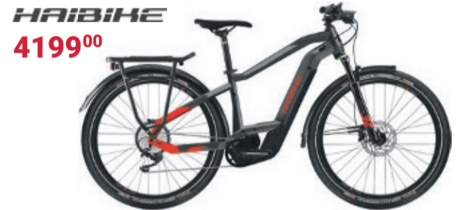
E-Citybike | TREKKING 9 Bosch Performance Line CX 250-W-Motor mit 85 Nm + 625-Wh-Li-Ion-Akku • Shimano Deore 11-Gang-Kettenschaltung • Bosch Intuvia-Display