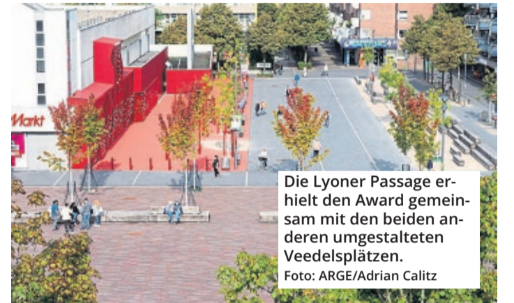
Die Lyoner Passage erhielt den Award gemeinsam mit den beiden anderen umgestalteten Veedelsplätzen.

Insgesamt erhielten die drei Plätze 150 neue Bäume, 1.200 Quadratmeter Spiel- und Sportfläche, 450 Meter Sitzbänke und Sitzstufen und 130 Fahrradstellplätze. (alk)