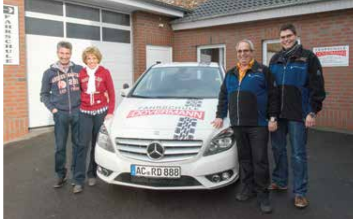
Die Fahrschule bleibt in Haaren