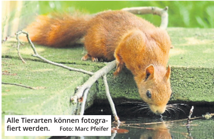
Alle Tierarten können fotografiert werden.

Die ehemalige Klosterkirche sei aber auch „ein Denkmal des sozialen Fortschritts“. Dort hätte die Ordensgemeinschaft der Schwestern vom Guten Hirten „gefallenen Mädchen“ eine Perspektive gegeben. Als das aufgrund von gesellschaftlichen Veränderungen nicht mehr notwendig war, wurde das Gotteshaus 1991 für 30 Jahre an die Syrisch-Orthodoxe Gemeinde verpachtet, die auch gern länger geblieben wäre. Immerhin konnte sie eine Verlängerung bis 2024 erwirken. Dann soll der Kirchenneubau der Gemeinde in Merkenich fertiggestellt sein. Nun ist das Amt für Denkmalschutz und Denkmalpflege am Zug.