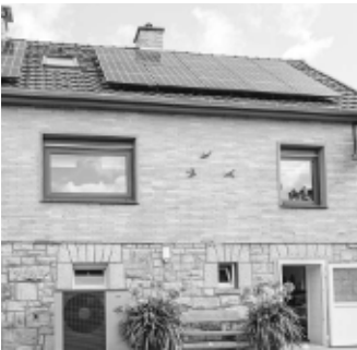
Mit einer Photovoltaik-Anlage selbst erzeugter Strom schafft Unabhängigkeit von steigenden Energiepreisen – NIBE PV-Smart macht die Nutzung in Verbindung mit einer NIBE Wärmepumpe besonders intelligent.

Voraussetzung: Die Wärmepumpen-Regelung sollte den von der Sonne erzeugten PV-Strom zur späteren Nutzung auf verschiedene Arten thermisch speichern oder in heißen Monaten zur Kühlung einsetzen können.