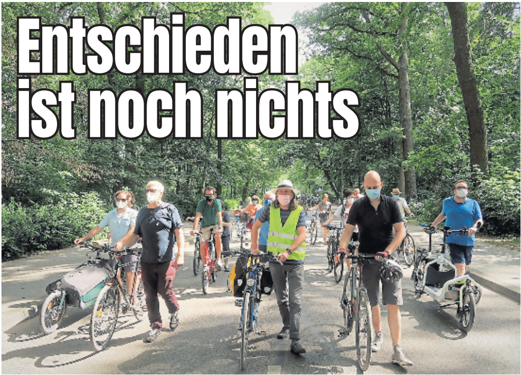
Mit einer Demonstration und anderen Aktionen warb eine Bürgerinitiative für die Sperrung der Kitschburger Straße im Kölner Westen.