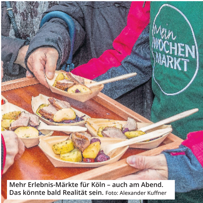
Mehr Erlebnis-Märkte für Köln – auch am Abend. Das könnte bald Realität sein.

Auf den Abendmärkten soll es Angebote für jeden Geldbeutel und keinen Konsumzwang geben. „Das ist ein guter konzeptioneller Ansatz zur Bereicherung unseres städtischen Marktangebotes“, meint die SPD. Da der Schwerpunkt in den jeweiligen Bezirken liege, müssten auch die Bezirksvertretungen als Veedelskenner mitreden.