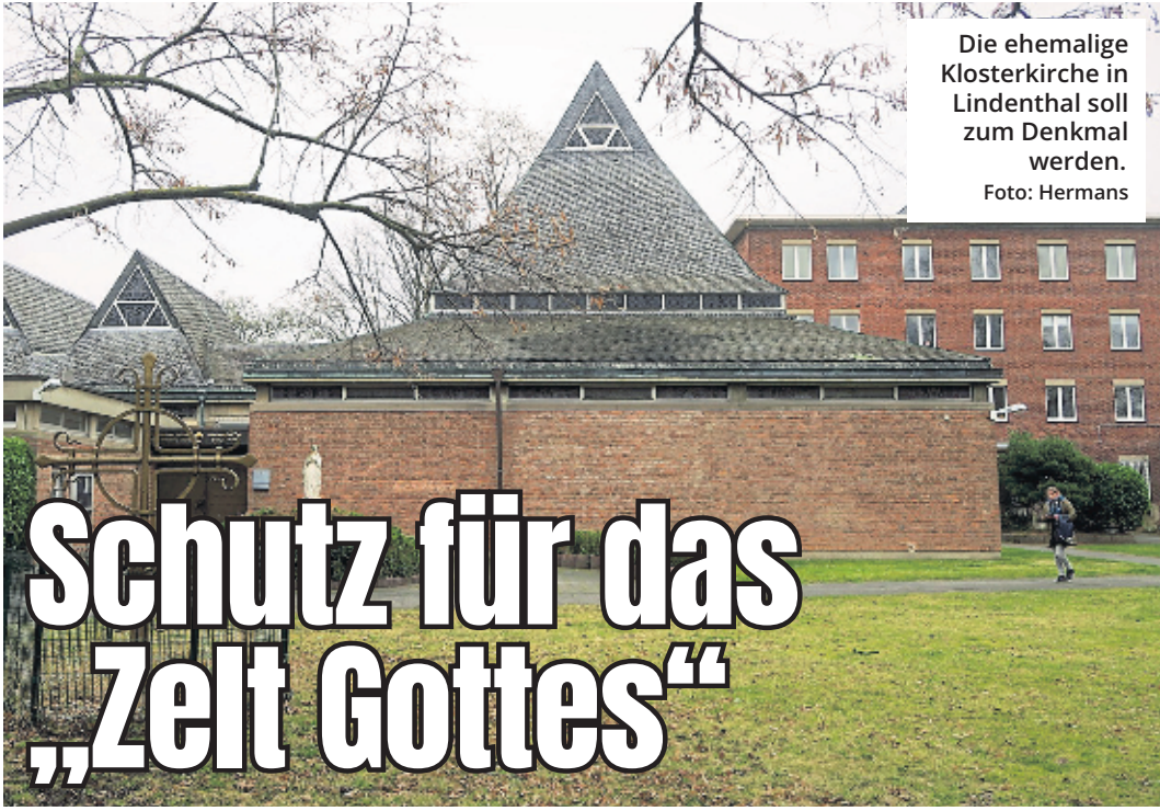
Die ehemalige Klosterkirche in Lindenthal soll zum Denkmal werden.