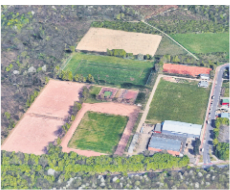
Bis zu sechs Fußballfelder könnten auf den vorhandenen Flächen der Bezirks-sportanlage entstehen. Die Ascheplätze (l.) sollen zu Kunstrasenfeldern werden.