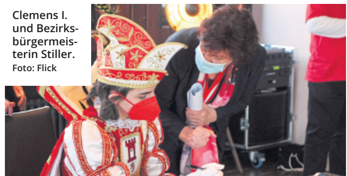
Clemens I. und Bezirksbürgermeisterin Stiller.

Die SpVg. Porz und Viktoria Köln pflegen seitdem eine sehr enge Freundschaft. In deren Zusammenhang kommt es immer wieder zu Freundschaftsspielen der beiden Teams.