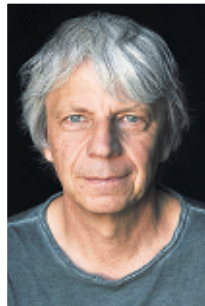
Regisseur Andreas Dresen