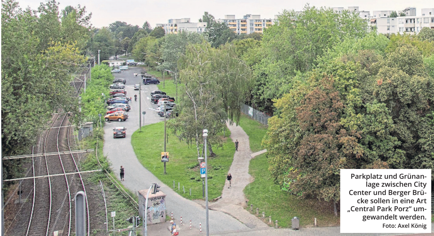
Parkplatz und Grünanlage zwischen City Center und Berger Brücke sollen in eine Art „Central Park Porz“ umgewandelt werden.