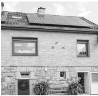
Mit einer Photovoltaik-Anlage selbst erzeugter Strom schafft Unabhängigkeit von steigenden Energiepreisen – NIBE PVSmart macht die Nutzung in Verbindung mit einer NIBE Wärmepumpe besonders intelligent.

Voraussetzung: Die Wärmepumpen-Regelung sollte den von der Sonne erzeugten PV-Strom zur späteren Nutzung auf verschiedene Arten thermisch speichern oder in heißen Monaten zur Kühlung einsetzen können.