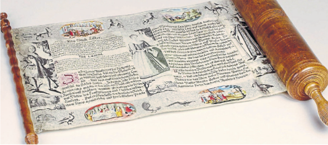
Die Esther-Rolle Megillah aus dem Jahr 1746.