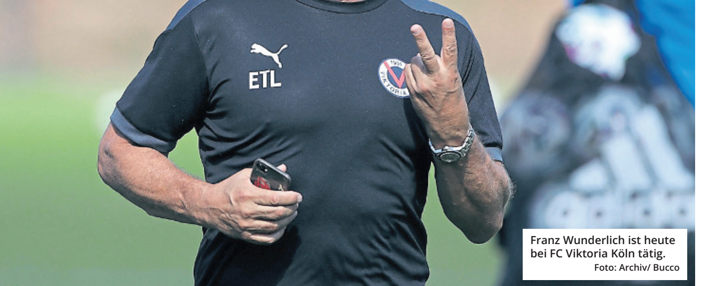
Franz Wunderlich ist heute bei FC Viktoria Köln tätig.