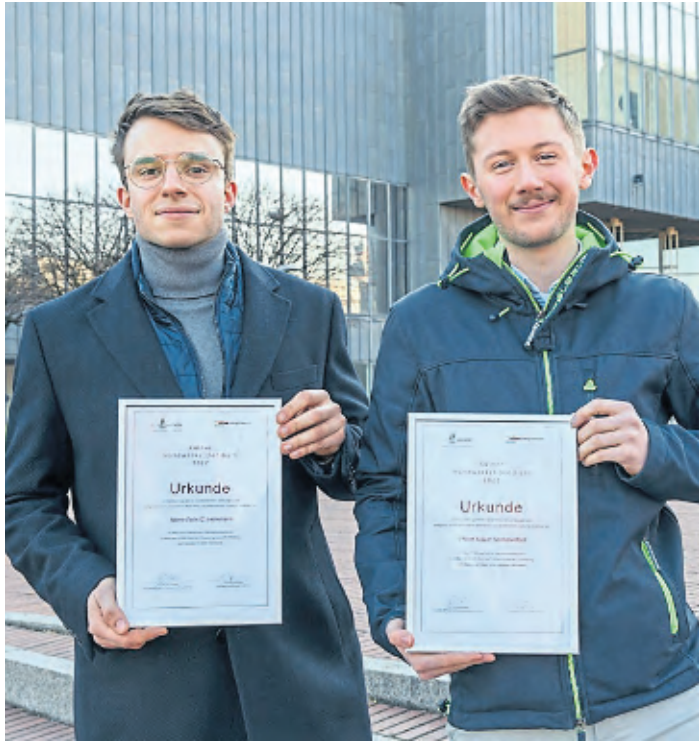
Die beiden Stipendiaten.

Lesen Sie jetzt am Sonntag, 3. April, den großen Talk mit Sternekoch Tim Raue