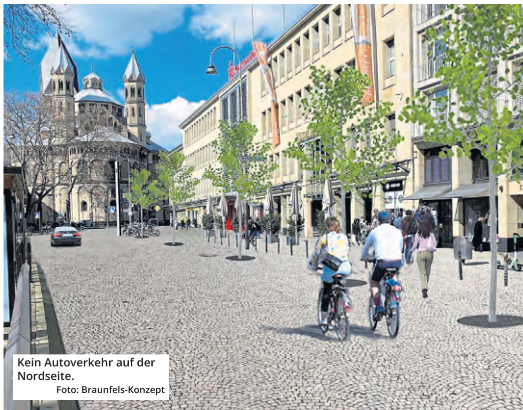
Kein Autoverkehr auf der Nordseite.

In der Halle der Kreissparkasse Köln am Neumarkt 18-24 wird das Braunfels-Konzept in der kommenden Woche auf Stellwänden präsentiert.