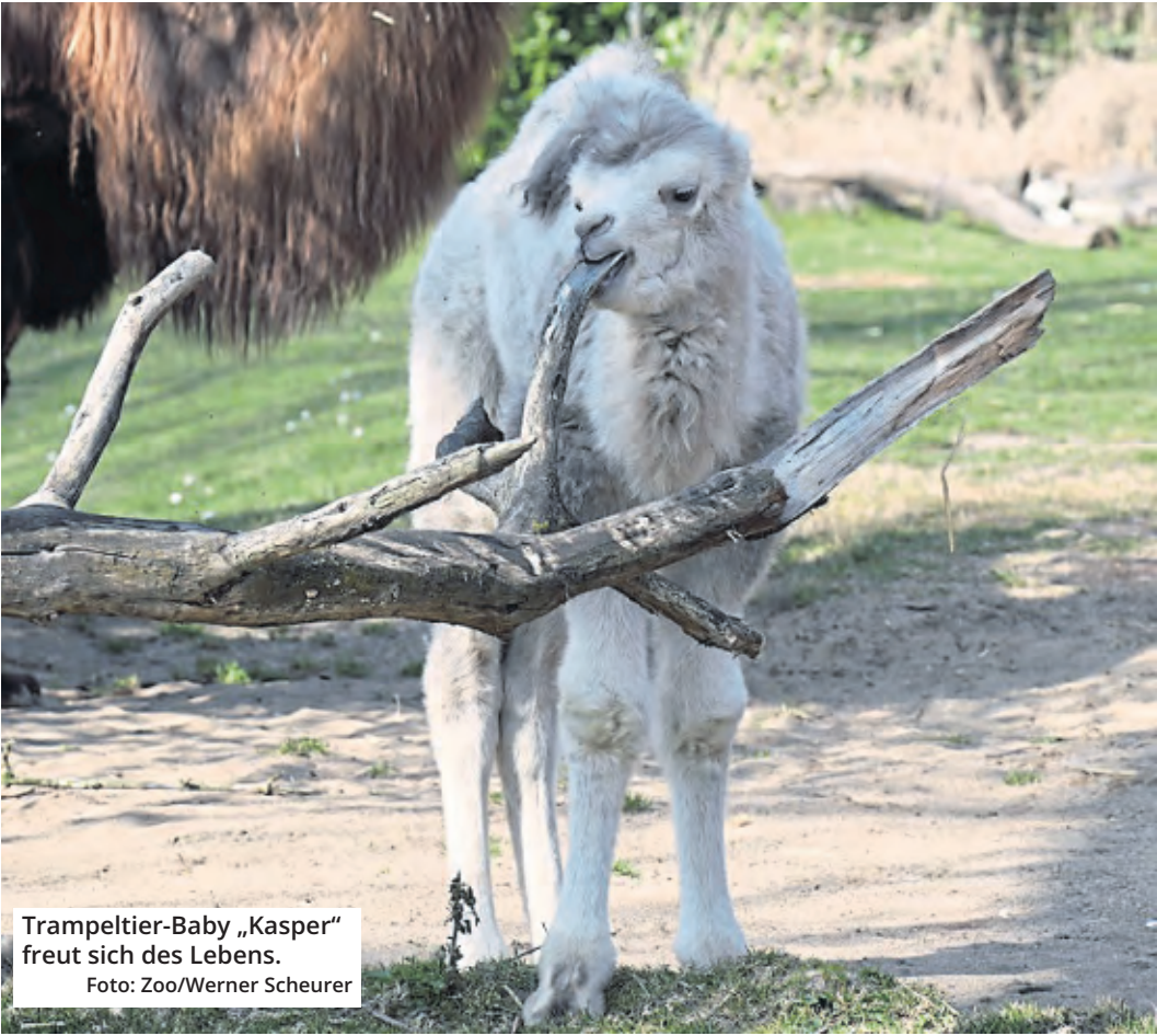
Trampeltier-Baby „Kasper“ freut sich des Lebens.