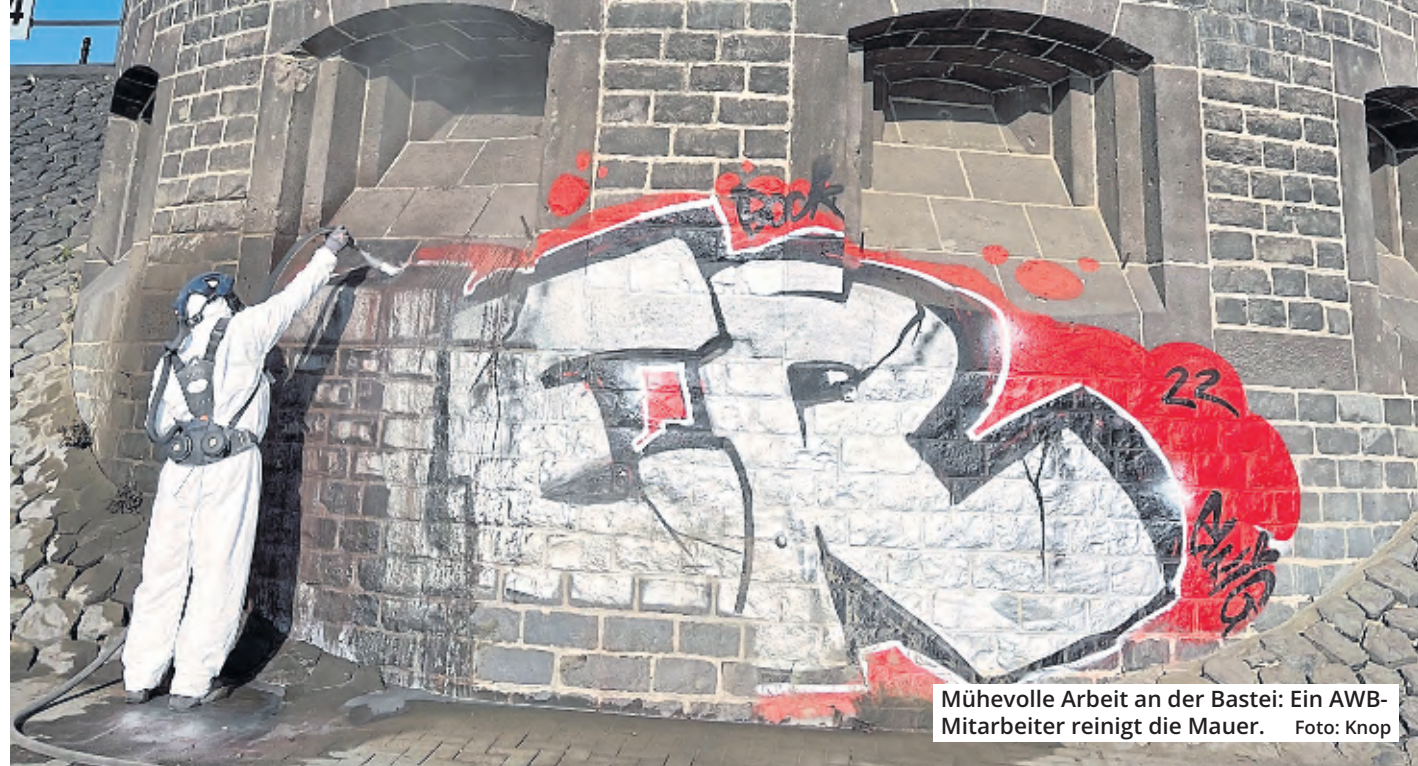
Mühevoller Arbeit an der Bastei: Ein AWB-Mitarbeiter reinigt die Mauer.

Köln. Die Arbeiten sind schon in 200 Meter Entfernung zu hören, zu sehen sind sie dann erst aus der Nähe: Mit einem Hochdruckreiniger bewaffnet steht ein Mitarbeiter der AWB im Ganzkörperanzug an der Bastei und befreit die großflächige