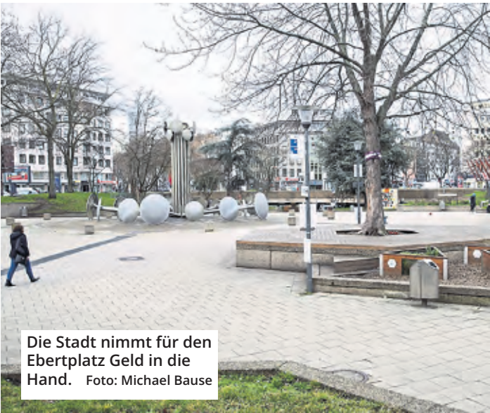
Die Stadt nimmt für den Ebertplatz Geld in die Hand.

spielung (120 000 Euro), der Brunnenbetrieb (84 000 Euro), Sauberkeit und Sicherheit/technische Infrastruktur (130 000 Euro), Kommunikations- und Öffentlichkeitsarbeit sowie die Moderation der verschiedenen Arbeitsgruppen und Projektarbeit (297 000 Euro). Die Bürger sind weiterhin in das Programm zur Zwischennutzung eingebunden. Und das Engagement soll ausgeweitet werden. Öffentlichkeit und die Akteure sollen auch in die langfristige Umgestaltung des Ebertplatzes einbezogen werden. Das Projekt, so die Verwaltung, trage dazu bei, den Platz wieder attraktiver zu gestalten, Möglichkeiten zur Mitgestaltung des öffentlichen Raumes zu schaffen und Nutzungsideen unter Realbedingungen für den parallel beginnenden Planungsprozess zu erproben.