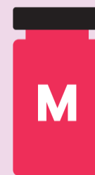
Spikevax® (Moderna) für Menschen ab 30 Jahren

Für Ihre 2. Auffrischimpfung wird einer der folgenden Impfstoffe empfohlen: