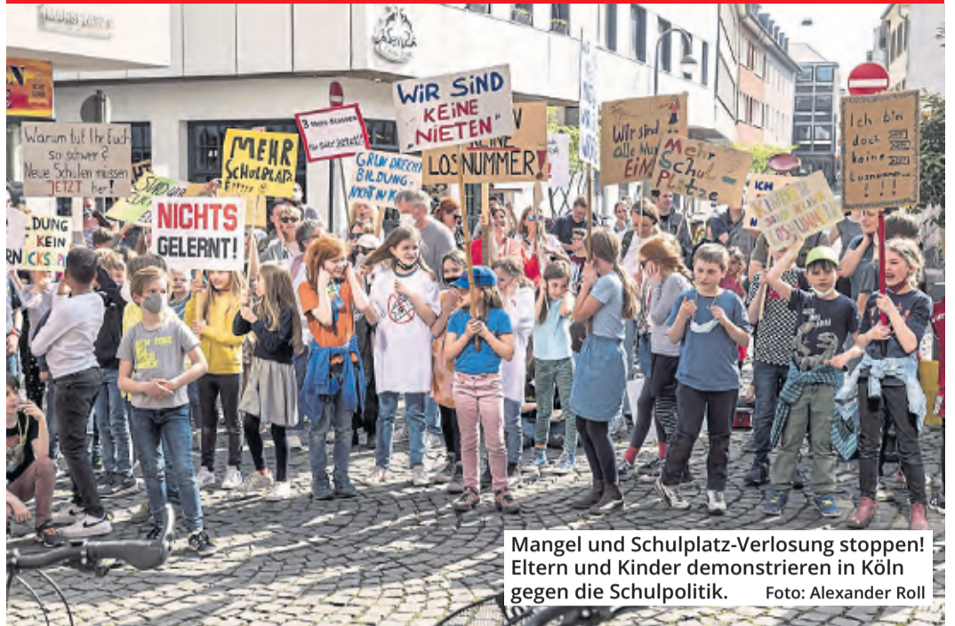
Mangel und Schulplatz-Verlosung stoppen! Eltern und Kinder demonstrieren in Köln gegen die Schulpolitik.