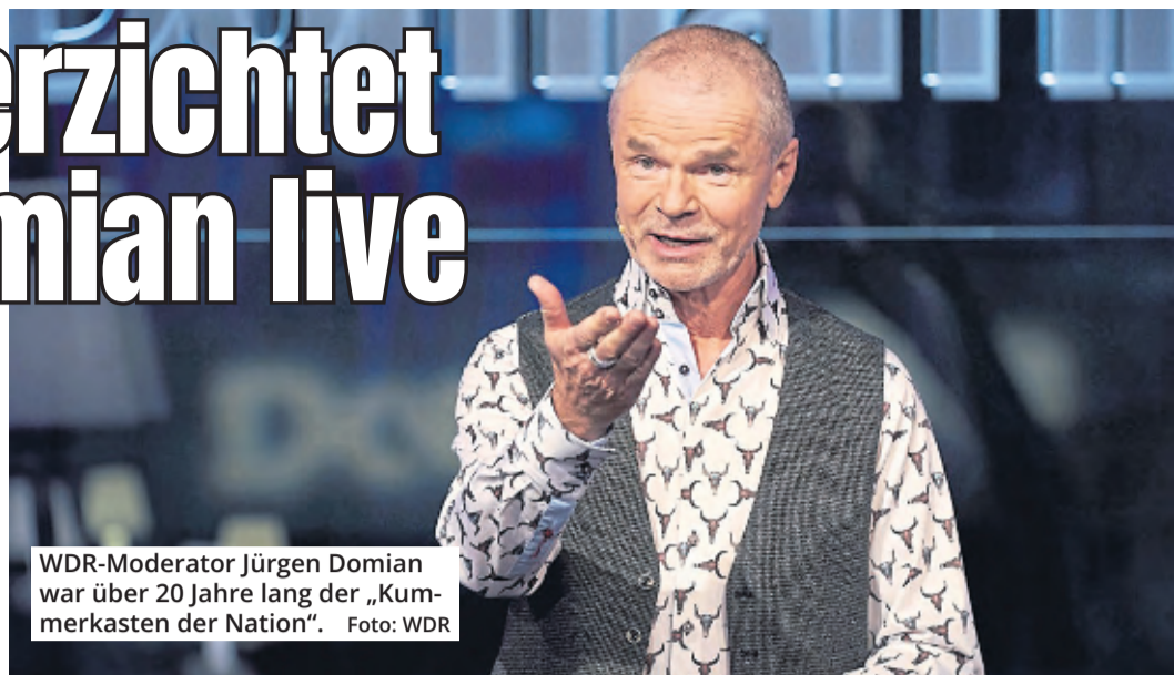
WDR-Moderator Jürgen Domian war über 20 Jahre lang der „Kummerkasten der Nation“.

Auch als Podcast wird es das Format nicht mehr geben. „Ihr Lieben, es hat lange gedauert. Leider konnte ich euch nicht früher etwas Handfestes mitteilen. Nun aber ist die Entscheidung gefallen: Es wird im WDR-Fernsehen keine Fortsetzung der Sendung „Domian