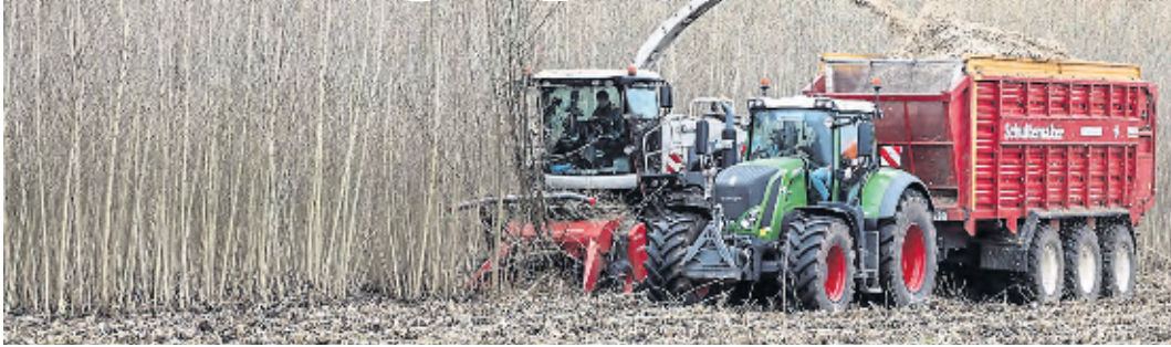
Pappeln und Weiden werden im Energiewald geerntet.