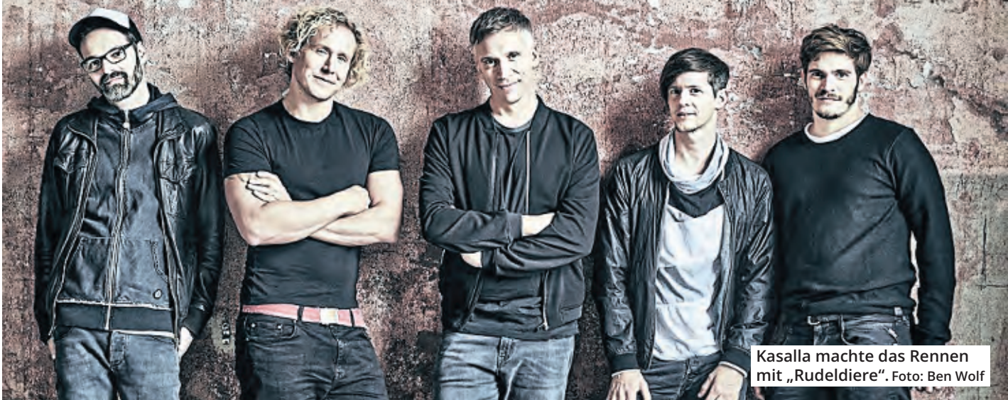
Kasalla machte das Rennen mit „Rudeldiere“.