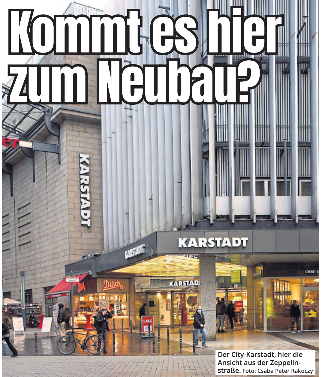
Der City-Karstadt, hier die Ansicht aus der Zeppelinstraße.

Ein seit Jahrzehnten gewohntes Stadtbild – Karstadt zwischen Breite Straße und Zeppelinstraße – könnte sich gewaltig verändern. Ein Investor hat Pläne, den Komplex in der City abzureißen, um auf dem Grundstück einen Neubau mit Tiefgarage zu errichten. Das städtische Bauaufsichtsamt soll bereits eine Voranfrage für den Abbruch des Kaufhauses in bester Innenstadtlage erhalten haben.