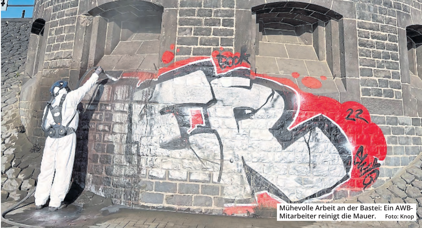
Mühevoller Arbeit an der Bastei: Ein AWB-Mitarbeiter reinigt die Mauer.

Köln. Die Arbeiten sind schon in 200 Meter Entfernung zu hören, zu sehen sind sie dann erst aus der Nähe: Mit einem Hochdruckreiniger bewaffnet steht ein Mitarbeiter der AWB im Ganzkörperanzug an der Bastei und befreit die großflächige