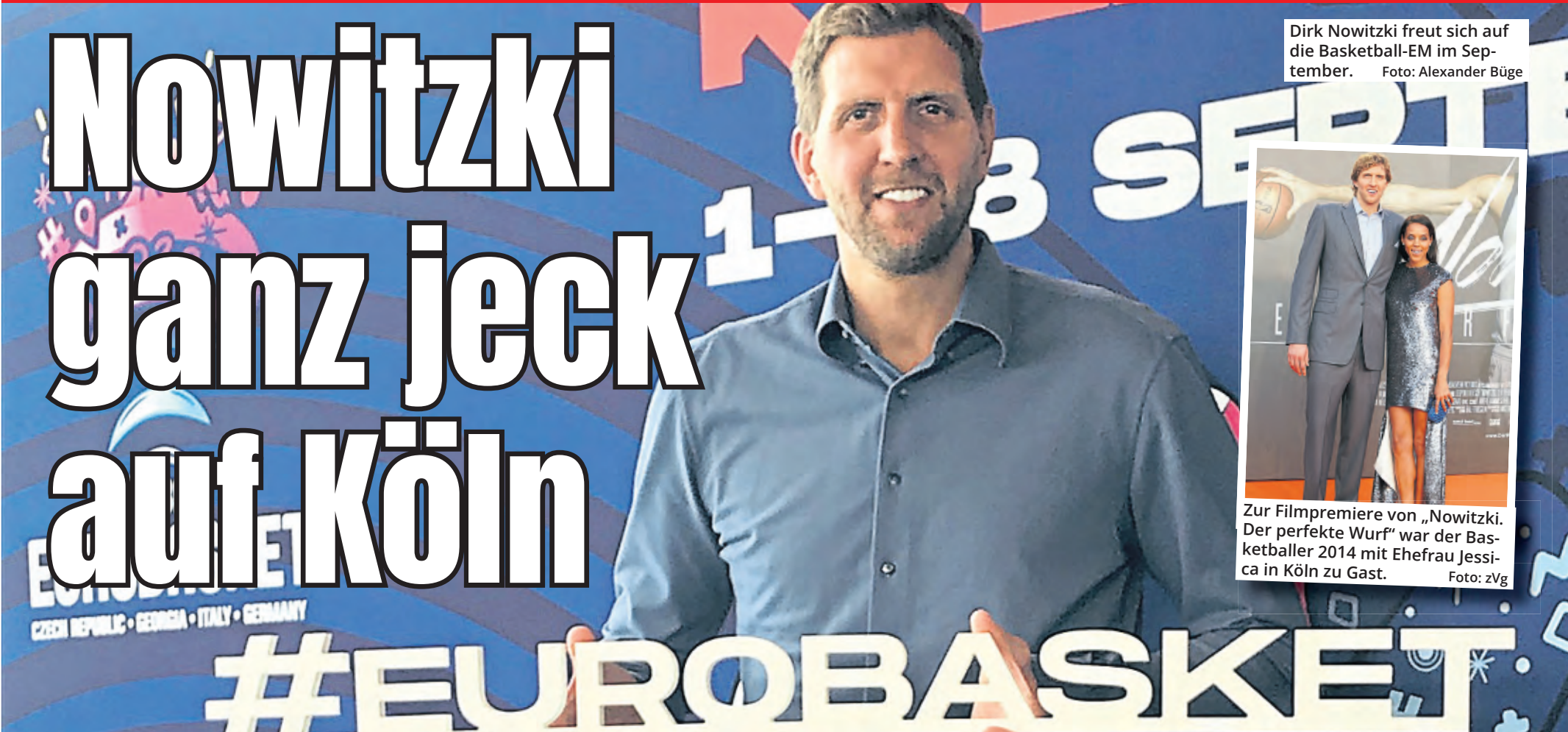
Dirk Nowitzki freut sich auf die Basketball-EM im September.