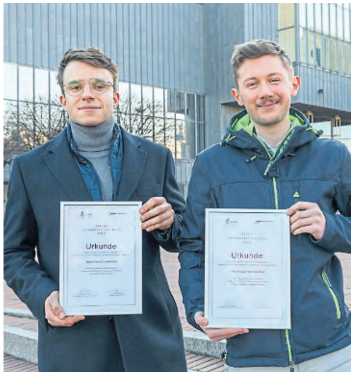
Die beiden Stipendiaten.

Lesen Sie jetzt am Sonntag, 3. April, den großen Talk mit Sternekoch Tim Raue