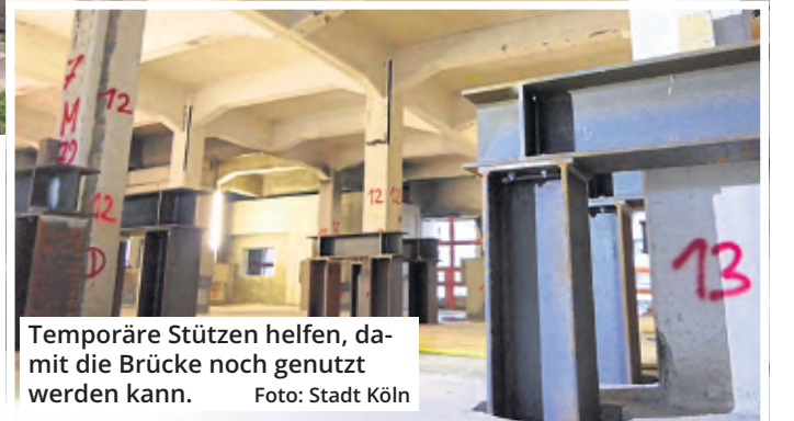
Temporäre Stützen helfen, damit die Brücke noch genutzt werden kann.

An der rechtsrheinischen Rampe wurden die erheblichen Schäden erst nach Entkernung und Entfernung der nichttragenden Wände sichtbar. Genommene Baustoffproben, Baustoffanalysen und die Einholung gutachterlicher Empfehlungen haben die Bauzeit erheblich verlängert. Die nun ermittelten Mehrkosten betragen nach aktuellem Stand 137,9 Millionen Euro brutto. Darin wurden erhöhte Baunebenkosten berücksichtigt. Denn die Kosten für Baumaterialien sind in den letzten Mo-