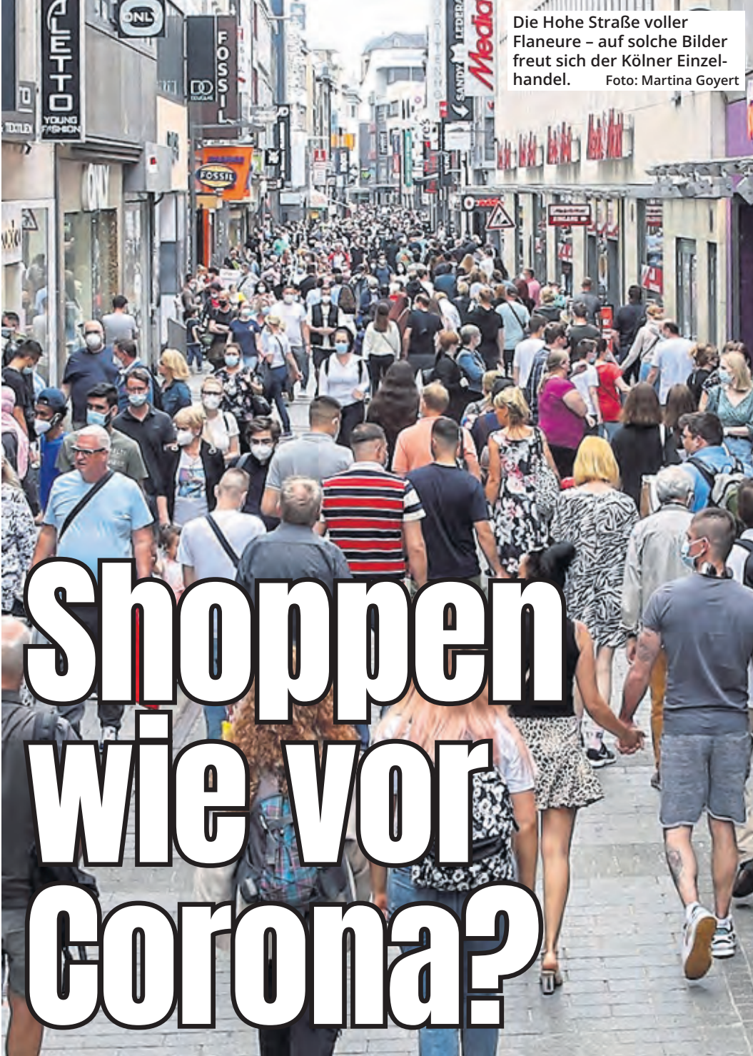
Die Hohe Straße voller Flaneure – auf solche Bilder freut sich der Kölner Einzelhandel.