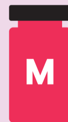
Spikevax® (Moderna) für Menschen ab 30 Jahren

Für Ihre 2. Auffrischimpfung wird einer der folgenden Impfstoffe empfohlen: