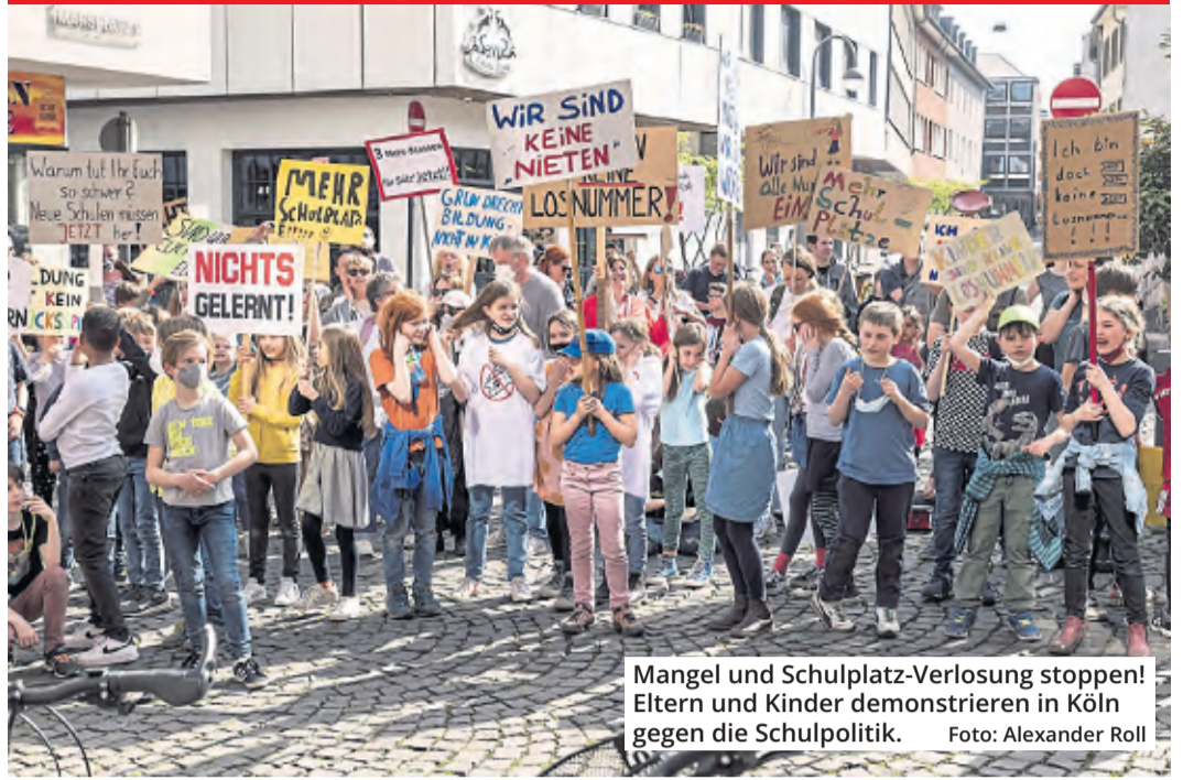
Mangel und Schulplatz-Verlosung stoppen! Eltern und Kinder demonstrieren in Köln gegen die Schulpolitik.