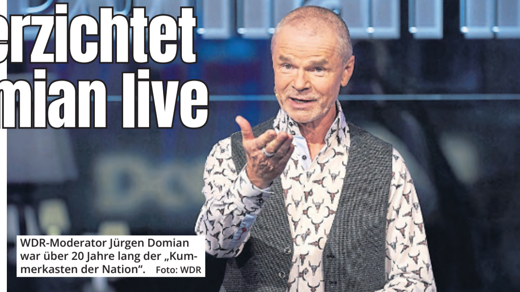
WDR-Moderator Jürgen Domian war über 20 Jahre lang der „Kummerkasten der Nation“.

Auch als Podcast wird es das Format nicht mehr geben. „Ihr Lieben, es hat lange gedauert. Leider konnte ich euch nicht früher etwas Handfestes mitteilen.“