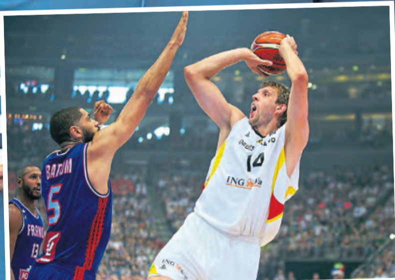
Wie hier bei der EM-Vorbereitung 2015 in Köln, damals noch mit Nowitzki als aktivem Nationalspieler gegen Frankreich, wird es bei der EuroBasket im September wieder hochspannende Matches in der Lanxess Arena geben.

Kölner Frühlingsvolksfest startet am Ostersonntag