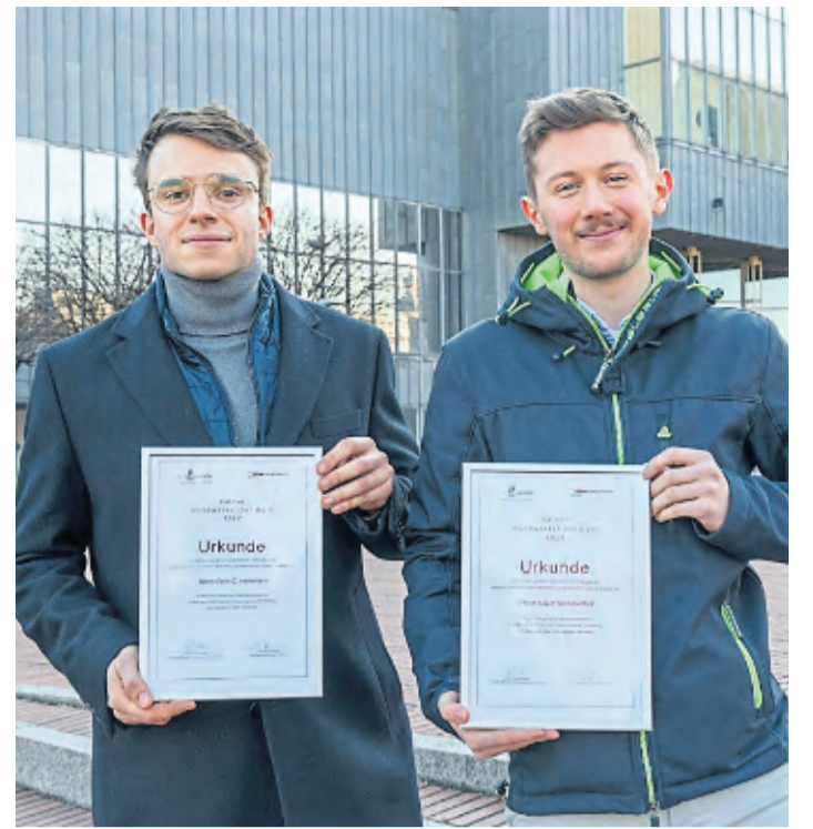
Die beiden Stipendiaten.

Lesen Sie jetzt am Sonntag, 3. April, den großen Talk mit Sternekoch Tim Raue