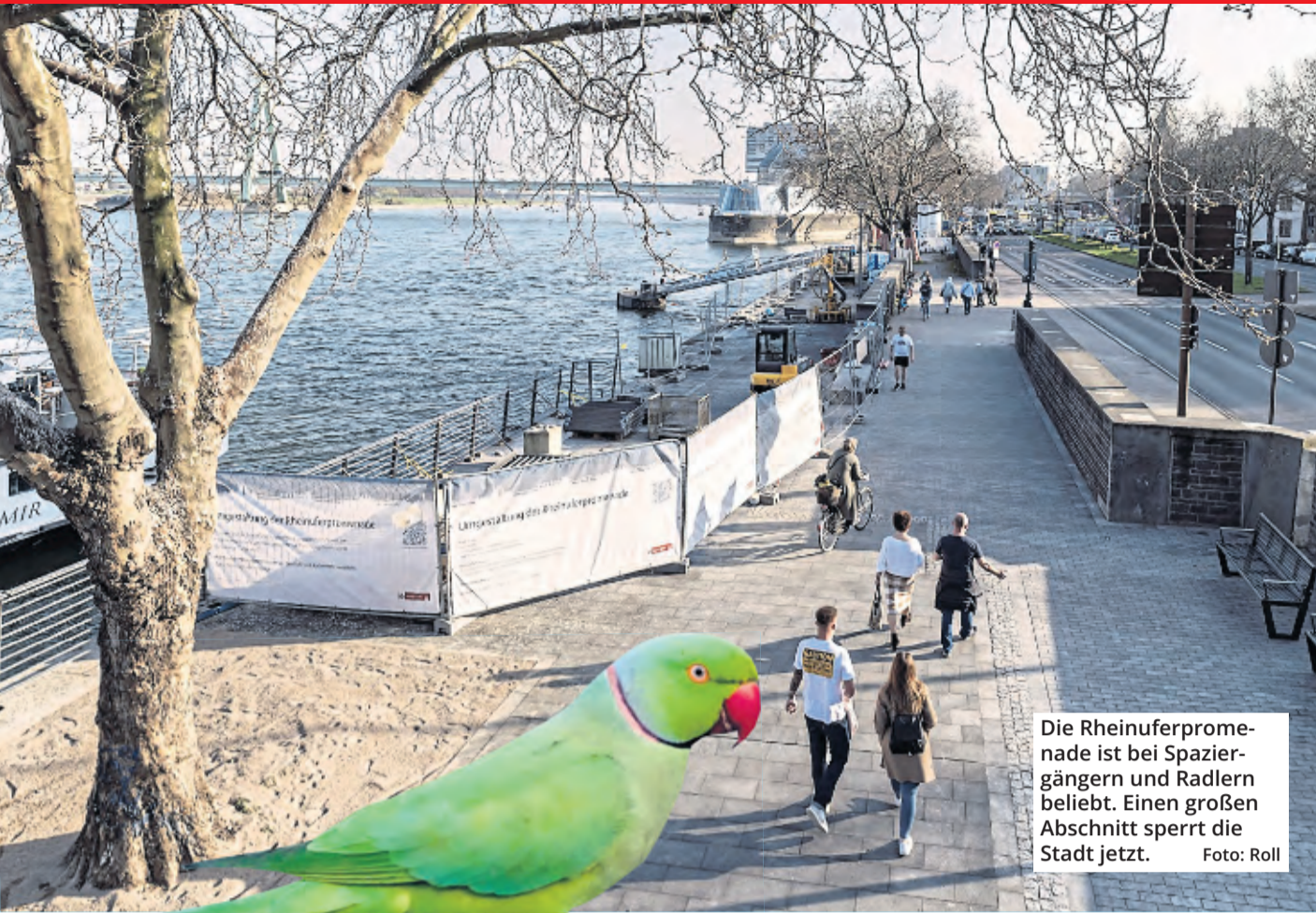
Die Rheinuferpromenade ist bei Spaziergängern und Radlern beliebt. Einen großen Abschnitt sperrt die Stadt jetzt.