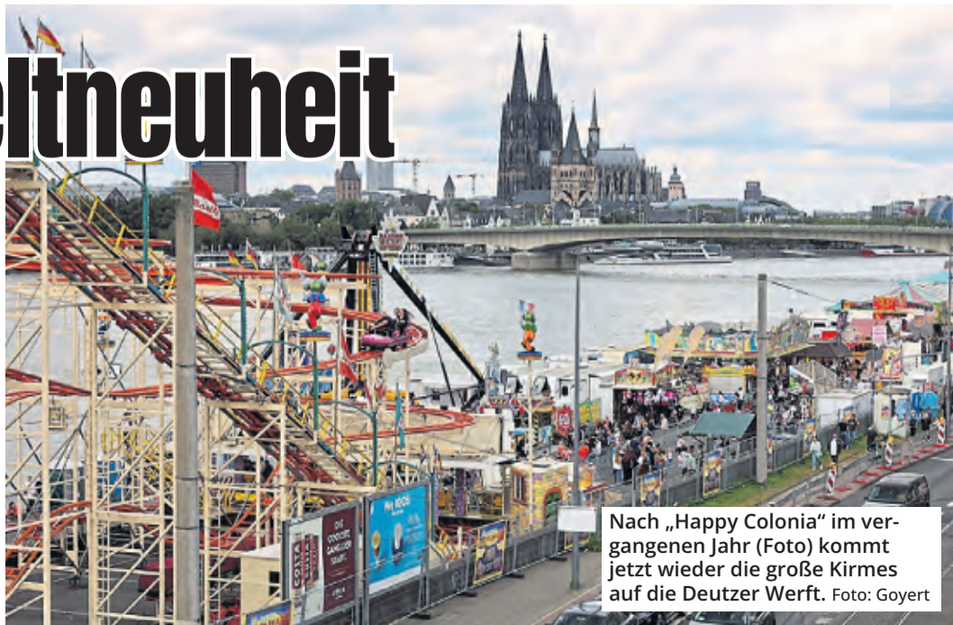
Nach „Happy Colonia“ im vergangenen Jahr (Foto) kommt jetzt wieder die große Kirmes auf die Deutzer Werft.

Bei „Apollo 13“ kann man außerdem ein „Astronautentraining“ absolvieren – in einem Spaceshuttle geht es hoch auf 55 Meter. Dann werden Geschwindigkeiten von 120 km/h erreicht. Je nach Gondelrotation und Drehgeschwindigkeit wirken G-Kräfte von 0 bis 5 auf den Körper. Zum Vergleich: Beim Start einer Weltall-Rakete wirken etwa 3 G auf die Astronauten ein. Los geht die Deutzer Kirmes am Ostersonntag, 16. April. Schluss ist dann am 1. Mai.