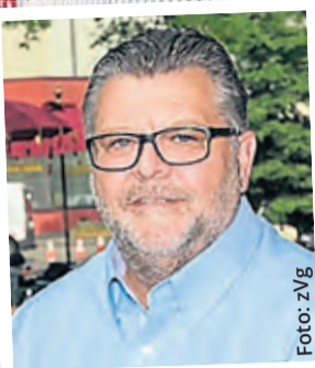
Kölns Handelskümmerer Hans-Günter Grawe.