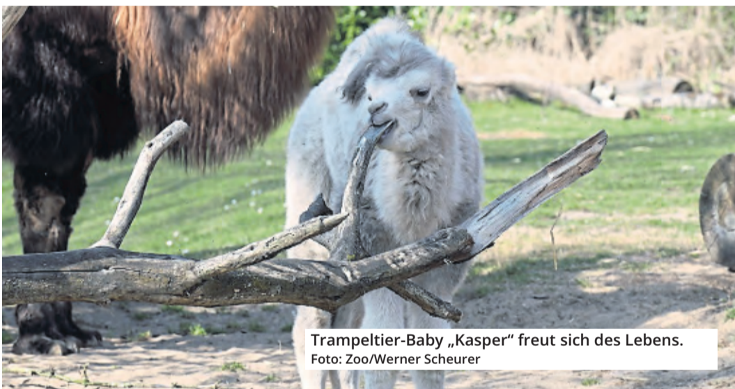
Trampeltier-Baby „Kasper“ freut sich des Lebens.

Schokoladenmuseum Köln Am Schokoladenmuseum 1a 50678 Köln Telefon: 0221 - 931 88 80 www.schokoladenmuseum.de