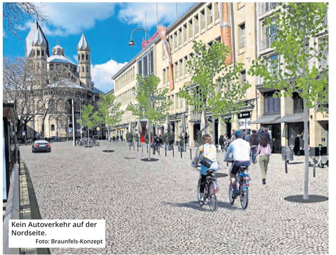
Kein Autoverkehr auf der Nordseite.

In der Halle der Kreissparkasse Köln am Neumarkt 18-24 wird das Braunfels-Konzept in der kommenden Woche auf Stellwänden präsentiert.