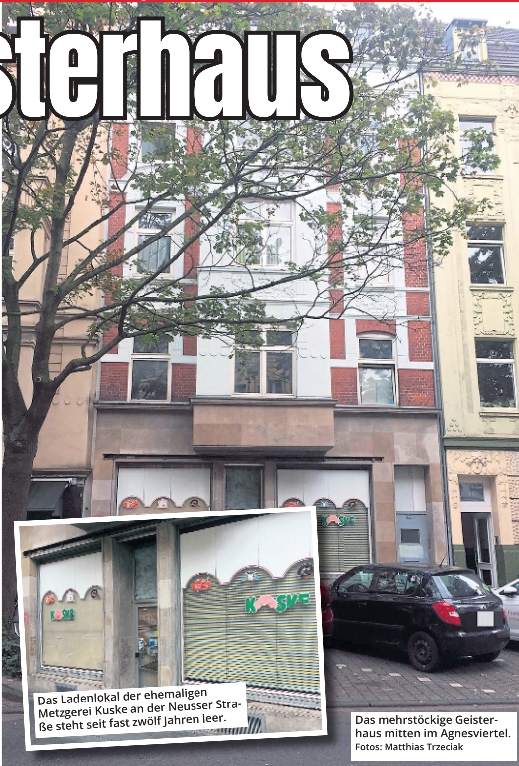
Das mehrstöckige Geisterhaus mitten im Agnesviertel.

Könnten sich Schuldner und Gläubiger verständigen, wird die Zwangsversteigerung für einen bestimmten Zeitraum ausgesetzt.