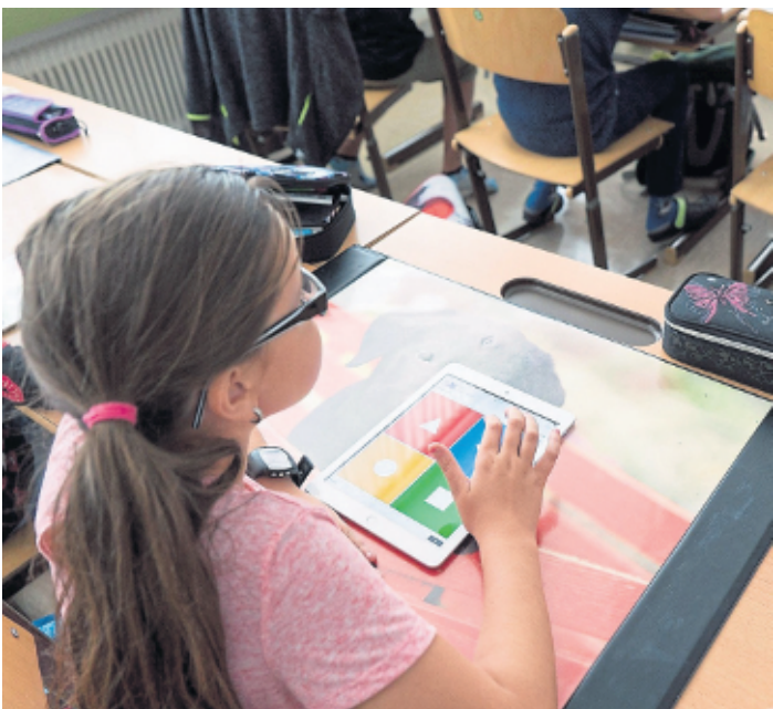
Die Kölner Schulen sollen ein kommunales Medienzentrum zur Seite gestellt bekommen.

dem Weg der Digitalisierung der Kölner Schulen: „Hiermit unterstützen wir nicht nur die medienpädagogische Arbeit der Lehrenden, sondern schaffen gleichzeitig für unsere rund 140.000 Schüler die besten Voraussetzungen für dauerhaft digitales Lernen.“ Neben der Beratung bietet das Zentrum auch Workshops, Seminare und Fachtagungen. Schülern wird der sichere und souveräne Umgang mit Medien vermittelt, um sie zu verantwortungsvollen Anwendern heranwachsen zu lassen. Die ersten Veranstaltungen und Workshops werden voraussichtlich in der zweiten Jahreshälfte 2022 stattfinden. Das volle Leistungsspektrum des Medienzentrums wird in 2023 angeboten werden können, nachdem die Einrichtung eigene Räumlichkeiten in Köln-Mülheim bezogen hat.