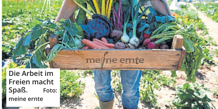
Die Arbeit im Freien macht Spaß.

Köln. Auch in diesem Jahr kann in Köln wieder gegärtet werden. Und zwar nicht nur auf heimischem Grund, sondern auch in Gemüseärten zum Mieten. Dort finden Neulinge sowie erfahrene Gärtner von Anfang Mai bis Ende Oktober ihr Gartenglück, können dem Gemüse beim Wachsen zuschauen und mit den Händen in der Erde wühlen – beispielsweise über den Anbieter meine ernte.