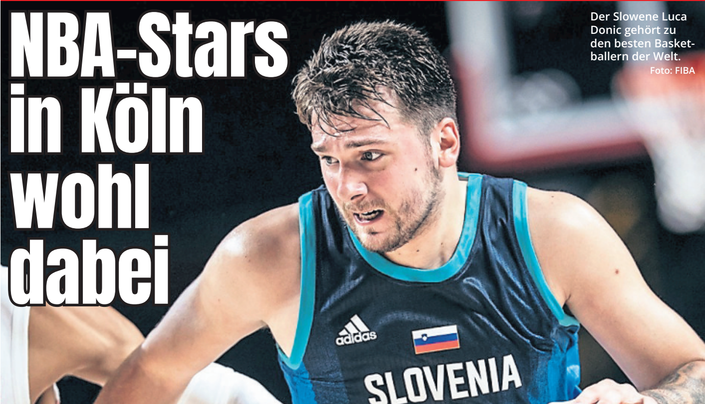
Der Slowene Luca Doncic gehört zu den besten Basketballern der Welt.

Luca Doncic und Co. sollen bei der Basketball-EM in der Arena auflaufen