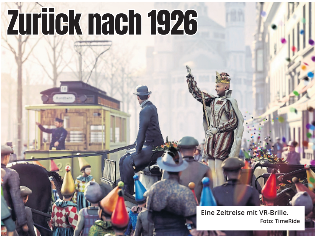
Eine Zeitreise mit VR-Brille.

Kölsche Tön schallen durch die Altstadt, die Pandemie ist überstanden. Der Karneval ist zurück und damit auch das kölsche Jefeühl. Was klingt wie eine Geschichte aus der nahen Zukunft liegt bereits knapp 100 Jahre zurück. In den Goldenen Zwanzigern herrschte eine Aufbruchstimmung in Köln, die lange vermisst wurde. Am Alter Markt kann diese emotionale Zeit im TimeRide nacherlebt werden. Die Zeitreise startet mit einem kurzen Erklärfilm im eigens eingerichteten „Schauspielhaus“. Historische Originalaufnahmen zeigen den Karneval im Jahr 1914, bevor der Erste Weltkrieg, die Besetzung der Briten und die Spanische Grippe das jecke Treiben lange nicht zuließen. Mit dem Abzug der Briten 1926 erwachte die kölsche Seele wieder und zum ersten Mal seit zwölf Jahren war der Karneval zurück in Köln. Anhand des kölschen Bahnfahrers Pitter und der le-