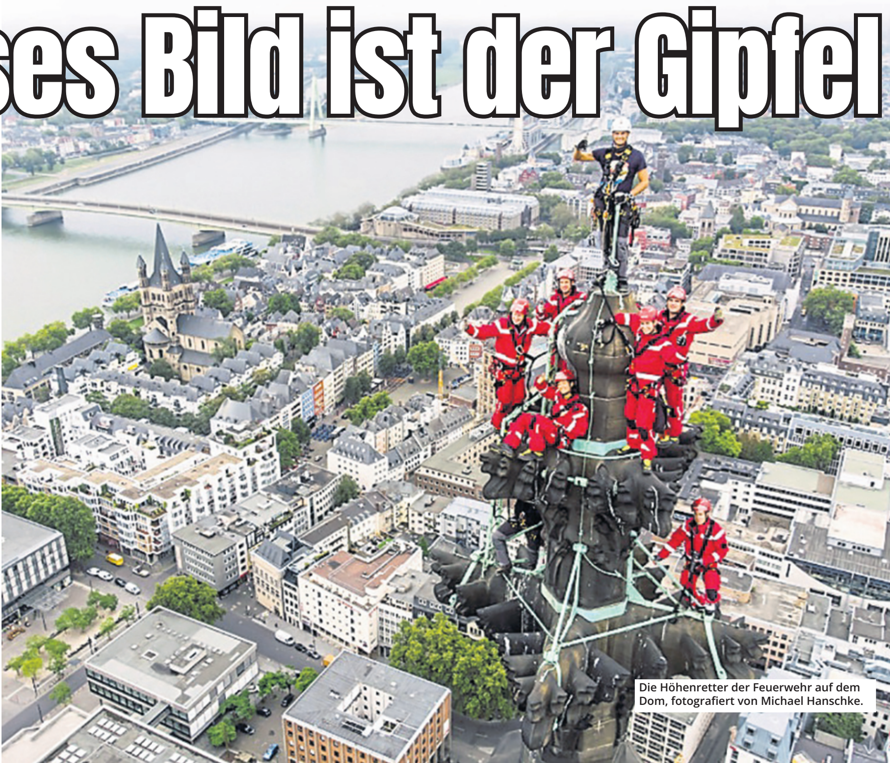
Die Höhenretter der Feuerwehr auf dem Dom.

Die Höhenretter müssen regelmäßig Übungen absolvieren – etwa am Köln-Turm, an Riesenrädern und am Fernsehturm Colonius. Dabei werden die Mitglieder der Spezialeinheit – 43 Männer und eine Frau – im Klettern und im Einsatz aus dem Hubschrauber ausgebildet. Den Dom bestiegen die Feuerwehrleute selbst, zunächst durch die Treppenhäuser der Türme und anschließend über kleine Leitern an der Fassade. Bis zur Spitze dauerte es etwa eine halbe Stunde, das Foto entstand auf dem Südturm. Wenige Tage später gab es tatsächlich einen Ernstfall in einem der Domtürme, als eine Frau dort im Treppenhaus einen internistischen Notfall erlitt und von den Höhenrettern heruntergebracht wurde.