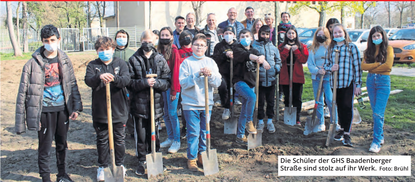
Die Schüler der GHS Baadenberger Straße sind stolz auf ihr Werk.