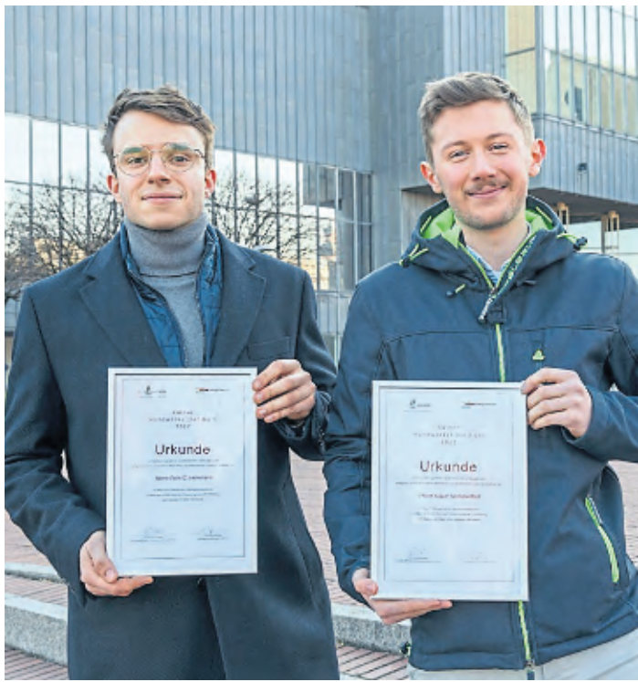
Die beiden Stipendiaten.

Lesen Sie jetzt am Sonntag, 3. April, den großen Talk mit Sternekoch Tim Raue