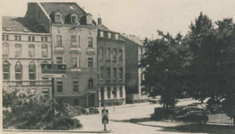
Rechtsabbiegespur Viktoriabrücke: Viele Bürger fordern einen sicheren Überweg

Bei vielen hat es schon geläutet. Bereits seit mehreren Wochen besuchen die MitgliederInnen des SPD-Ortsvereins Bonn-West Endenicher Haushalte. Grund für diese rege "Reisetätigkeit" ist das Bestreben des Ortsvereins, sich nach den Sorgen und Wünschen der Endenicher Bevölkerung in ihrem Stadtteil zu erkundigen. Schließlich soll in Zukunft Kommunalpolitik bürgernah durchgeführt werden.