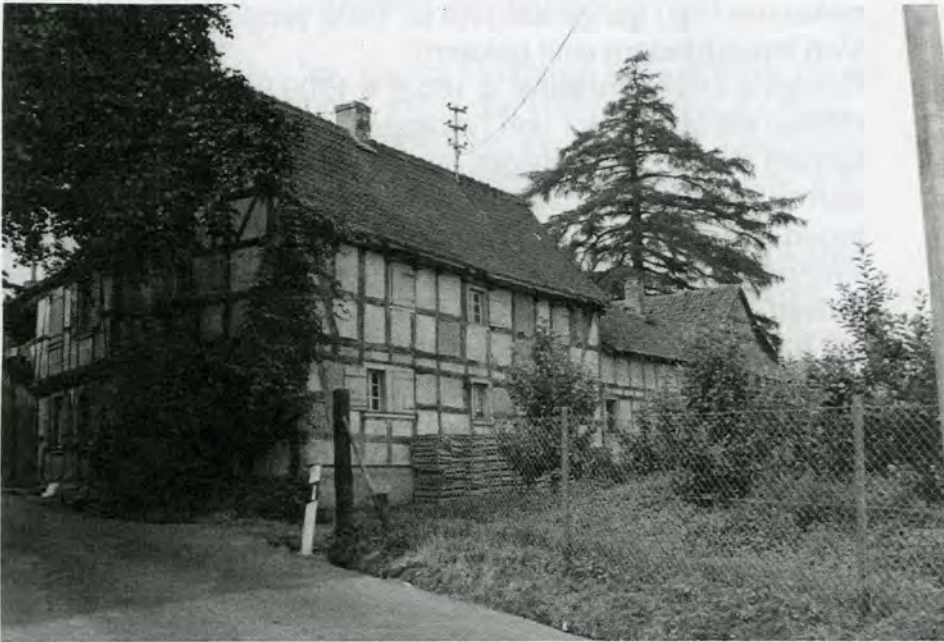
Rechshof um 1957

Lieber Leser von „Unser Alter“, wer sich das Titelbild des Siepertshof und hier des Rechshof betrachtet, stellt sich sicher die