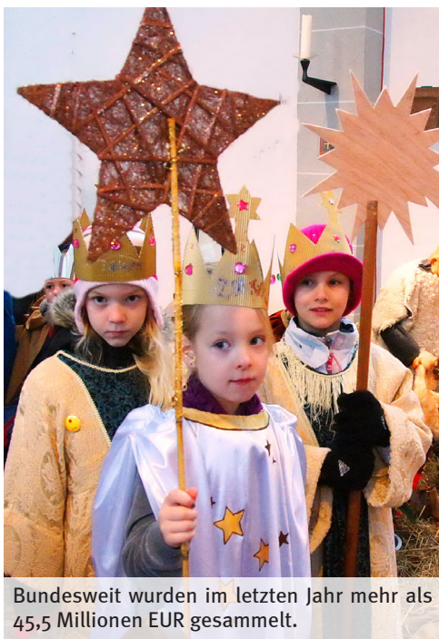
Bundesweit wurden im letzten Jahr mehr als 45,5 Millionen EUR gesammelt.

Das diesjährige Thema der 58. Aktion Dreikönigssingen heißt „Segen bringen, Segen sein – Respekt für dich, für mich, für andere – in Bolivien und weltweit!“ . Die Sternsinger/-innen machen mit ihrem Motto gemeinsam mit den Trägern der Aktion Kindermissionswerk „Die Sternsinger“ und dem Bund der Deutschen Katholischen Jugend überall in Deutschland darauf aufmerksam, wie wichtig Respekt im Umgang der Menschen miteinander ist.