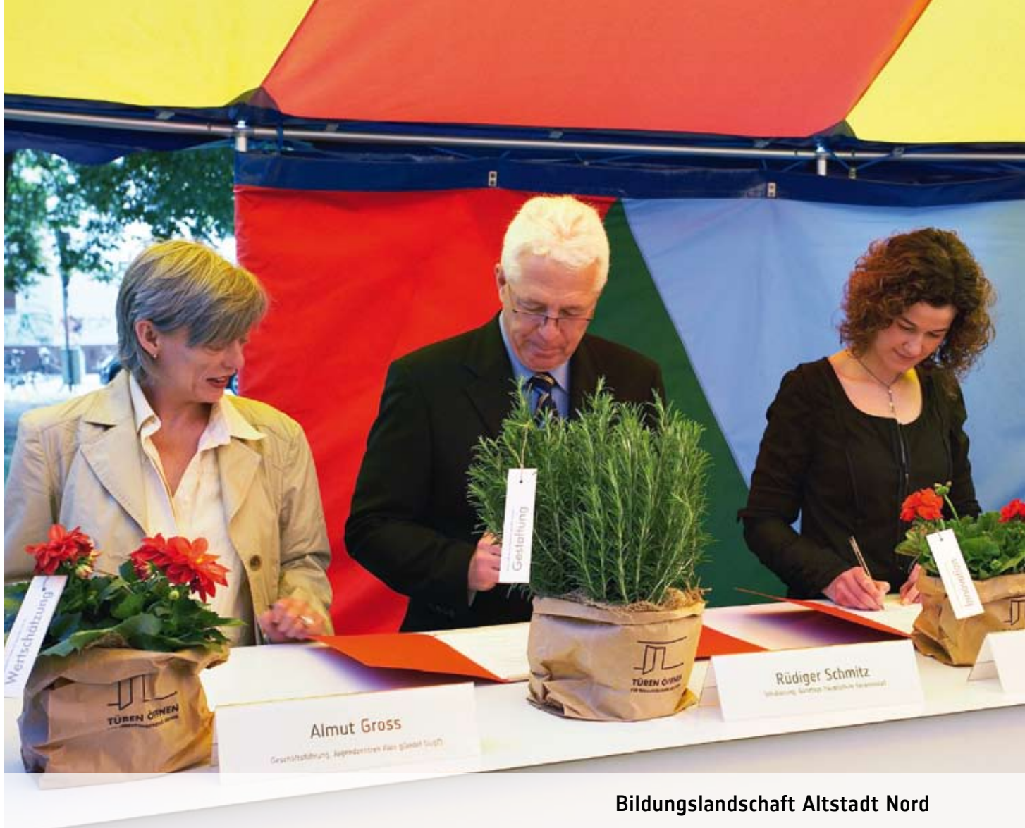
Bildungslandschaft Altstadt Nord