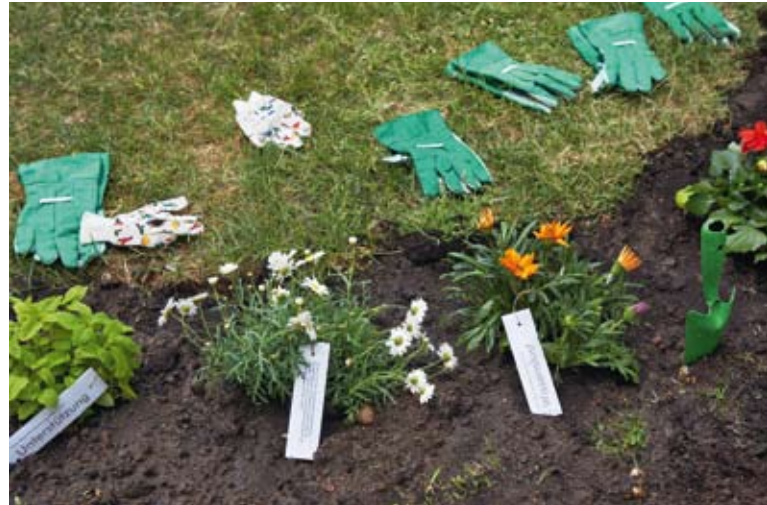
Blumen als Symbol für jede Bildungseinrichtung