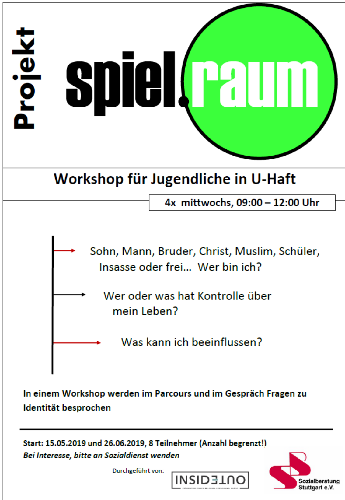
Abbildung 2: Aushang zum Angebot in der JVA