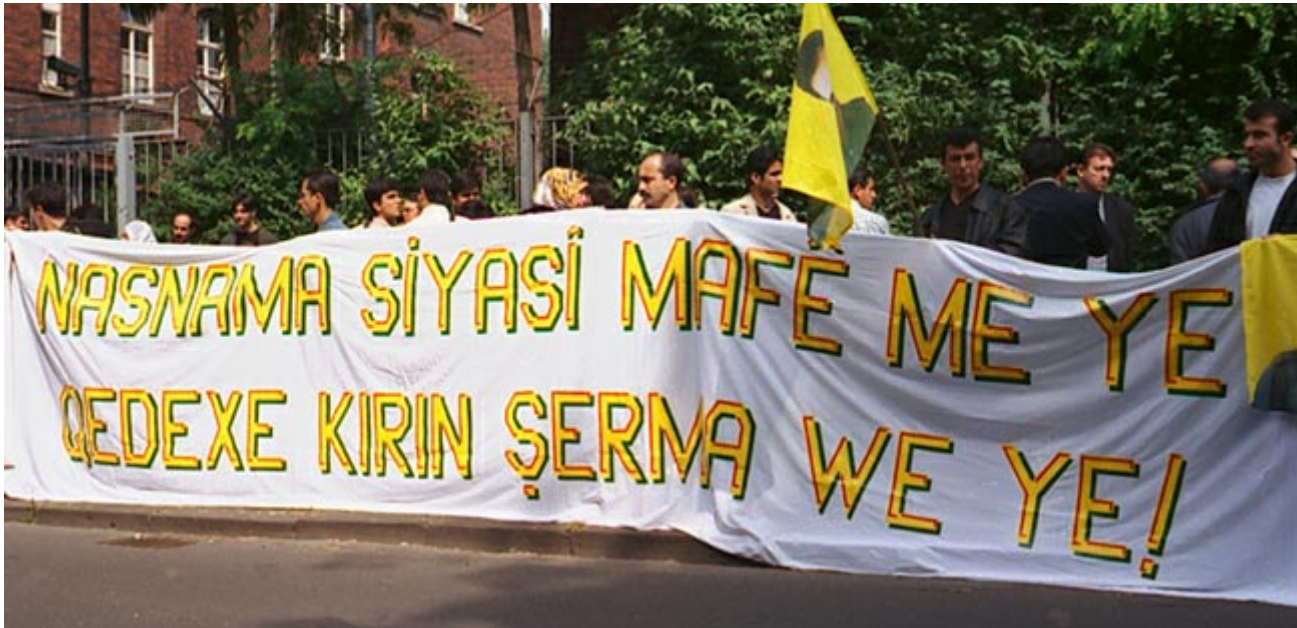
„POLITISCHE ANERKENNUNG IST UNSER RECHT! – DAS VERBOT IST EURE SCHANDE!“ Transparent auf der Kundgebung vor dem Düsseldorfer Oberlandesgericht am 13. Juni 2001, während der Übergabe von 1470 Unterschriften für die Identitätskampagne „Auch ich bin ein PKK’ler“ an das OLG Düsseldorf.

Am 13. Juni 2001 begann in Düsseldorf die europaweite Identitätskampagne mit der Forderung nach Anerkennung der sozialen, kulturellen und politischen Rechte für Kurdinnen und Kurden. Die ersten 1.470 Selbsterklärungen wurden dem Oberlandesgericht übergeben, wo zu diesem Zeitpunkt das Strafverfahren gegen den kurdischen Politiker Sait Hasso verhandelt wurde. In den folgenden Monaten haben Zehntausende Kurd(inn)en die Selbstbezeichnungen unterschrieben, die von Delegationen in zahlreichen Städten der Bundesrepublik an verschiedene politische Institutionen überreicht wurden.