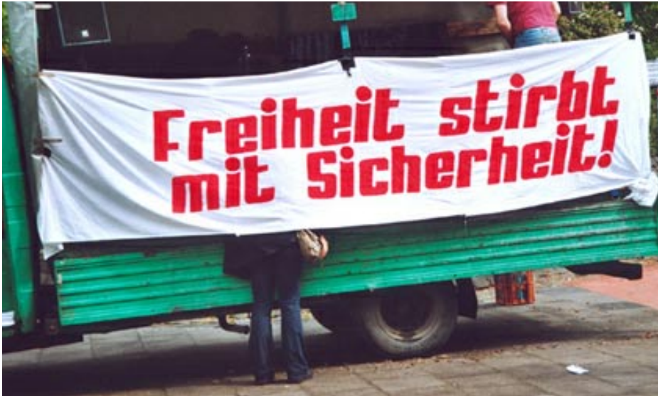
Demonstration vor dem Ausländerzentralregister in Köln am 25.5.2002