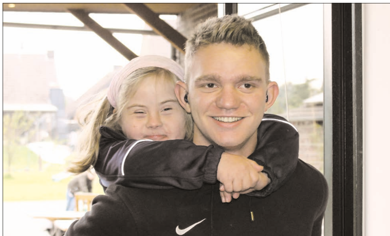
Den Alltag einfach mal hinter sich lassen und ein Lächeln in viele Gesichter zaubern.

Jedes Kind, jeder Jugendliche oder auch Erwachsene möchte ab und zu ohne Eltern oder Angehörige etwas erleben – allein, mit Freunden oder in einem Verein. Weil für Menschen mit Behinderung viele Aktivitäten ohne Begleitung aber nicht realisierbar sind, gibt es im FuD die Freizeitbegleiter*innen. Die Begleiter*innen ermöglichen dem Kind, Jugendlichen oder Erwachsenen eine Betreuung im häuslichen Umfeld beispielsweise zum Sport, ins Kino, in die Disco oder zum Stadtbummel. Freizeitbegleiter*innen begleiten einen Menschen individuell nach seinen Wünschen und