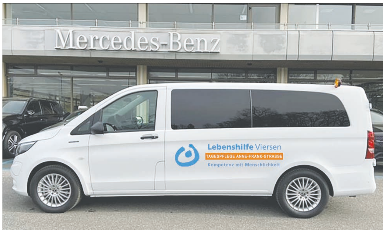
Der eVito bei der Abholung vor der Mercedes-Niederlassung Rhein-Ruhr in Duisburg

Zuvor baute im Januar die Firma AMF-Bruns den Bus rollstuhlgerecht um. Es können somit bei einem Rollstuhltransport bis zu fünf Personen mit diesem Fahrzeug befördert werden – ohne Rollstuhl sogar bis zu sieben. „Wir sind sehr froh, diesen Weg gegangen zu sein. Dies war zwar ein langer Weg, allerdings hat sich das Warten gelohnt. Wir sind stolz, unse-