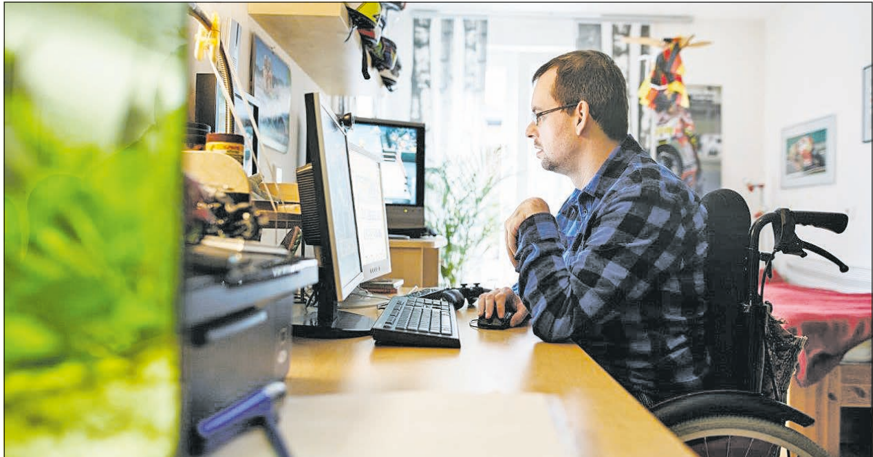
Glücklich über seinen neuen Arbeitsplatz (Symbolbild). Auch im Homeoffice wird unterstützt.