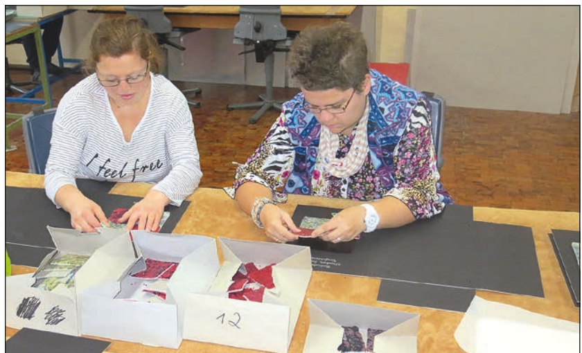
Kreative Herstellung von Dokumentenmappen

Die Zusage für einen ersten Auftrag in Höhe von 500 Stück liegt vor. Doch Aufträge sind das eine, die 60-Jährige will mehr. Helene Godau möchte gemeinsam mit den Werkstattbeschäftigten mit dem Upcycling-Projekt einen