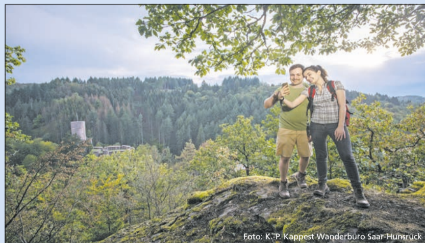
Erlebnisreiche Nationalparkregion Hunsrück-Hochwald

Überall säumt Moos den Wegesrand, schmale Pfade führen über Wurzeln und Felsblöcke,