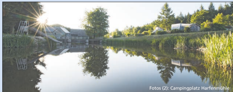
Idylle pur am See auf dem Campingplatz Harfenmühle

Gewinnen Sie einen Aufenthalt auf dem Fünf-Sterne-Campingplatz Harfenmühle: Vier Übernachtungen für die ganze Familie, gern inklusive Hund. Im Preis inbegriffen sind die Stellplatzgebühren für den eigenen Wohnwagen, Reisemobil oder Zelt sowie Strom. Exklusive sonstige Nebenkosten. Dazu gibt es eine geführte Wan-