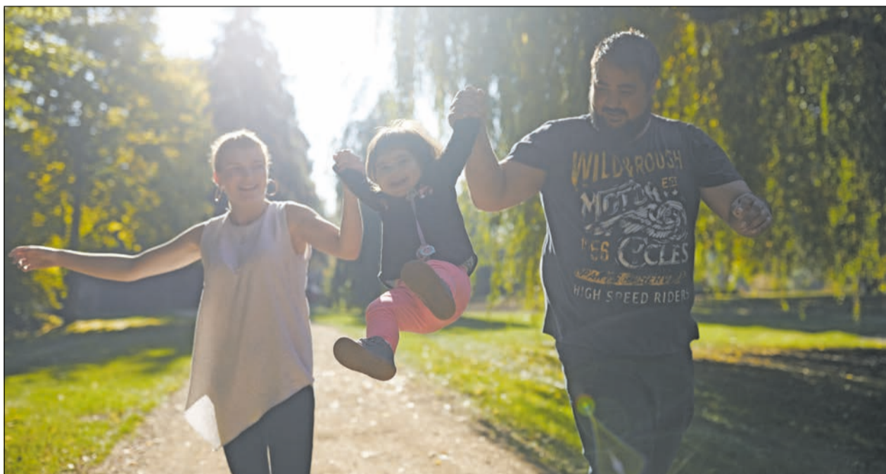
Angebote für Familien laufen weiter.

Die pandemiebedingten Einschränkungen stellen viele Familien vor besondere Herausforderungen und Belastungen. Dies gilt insbesondere für Familien mit Kindern oder Angehörigen mit Behinderung. Viele gewohnte Aktivitäten, so auch die Gruppenangebote im Lebenshilfe Center Siegen und im Freizeittreff Regenbogen, können zurzeit nicht stattfinden. Noch mehr als sonst stellen Angehörige ihre eigenen Bedürfnisse hinten an.