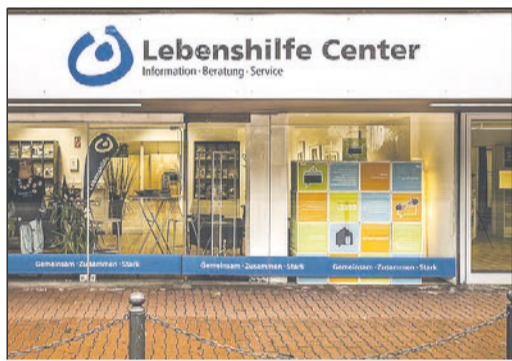
Das Lebenshilfe Center in Siegen

Hier kann der FUD auch in Pandemiezeiten für Entlastung sorgen: Ein Mitarbeiter des FUD begleitet das Kind oder den erwachsenen Angehörigen mit Behinderung bei Freizeitaktivitäten oder zu Hause. Spazieren gehen, Spiele spielen, malen, basteln – die Unterstützung kann individuell gestaltet werden. „Gerne beraten wir Sie auch zu