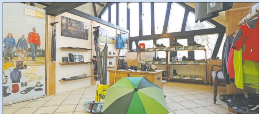
Neues Testcenter für Wanderer: Coole Ausrüstung kostenfrei ausleihen

Senden Sie uns eine E-Mail mit dem Betreff „Gewinnspiel Hunsrück Harfenmühle“ bis 27. Juli 2021 an gewinnspiel@lebenshilfe-nrw.de oder eine Karte/Brief per Post an Lebenshilfe NRW, Kennwort: „Gewinnspiel Hunsrück Harfenmühle“, Abtstraße 21, 50354 Hürth. vw