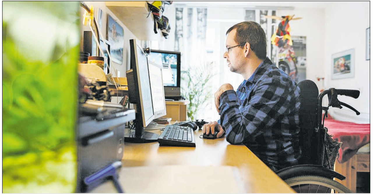
Glücklich über seinen neuen Arbeitsplatz (Symbolbild). Auch im Homeoffice wird unterstützt.