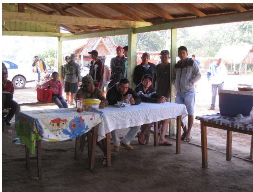
Fischerversammlung Cachuela Esperanza bei Guayaramerín, Foto: Thilo Papacek

Die Rechercheergebnisse der Reise sollen 2020 in einer Broschüre „Die gefährdeten Quellflüsse des Amazonas“ veröffentlicht werden.