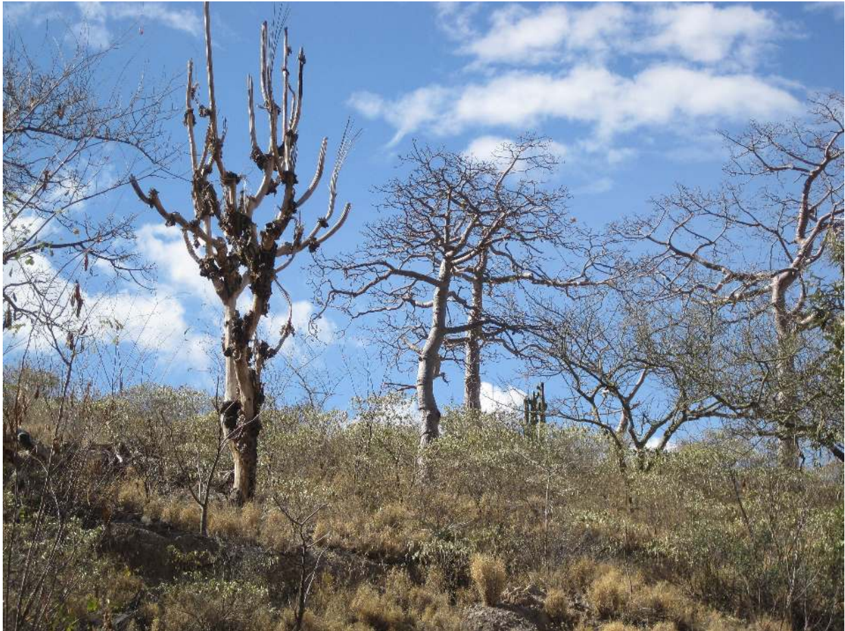
Im Marañón-Tal.