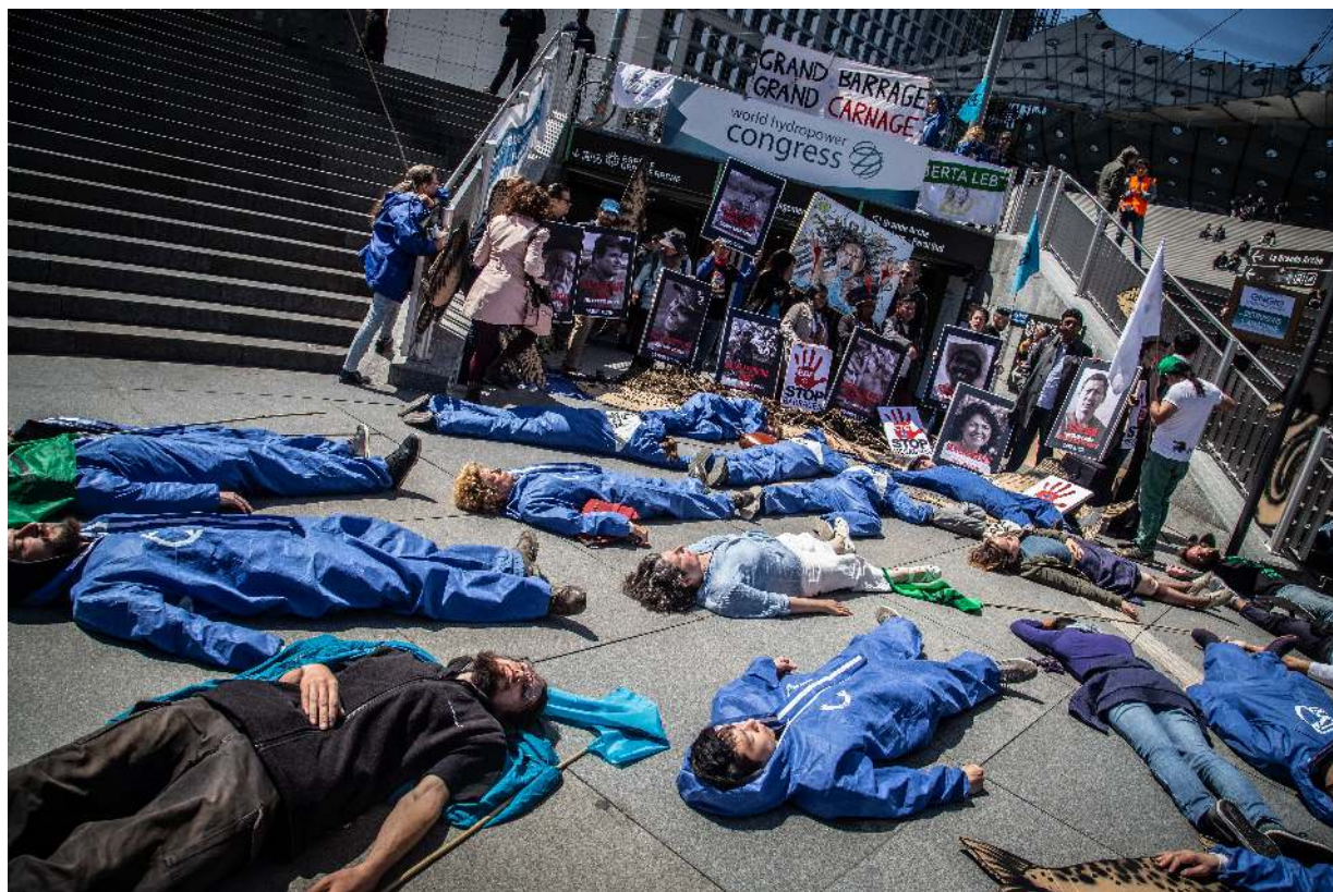
Protestaktion anlässlich der Weltwasserkonferenz

Am folgenden Tag fand ein parlamentarisches Frühstück zum gleichen Themengebiet wie die Tagung statt. Zu diesem hatte der Abgeordnete Uwe Kekeritz (Fraktion Bündnis 90 / Die Grünen) geladen. Dort gaben wir erneut den geladenen Südgästen die Gelegenheit, über die problematischen Folgen der Wasserkraft, insbesondere für indigene Gemeinschaften und die Umwelt, aufzuklären. Dabei wurde auch auf die Teilnahme deutscher Unternehmen an problematischen Wasserkraftprojekten und die Förderung solcher Projekte durch die deutsche Außenwirtschaftsförderung und Entwicklungsbanken (KfW, DED und KfW-Ipex) hingewiesen. In Folge des Treffens wurde eine Kleine Anfrage der Bundestagsfraktion Bündnis 90 /