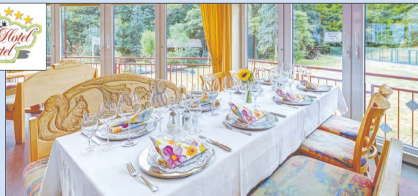
Genussvoll speisen im Wintergarten