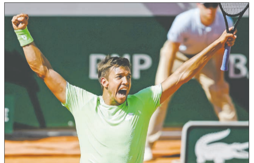
Jubelschrei: Andreas Mies gewann im Doppel mit Partner Kevin Krawietz auch die French Open 2020.

Auf dem Tennisplatz zeige ich oft Emotionen und bin sehr ehrgeizig.