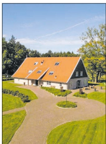
Das schöne und toll gelegene Ferienhaus De Sterre in Overijssel lädt zum Verweilen ein.

Auch eine Reise in das wunderschöne Ferienhaus De Sterre in Overijssel in den Niederlanden steht im kommenden Jahr auf dem