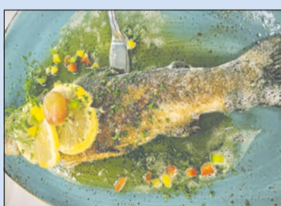
Spessartforelle aus eigenen Teichen, in Mandelbutter gebraten

Eine einzigartige Natur erwartet Sie im Räuberland, im Herzen des Spessarts mit einem der größten zusammenhängenden Mischwaldgebiete Deutschlands im Naturpark Spessart. Schon Kurt Tucholsky hat sich bei seinem Besuch über die herrliche Landschaft und das ein-