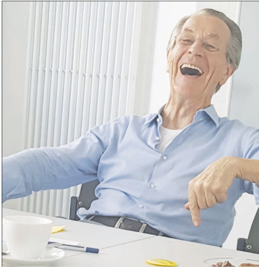
Gut drauf: der ehemalige Vizkanzler Franz Müntefering im Interview bei der Lebenshilfe Herne

Franz Müntefering: Helfen und sich helfen lassen ist das wichtigste Motiv für gemeinschaftliches Zusammenleben. Wir sind alle aufeinander angewiesen. Manchmal gibt es in unserer Gesellschaft die Arroganz, dass Menschen denken, sie bräuchten keine Hilfe und selbst wollen sie sich auch nicht ehrenamtlich einsetzen. Das ist falsch. Wir alle brauchen Hilfe und wir alle können auch helfen, mit unterschiedlichen Möglichkeiten. Es ist wichtig, dass wir den Menschen vermitteln, dass wir aufeinander angewiesen sind. Es hat sich in der Corona-Zeit an einigen Stellen besser gezeigt, als ich vermutet hatte. Ich habe von vielen gehört, dass Menschen einander geholfen haben. Beim Ehrenamt sollte es in den Ver-