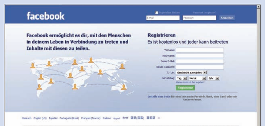
Screenshot Startseite Facebook

Die Vorzüge des sozialen Netzwerkes sind klar: Man bleibt mit seinen Freunden in Kontakt, präsentiert sich, eigene Fotos, Videos, Botschaften. Mitmachen kann jeder. Reinklicken, anmelden, los geht's. Das gesamte Angebot von Facebook mit allen Funktionen ist kostenlos. Infos unter www.facebook.com