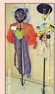
Zechen-Haken künstlerisch gestaltet.

Die Lebenshilfe NRW freut sich über jeden „Kumpel“, der Interesse an dieser Aktion hat. Auch Haken-Spenden – ein Haken kostet 50 Euro – sind gerne gesehen. Für Firmen besteht auch die Möglichkeit, die ei-