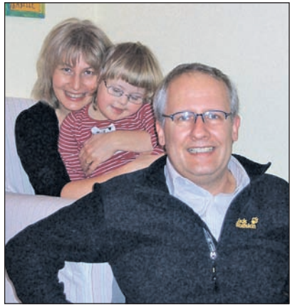
Familie Schoepf

Eine gute Versorgung bei der Lebenshilfe ist möglich. Ehepaar Schoepf aus Bonn hat eine Tochter mit Downsyndrom und ist seit mittlerweile mehr als vier Jahren Mitglied bei der Lebenshilfe Bonn.