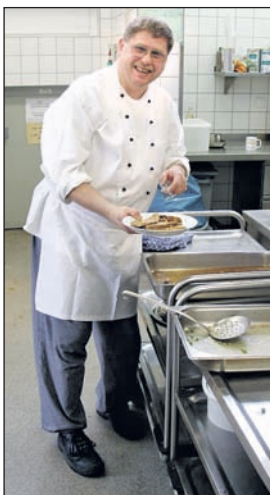
Andreas Decker

Beliebtes barrierefreies Hotel: Im Hotel Fit in Much im Bergischen Land arbeiten Menschen mit Behinderung und kümmern sich um einen besonderen Service für die Gäste: „Im Hotel gibt es tolle Möglichkeiten Menschen mit Behinderung zu beschäftigen“, sagt Hotelleiter Martin Bünk. Die Gäste freuen es. Denn die Menschen, die im Hotel arbeiten, kümmern sich liebevoll um ihre Gäste.