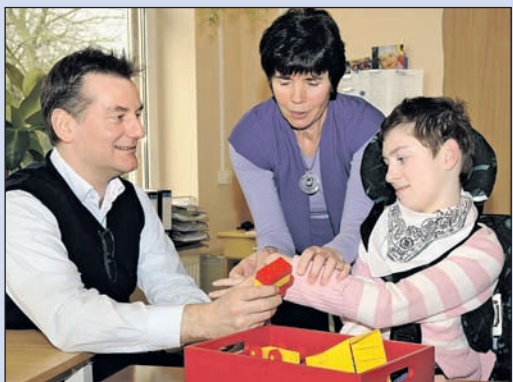
Landtagsabgeordneter Bodo Wißen während seines Einsatzes.

schen Hilfsmitteln zur Erleichterung der täglichen Pflege und ließ sich die Bedienung der Geräte interessiert erklären. Der Snoezelraum und dessen Atmosphäre sind ihm ebenfalls positiv aufgefallen. Nach dem Mittagessen im Speisesaal verabschiedete sich der Landtagsabgeordnete von den Menschen mit geistiger und körperlicher Behinderung und deren Gruppenleitern. Er bedankte sich für die neu gewonnenen Eindrücke und die freundliche Zusammenarbeit mit den Menschen.