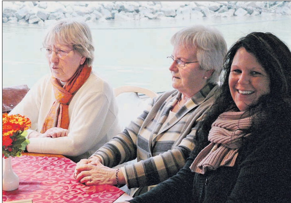
Freiwillig Engagierte verbringen einen netten Nachmittag an Bord der „Stadt Rees“.

Haben Sie Interesse, Ihre eigenen Ideen mit einzubringen und sich freiwillig bei der Lebenshilfe Unte-