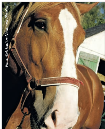
Hochwertige Sattelschränke für Pferde.