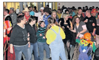
Lustiges Treiben in der Werkstatt Wesel.

um das Thema „Reisen mit dem Pkw“. Zuerst brachte die Truppe um Andre Brosius eine Neufassung des Liedes „Gar nicht mehr so weit nach