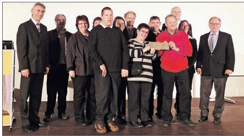
Oben und links: Gewinner des 1. Sonderpreises bei der Robert-Jungk-Preis-Verleihung.