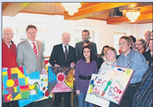
Künstler und Käufer des internationalen Künstlerworkshops.

man-Museum und anschließend in den Niederlanden ausgestellt. Endlich sind sie in ihre Heimat zurückgekehrt und standen nun für ihre Käufer zur Verfügung. Die Übergabe der Bilder fand am 3. Dezember 2009 um 11.00 Uhr im Konferenzraum der Lebenshilfe Unterer Niederrhein statt. Neben den Künstlern und Käufern war auch der amtierende Bürgermeister der Stadt Rees, Christoph Gerwers, anwesend. Der Erlös der Aktion soll weiteren integrativen Kunstprojekten zugutekommen. So wird sich die Lebenshilfe Unterer Niederrhein im kommenden Jahr an der Aktion „Hak dich ein, Kumpel“ im Rahmen der Ruhr 2010 beteiligen.