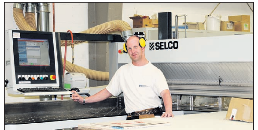
In der sanierten Werkstatt bereitet das Arbeiten noch mehr Freude.

Es folgte der Verpackungsbereich. Hier waren umfangreiche Schallschutzmaßnahmen durchzuführen und ein neuer Boden einzubringen. Unvermeidlich war auch hier der Umzug aller Gruppen in die ehemalige Schreinerei. Parallel dazu begann die Sanierung der Sanitär- und Umkleieräume im Elektrobereich. Erstmals wurde in der Werkstatt ein Belag aus Epoxidharz-Verbundstoffen eingesetzt, der sich durch extreme Belastbarkeit auszeichnet. Die Optik ließ nichts zu wünschen übrig, es bot sich ein helles und freundliches Bild. Der eingebrachte Schallschutz tat sein Übriges, die Atmosphäre im Verpackungsbereich nochmals zu verbessern. So konnten Mitarbeiter und Gruppenleiter nach einem kurzen Zeitraum ihre neuen alten Räume gut gelaut beziehen.