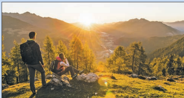
Erlebnisreiche Wanderungen – auch für die ganze Familie – bietet die Nationalparkregion Hohe Tauern Kärnten mit dem mehr als 70 m hohen Wasserfall Göbnitzbach.

ein Paradies für all jene, die sich gerne in der Natur aufhalten. Zwischen Großglockner, den Dolomiten und den Kärntner Seen spannt sich eine einzigartige Urlaubswelt, die Bergnaturlust. Von den Bergbahnen in der Region über die Schluchtenwege der Wilden Wasser bis hin zum emotional tief berührenden Naturerlebnis, das eine geführte Tour mit einem Nationalpark-Ranger ermöglicht, all das erleben Sie mit der Nationalpark Kärnten Card. Es ist ein erheben-