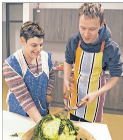
Mit Spaß bei der Arbeit mit ungewöhnlichem Küchengerät

Der Familien unterstützende Dienst der Lebenshilfe Heinsberg hat 2018 einen neuen Band der „Kochwerkstatt“ veröffentlicht,