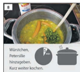
Auszüge des Rezepts in Leichter Sprache