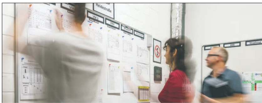
Bessere Zusammenarbeit zwischen Führungskräften und Mitarbeitern erreichen.

Neues Management-System mit großem Erfolg eingeführt