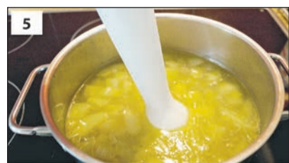
Nach dem Kochen mit einem Pürierstab pürieren.

Aus: Kochwerkstatt des Familienunterstützenden Dienstes der Lebenshilfe Heinsberg in Leichter Sprache