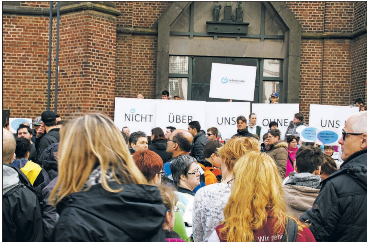
Demo der Lebenshilfe Rhein-Kreis Neuss auf dem Grevembroicher Marktplatz

Demo der Lebenshilfe Rhein-Kreis Neuss e.V. und anderer Lebenshilfen