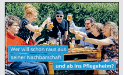
Wer will schon raus aus seiner Nachbarschaft und ab ins Pflegeheim?

Verlust des Zuhauses? Neue Kampagne der Lebenshilfe soll auf kritische Punkte des Bundesteilhabegesetzes aufmerksam machen