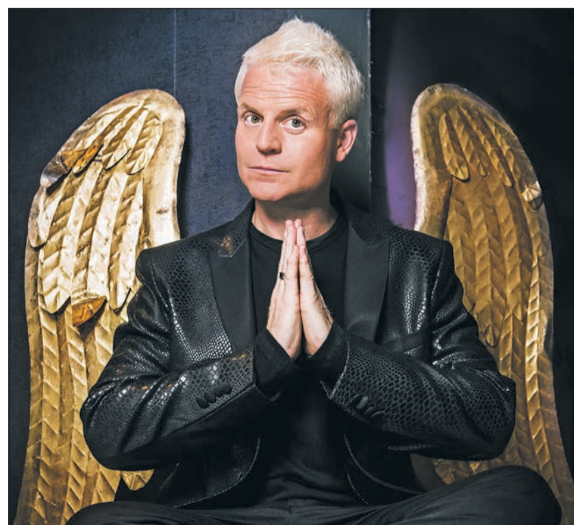
Guido Cantz sanft wie ein Engel: Neue Comedytour „Blondiläum – 25 Jahre Best of Guido Cantz“ startet ab 30. September.