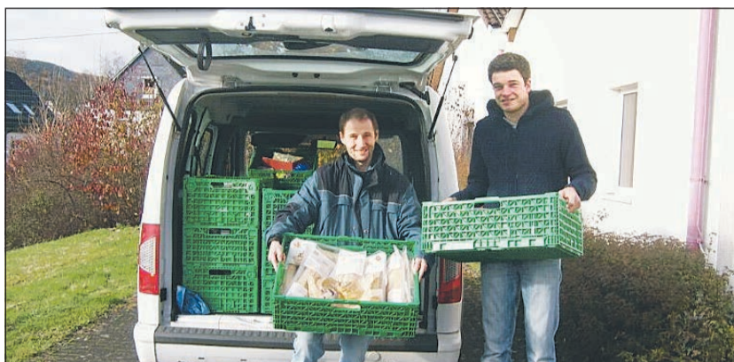
Helfer holen Lebensmittel bei der Siegener Tafel ab.