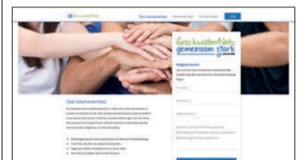
So sieht die Startseite des GeschwisterNetzes aus.

S ie sind unter besonderen Bedingungen groß geworden und fühlen sich als Erwachsene oft für ihren Bruder oder ihre Schwester verantwortlich: erwachsene Geschwister von Menschen mit Behinderung. GeschwisterNetz ist ein neues Online-Angebot der Bundesvereinigung Lebenshilfe. Es soll erwachsene Geschwister von Menschen mit Behinderung verbinden, unterstützen und stärken.