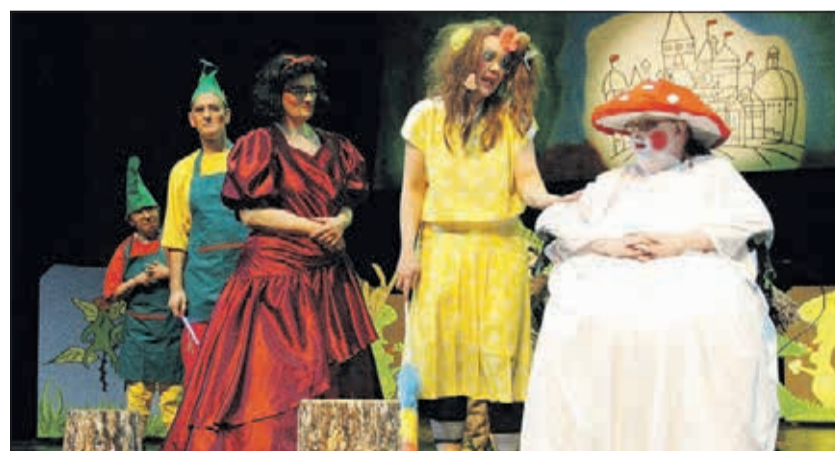
Tolle Kostüme: die Theatergruppe Blindflug bei der Aufführung 2013 im Stadttheater Oberhausen

Die integrative Theatergruppe Blindflug besteht derzeit aus 26 Laiendarstellern, davon 17 mit Behinderung: „Wir sind wie eine große Familie“, sagt Heidrun Wetterich, die die Gruppe seit ihrer Gründung 2007 ehrenamtlich leitet und viel Zeit in die Vorbereitungen des neuen Stückes investiert. Bühnenbild organisieren, Kostüme besorgen, Schauspieler schminken, Plakate und Karten entwerfen. Denn die Uraufführung von „Jackie, the Kid“ findet am 10. April im großen Haus im Stadttheater Oberhausen vor etwa 500 Zuschauern statt. Und bis dahin heißt es proben, proben, proben. „Es macht mir unheimlich Spaß und Freude zu sehen, was sich in der Zusammenarbeit entwickelt. Wie selbstbewusst und cool die Menschen mit Behinderung