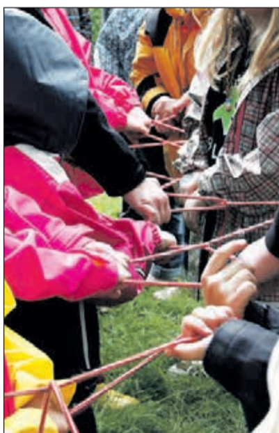
Spiel und Spaß für Kinder

Laut und bunt geht es jeden 1. und 3. Samstagnachmittag im Lebenshilfe Center Siegen zu. Von 14 bis 17 Uhr trifft sich die „Lebenshilfe Rasselbande“. Auf dem Programm steht für die sieben bis 13 Jahre alten Teilnehmer bei jedem Termin ein abwechslungsreiches Angebot: Kegeln, Stadt-Rallye, Minigolf, Kickern, Spiele für drinnen und draußen oder Backen – bei jedem Termin erwartet die kleinen Teilnehmer ein tolles Programm. Fachkräfte und Ehrenamtliche kümmern sich um die Kids, während die Eltern den Samstagnachmittag für eigene Erledigungen oder einen Stadtbummel in der nahen City nutzen können. Auch Kinder, die aufgrund ihrer Behinderung eine intensivere Begleitung benötigen, können den Nachmittag ohne Eltern bei der „Lebenshilfe Rasselbande“ verbringen. Nach Absprache