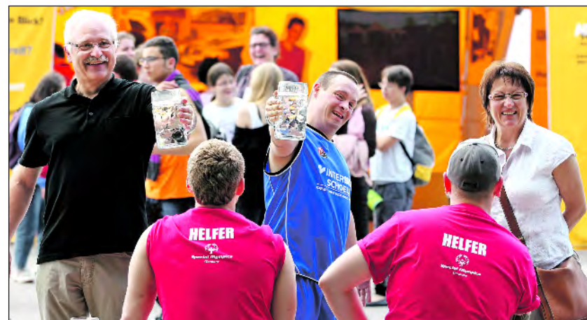
Helfer im Einsatz bei den Special Olympics 2012 in München

Inhaber Utto Reugels, der das Unternehmen 1978 gegründet hat: „Menschen mit Behinderung werden in verschiedenen Bereichen eingesetzt und können so ihre Fähigkeiten auf dem ersten Arbeitsmarkt entfalten.“ vw