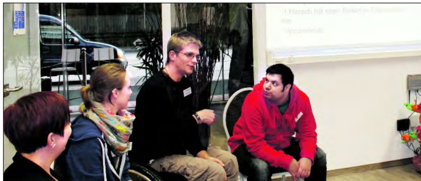
Nutzer und Mitarbeiterinnen des Lebenshilfe Centers Olpe berichten.

Menschen mit Behinderung wollen WG-Projekt in Siegen starten