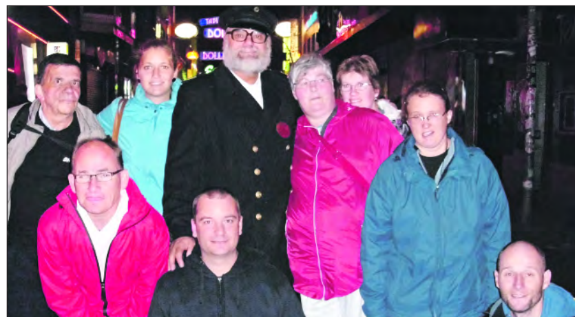
Die Reisegruppe mit dem Nachtwächter auf der Reeperbahn.

Auch ein Abstecher ins Hamburger Nachtleben durfte für die Reisenden nicht fehlen. Mit dem Nachtwächter ging es vom Hafen aus zum Kiez in St. Pauli. Es wurde getanzt und gelacht. Am letzten Tag waren sich alle einig: „Oh, Hamburg meine Perle!“ om/mvw