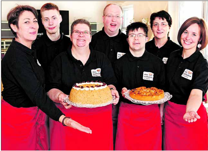
Das Team vom „kääffchen“ freut sich auf Sie und verwöhnt mit selbst gebackenen Kuchen und Torten.