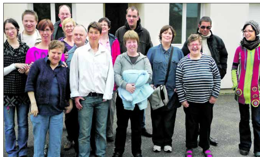
Gute Laune in Loches: Mitarbeiter der Werkstatt Lebenshilfe mit ihren französischen Gastgebern.

In der Jugendherberge im Centre Aquillon waren die Wermelskirchener untergebracht – auf Einladung der Stadt Loches. Verpflegungs- und Fahrtkosten hat die Werkstatt Le-