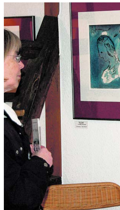
Ein Besuch in der Kunstgalerie lohnt sich.

Die Ausstellung ist jeden Sonntag von 15 bis 18 Uhr und jeden Mittwoch von 15 bis 17 Uhr geöffnet.