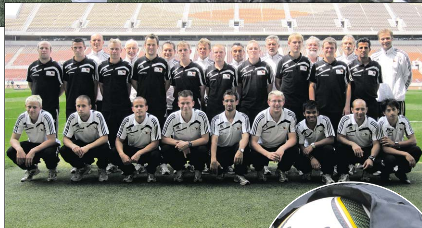
Deutsches Team in Südafrika.

Beim anschließenden Galadiner in einer traditionellen afrikanischen Lodge im Umland von Polokwane dankten die Veranstalter den