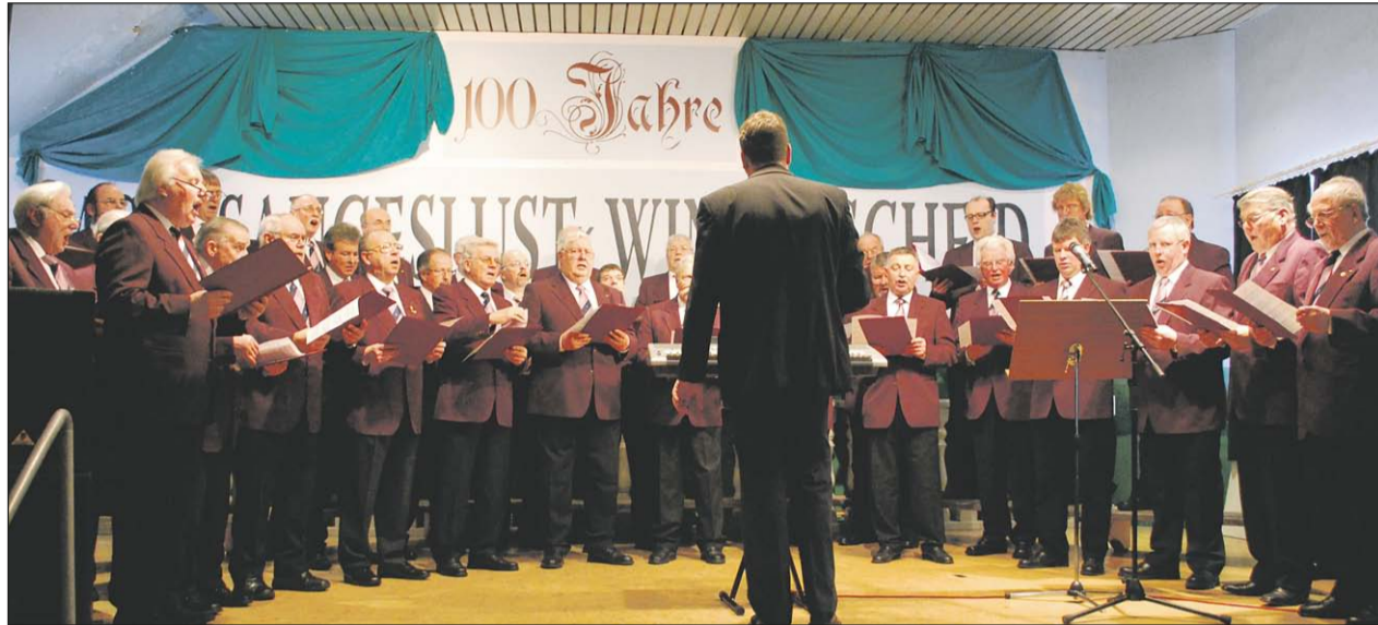
Die Herren des MGV Sangeslust Winterscheid.

Ich bin grundsätzlich gerne im Verein, früher sagte man ja: „Das ist ein Vereinsmeyer.“ Ich habe mich dem Gesang irgendwie „verschrieben“, das steht bei uns auf der Fahne drauf. Ich organisiere gerne den Verein und finde neue Ziele, sowie neue Aspekte für die Zukunft heraus. Manchmal muss man auch ein „dickes Fell“ haben und sich über