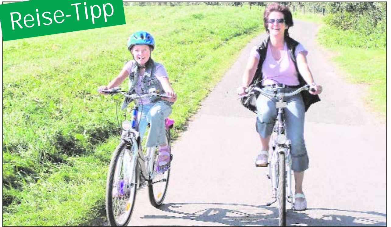
Radeln durch NRW macht Spaß.