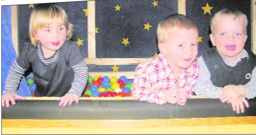
Spiel und Spaß im Haus Bröltal.

suche nach Gespenstern und Geistern im Haus Hochheide in Hennef. Hier gibt es sogar einen eigenen