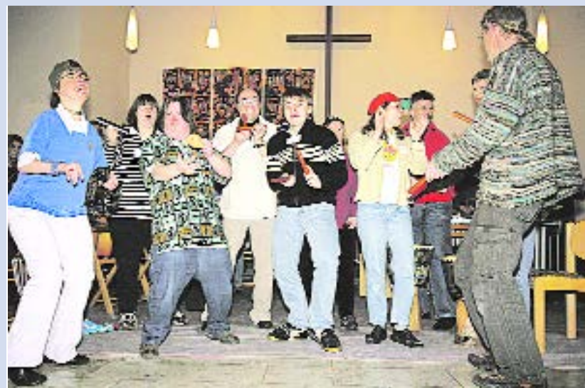
Tolle Stimmung: Menschen mit und ohne Behinderungen machen gemeinsam Musik.

habe ich die Songs von Rock am Ring in die Probe der Jazzband mitgenommen. Da konnten die Jazzer sich musikalisch austoben und über die Harmonien spielen. Das klang rockig und die Melodien waren leicht zu merken. Es entstanden Blä-