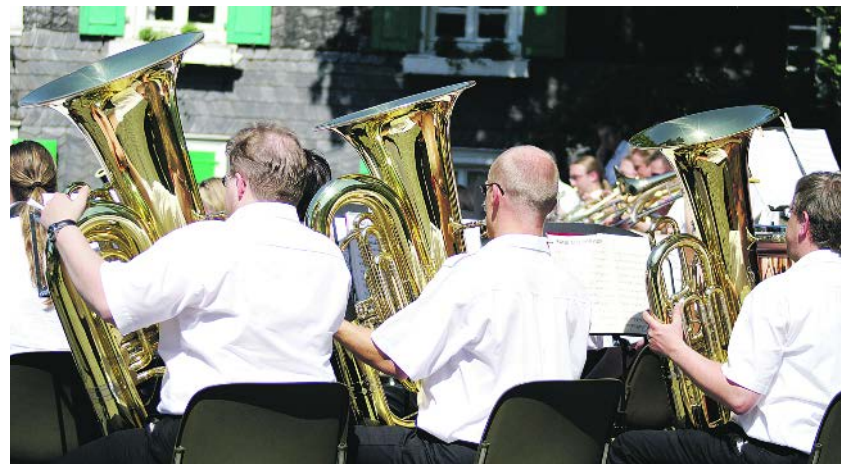
Schützen sorgen für Stimmung.

Und 2008? Heute engagieren sich die Schützen in ihren Vereinen im Bereich Jugend- und Sozialarbeit und versuchen jungen Mitgliedern Werte wie Gemeinschaftsgefühl und Respekt im Umgang mit Mitmenschen zu vermitteln. Gemeinschaft, Spaß am Schießen und Zusammenhalt untereinander stehen dabei im Mittelpunkt. Und der Kontakt zu Menschen aus der Gemeinde. So ist die Schützenzeit mehr als nur Bierbrause und Partysause. (vv)