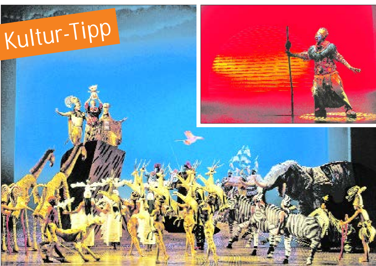
Ein Traum von Afrika: das Musical König der Löwen.

Informationen und Anregungen zur barrierefreien Gestaltung von Arztpraxen gibt der Flyer „Barrierefrei zum Arzt“, der auf den Internetseiten der Landesbehindertenbeauftragten unter www.lbb.nrw.de bestellt werden kann.